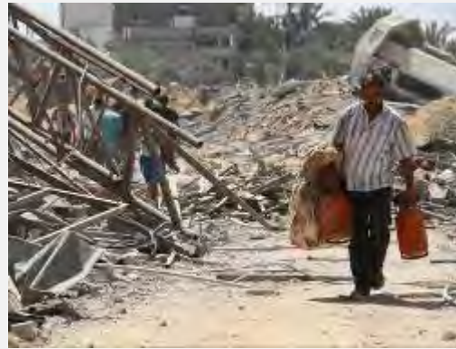
Des résidents palestiniens rentrent à Khirbet Khizeh (Gaza Alan, 5 août 2014)