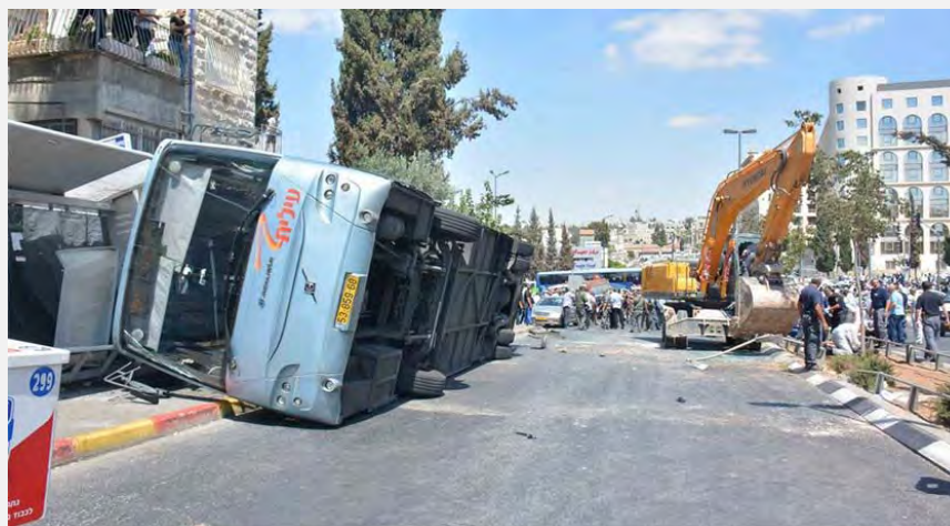
Scène de l'attaque à Jérusalem (Police d'Israël, 4 août 2014)

6. Ce n'est pas la première fois qu'un attentat est commis avec un tracteur à Jérusalem. Dans le cadre des attaques effectuées selon la stratégie palestinienne de "résistance populaire", ce modus vivendi a été utilisé à plusieurs reprises. Le caractère létal de ces attaques est relativement élevé et elles sont généralement commises par des terroristes isolés. Entre 2000 et 2008, vingt attaques au tracteur ont été commises, provoquant la mort de 15 personnes. Dans trois attentats de ce genre commis à Jérusalem, deux ont impliqué un bulldozer et ont fait trois morts et plus de cent blessés (Services de sécurité générale : "Caractéristiques des attentats de la décennie écoulée"). 1