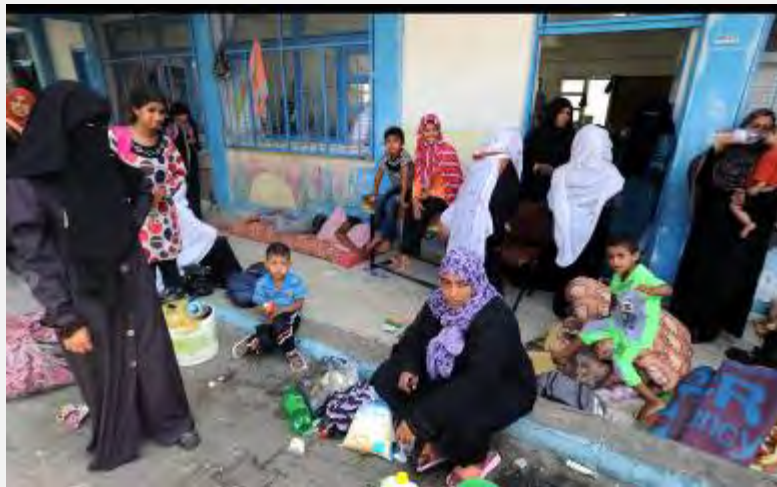
Résidents de la bande de Gaza dans une école de l'UNRWA