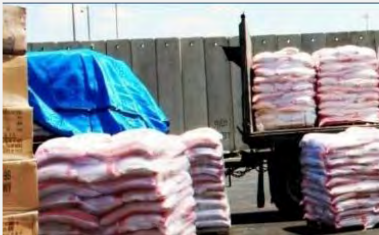
Transfert d'approvisionnement à la bande de Gaza via le terminal d'Erez (Site Internet du coordinateur des activités du gouvernement dans les territoires, 4 août 2014)

26. Depuis le début de l'opération, 1737 camions chargés de vivres, de médicaments et de matériel médical sont entrés dans la bande de Gaza via le terminal de Kerem Shalom. Par ailleurs, de l'essence a été transférée pour la centrale électrique de Gaza, ainsi que de l'essence pour véhicules et du gaz de cuisine (Site Internet du coordinateur des activités du gouvernement dans les territoires, 4 août 2014).