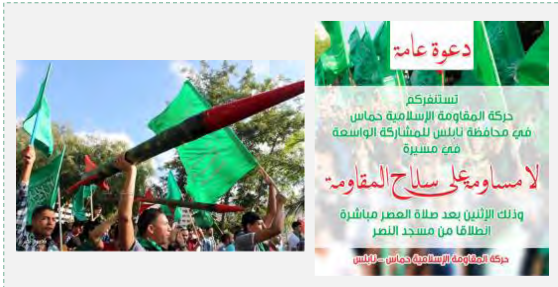
Droite : Affiche appelant à manifester. Gauche : Manifestation durant laquelle des drapeaux du Hamas et des maquettes de roquettes ont été arborés (Page Facebook du Bloc islamique de l'Université al-Najah, 4 août 2014)

titre "Pas de marchandage sur les armes de la résistance". De nombreux Palestiniens ont participé à la manifestation et ont arboré des drapeaux du Hamas et des maquettes de roquettes (Page Facebook du Bloc islamique de l'Université al-Najah, 4 août 2014).