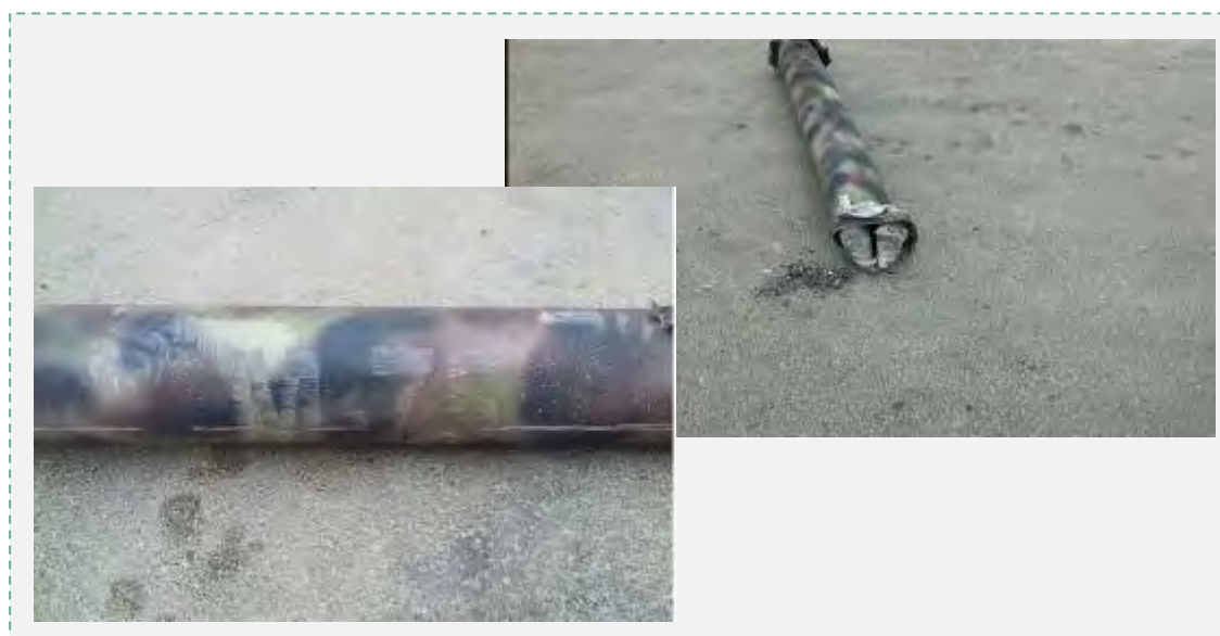
Débris d'une roquette M75 qui s'est abattue dans la région de Jérusalem. A gauche, on peut lire l'inscription M75 sur la roquette