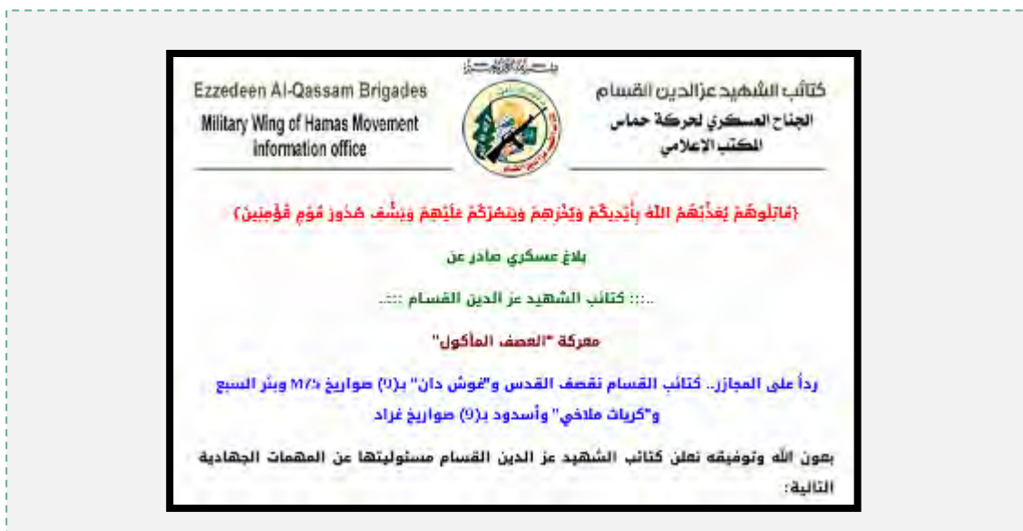
Le communiqué de la branche armée (Site Internet de la branche armée, 5 août 2014)