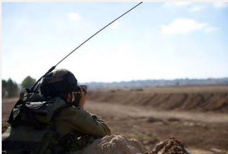
Un soldat observe la bande de Gaza durant l'entrée en vigueur de la trêve (Porte-parole de Tsahal, 5 août 2014)