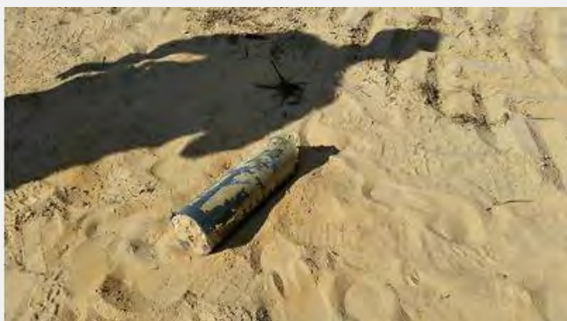
Restos de un impacto en una de las poblaciones del Consejo Regional Eshkol

7. Por la mañana del 8 de agosto de 2014, a las 08:00, en el momento en que terminó la vigencia del cese de fuego, comenzó el disparo de cohetes y bombas de mortero hacia Israel. La mayoría de los disparos se realizaron hacia las poblaciones del Neguev Occidental, principalmente hacia las poblaciones que están en la frontera con la Franja de Gaza, pero cayeron cohetes también en Ashkelon, en Sderot y en Beer Sheva. Desde que terminó el cese de fuego se detectaron en total 75 impactos de cohetes, la mayoría en el área del Neguev Occidental. Asimismo, se disparó una cantidad similar de bombas de mortero hacia las poblaciones de la frontera con la Franja de Gaza. Dos personas resultaron heridas por fragmentos de bombas de mortero y se ocasionaron daños a las propiedades.