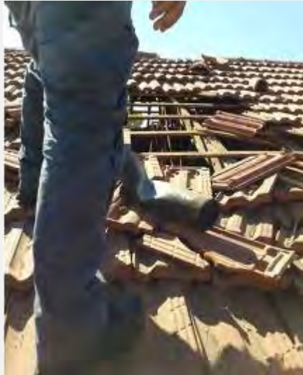
Impacto directo de cohete en una casa en Sderot (Voceros de los bomberos y el rescate del distrito sur, 10 de agosto de 2014)