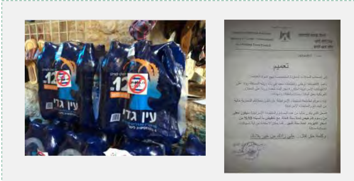
A la derecha: La carta que llama a boicotear mercaderías israelíes y otorgando facilidades y descuentos a quienes lo hagan (GAZA ALAN, 9 de agosto de 2014). A la izquierda: Productos israelíes marcados, que está prohibido comprar. (página facebook PALINFO, 9 de agosto de 2014)