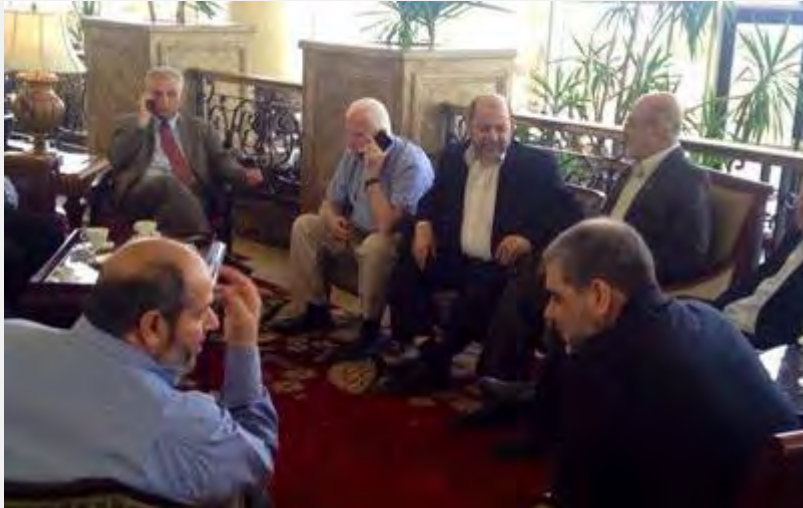
La delegación palestina en el Cairo (Filastin al An, 10 de agosto de 2014)