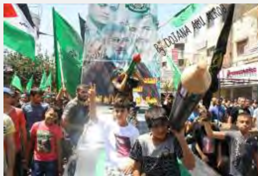
Desfile de apoyo a Gaza, que Hamás organizó en Hebrón