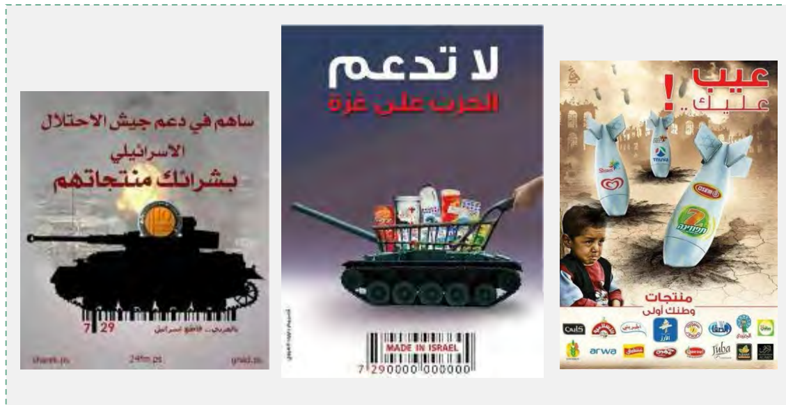
Carteles proclama que llaman a boicotear la producción de Israel. A la Derecha: “Usted contribuye al apoyo del ejército de ocupación Israelí al comprar sus productos” (página facebook del sector islámico en la Universidad al Najah, 8 de agosto de 2014). En el centro: “No apoye la guerra contra Gaza”, la canasta de productos israelíes es mostrada como un tanque israelí (página facebook de una red palestina de informaciones, 10 de agosto de 2014). A la izquierda: “la compra la hace usted”, cada compra de un producto israelí vuelve a Gaza por medio de un misil (página facebook GAZA ALAN, 7-8 de agosto de 2014)