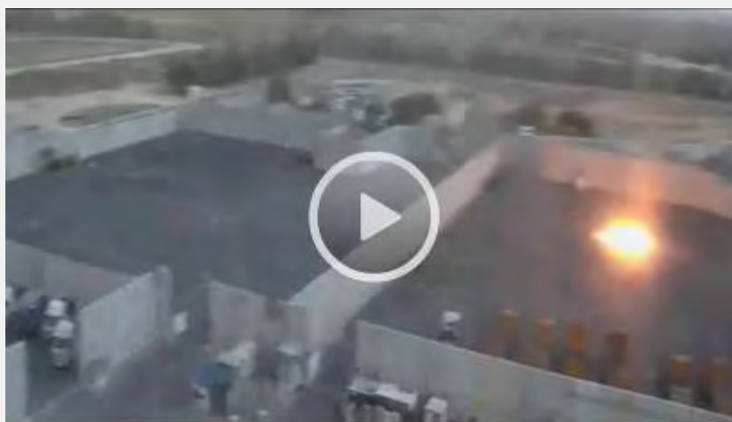
Una bomba de mortero explota en el cruce Kerem Shalom (de un Video de la Autoridad para los cruces, del Ministerio de Defensa, 10 de agosto de 2014)

13. Debido a dos cohetes caídos al lado del cruce Kerem Shalom el 10 de agosto de 2014 en horas de la mañana, se informó que el cruce se cerraba y su actividad se congelaba (Maan, 10 de agosto de 2014). El cruce se volvió a abrir pero un cohete caído cerca del cruce el mediodía del 10 de agosto de 2014, condujo nuevamente a que lo cerrasen.