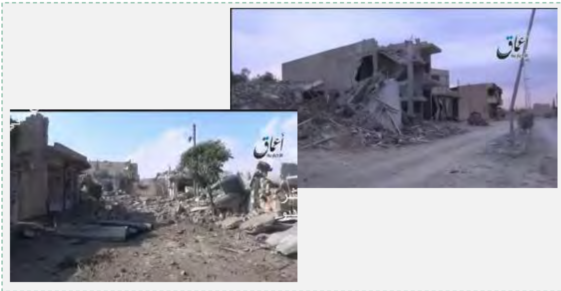
ההרס בקובאנה (יוטיוב, 4 בנובמבר 2014).

15. דאעש מצידו שמר על פרופיל תקשורתי נמוך בכל הנוגע למפלה שנחל בקובאנה, בניגוד בולט לקמפיינים התקשורתיים, שהוא נוהג לערוך לאחר ניצחונותיו. מטעמים תעמולתיים העדיף דאעש להציג את נסיגת כוחותיו מהעיר קובאנה כנובעת מההתקפות האוויריות של ארה"ב והקואליציה ולהצניע את חלקם המרכזי של הכוחות הכורדים במערכה על העיר. ההוצאות להורג של שני החטופים היפנים ושל הטייס הירדני תרמו גם הם, בראיית דאעש, להסטת תשומת הלב הערבית והבינלאומית מהמפלה, שהארגון נחל בקובאנה, לעבר ההתנהלות השוטפת של הארגון.