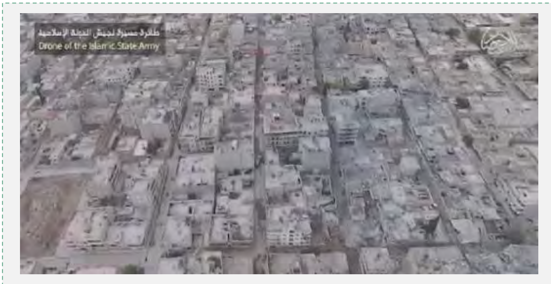
מתוך סרטון שצילם דאעש ב-27 באוקטובר 2014 באמצעות כטב"מ שבו טען כי הוא שולט בפאתיה המזרחיים והדרומיים של קובאנה. (יוטיוב, 27 באוקטובר 2014; אלערביה, 28 באוקטובר 2014).