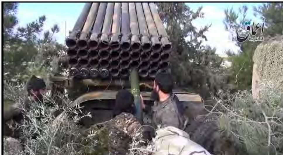
ירי רקטות בקובאנה ע"י לוחמים כורדים (דף הטוויטר של סוכנות אעאמק, 30 בינואר 2015).

א. בניגוד לעבר, ניצבו בקובאנה מול דאעש כוחות כורדים מאומנים היטב בעלי מורל גבוה וחדורי מוטיבציה, אשר היו מוכנים להילחם בחירוף נפש בהגנה על העיר וסביבותיה, המאוכלסים בכורדים ("מלחמה על הבית"). הכוח הכורדי הכיר היטב את השטח והיה ערוכים לקרבות רחוב בעיר לאחר, שכמעט כל תושבי העיר נמלטו ממנה. הסיוע האווירי והלוגיסטי של ארה"ב ובעלות בריתה והתגבורות שהגיעו מעיראק ומסוריה דרך תורכיה סייעו גם הם לכוח הכורדי הן מהבחינה המעשית והן מהבחינה המוראלית. מנגד הקשו ההתקפות האוויריות של הקואליציה על דאעש לרכז מאמץ בקובאנה ולתגבר את העיר בפעילים מאזורים אחרים.