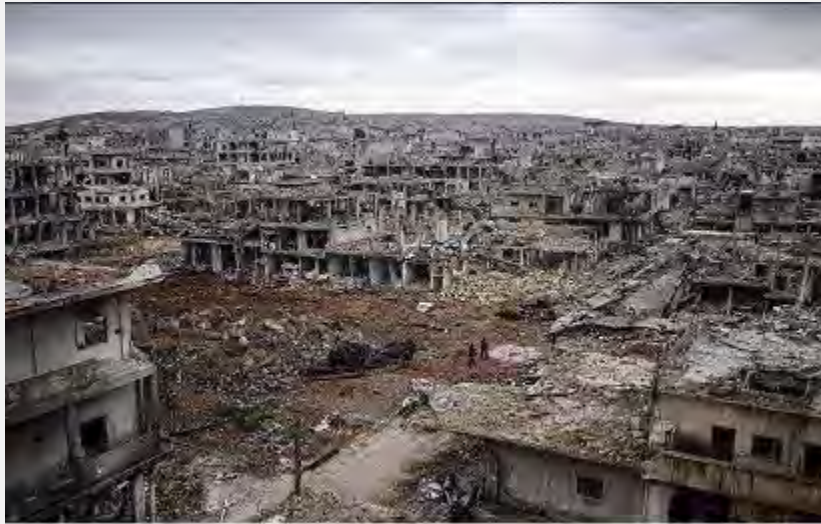
הריסות העיר קובאנה (עין אלערב) בתום כארבעה חודשי לחימה (דף הטוויטר עין אלערב, 2 בפברואר 2014)