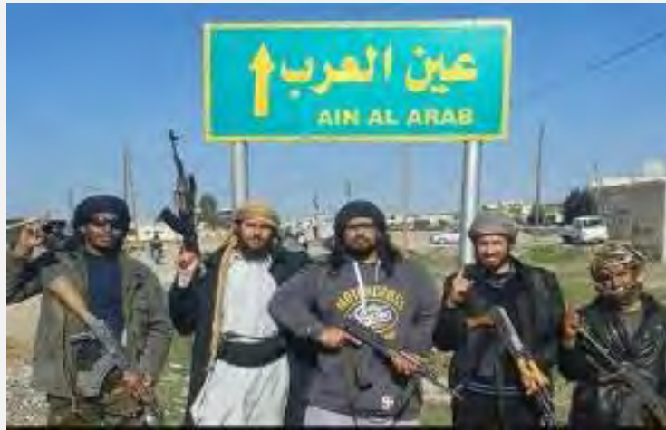
פעילי דאעש בעת הכניסה לעיר קובאנה.