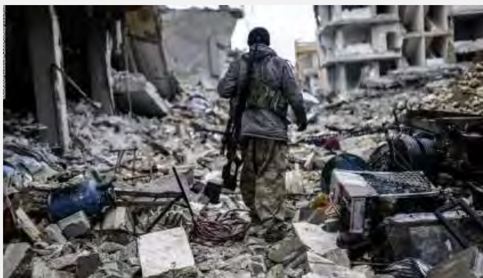
ההרס בקובאנה בעקבות הלחימה הממושכת (סוכנות ח'בר, 31 בינואר 2015).