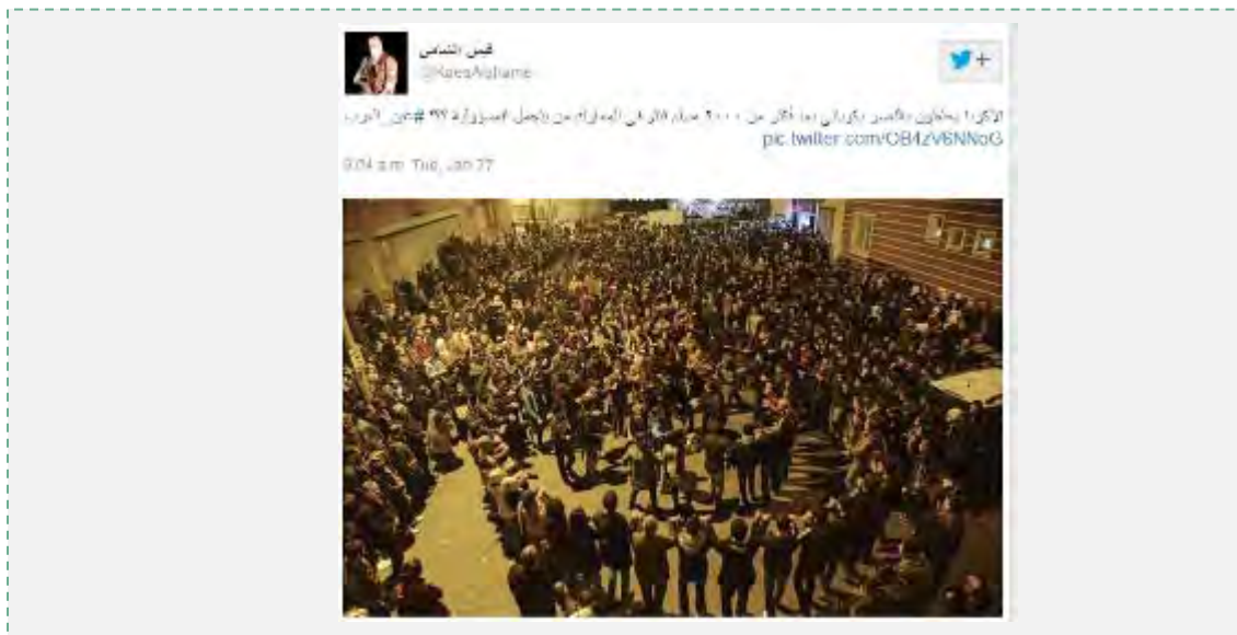
ביקורת על המפלה מהארגון היריב ג'בהת אלנצרה. חשבון טוויטר המזוהה עם ג'בהת אלנצרה (27 בינואר 2015) תחת הכיתוב: "הכורדים חוגגים את הניצחון בקובאנה לאחר שיותר מ-2,000 מוסלמים נהרגו בקרבות. מי הנושא באחריות?"

15. דאעש מצידו שמר על פרופיל תקשורתי נמוך בכל הנוגע למפלה שנחל בקובאנה, בניגוד בולט לקמפיינים התקשורתיים, שהוא נוהג לערוך לאחר ניצחונותיו. מטעמים תעמולתיים העדיף דאעש להציג את נסיגת כוחותיו מהעיר קובאנה כנובעת מההתקפות האוויריות של ארה"ב והקואליציה ולהצניע את חלקם המרכזי של הכוחות הכורדים במערכה על העיר. ההוצאות להורג של שני החטופים היפנים ושל הטייס הירדני תרמו גם הם, בראיית דאעש, להסטת תשומת הלב הערבית והבינלאומית מהמפלה, שהארגון נחל בקובאנה, לעבר ההתנהלות השוטפת של הארגון.