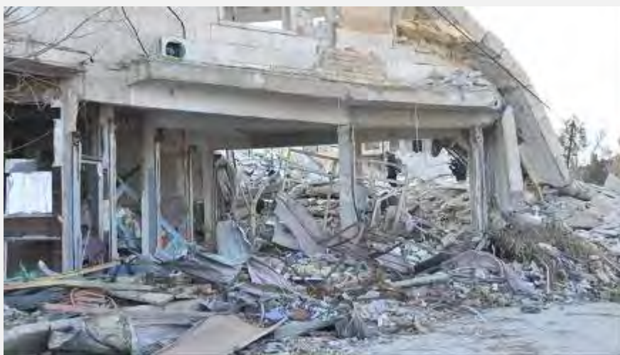
ההריסות בקובאנה בתום הלחימה