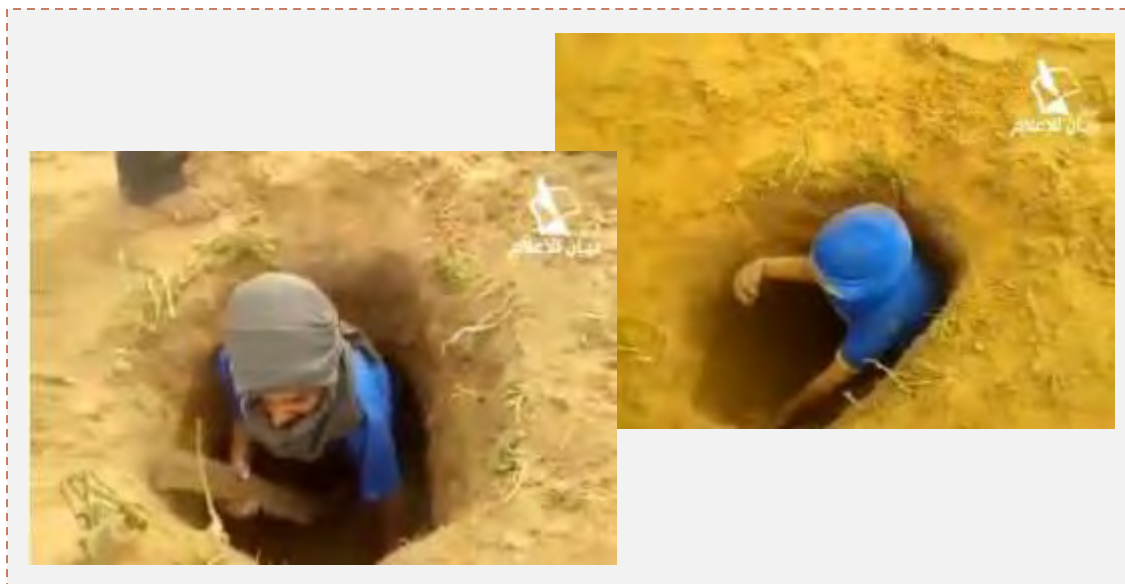
Справа: палестинский ребенок вылезает из тоннеля. Слева: ребенок с деревянной винтовкой вылезает из тоннеля (страница Фейсбук PALDF, 10 февраля 2015 г.)