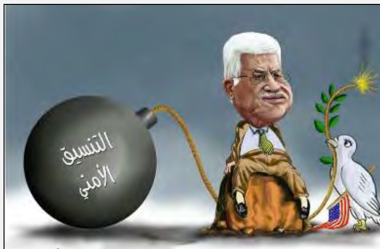
Карикатура, изображающая сотрудничество в области безопасности в виде бомбы, которая вот-вот взорвется. Надпись на арабском языке: "сотрудничество в области безопасности" (газета "Шааб", 12 февраля 2015 г.)