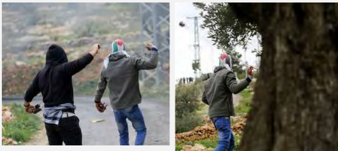
Молодые палестинцы бросают камни в направлении бойцов Армии Оборона Израиля в деревне Бильин, в ходе еженедельной демонстрации протеста против пограничного забора и поселений