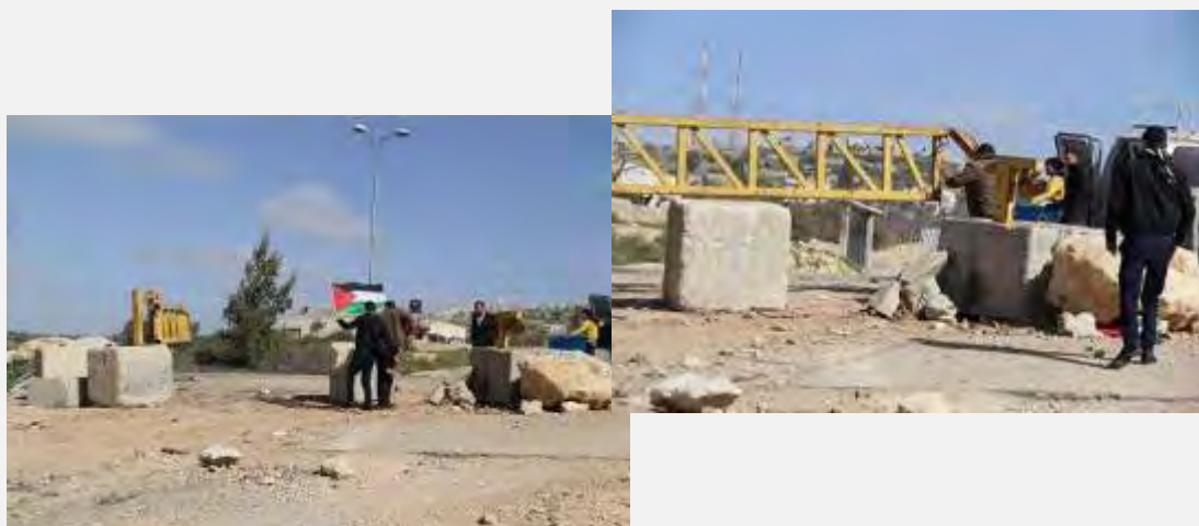
Боевики организации "Комитеты народного сопротивления" сносят железные ворота на въезде в деревню Джаба, к югу от г. Вифлеем

■ Боевики организации "Комитеты народного сопротивления" выкорчевали (12-го февраля 2015 г.) железные ворота на въезде в деревню Джаба, расположенную к югу от г. Вифлеем. Эти ворота были установлены Армией Оборона Израиля 14 лет назад. По утверждению палестинцев, эти ворота разделяют деревни Джаба и Цуриф и препятствуют передвижению палестинского транспорта между этими районами (агентство новостей МААН, 12 февраля 2015 г.).