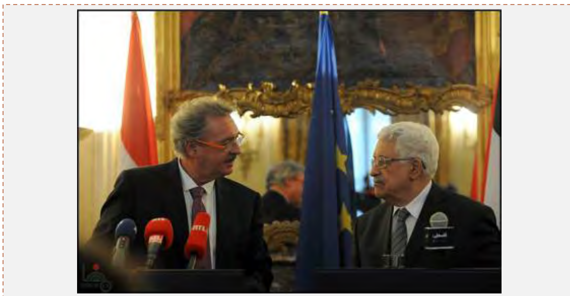
Махмуд Аббас в ходе совместной пресс-конференции с министром иностранных дел Люксембурга (агентство новостей ВАФА, 13 февраля 2015 г.)