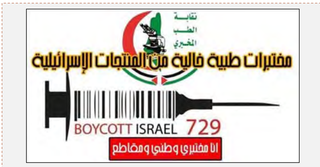
Объединение медицинских лабораторий бойкотирует израильскую продукцию (страница Фейсбук организации ФАТХ, 11 февраля 2015 г.)