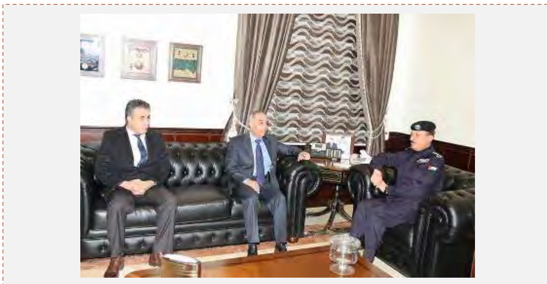
Высокопоставленные служащие палестинской президентской стражи встречаются в Раббат Амоне с Теуфиком Аль Туальбе, руководителем иорданской службы безопасности (страница Фейсбук палестинской президентской стражи, 13 февраля 2015 г.)