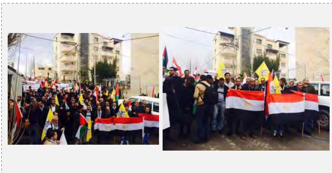
Митинг солидарности напротив здания посольства Египта в г. Рамалла