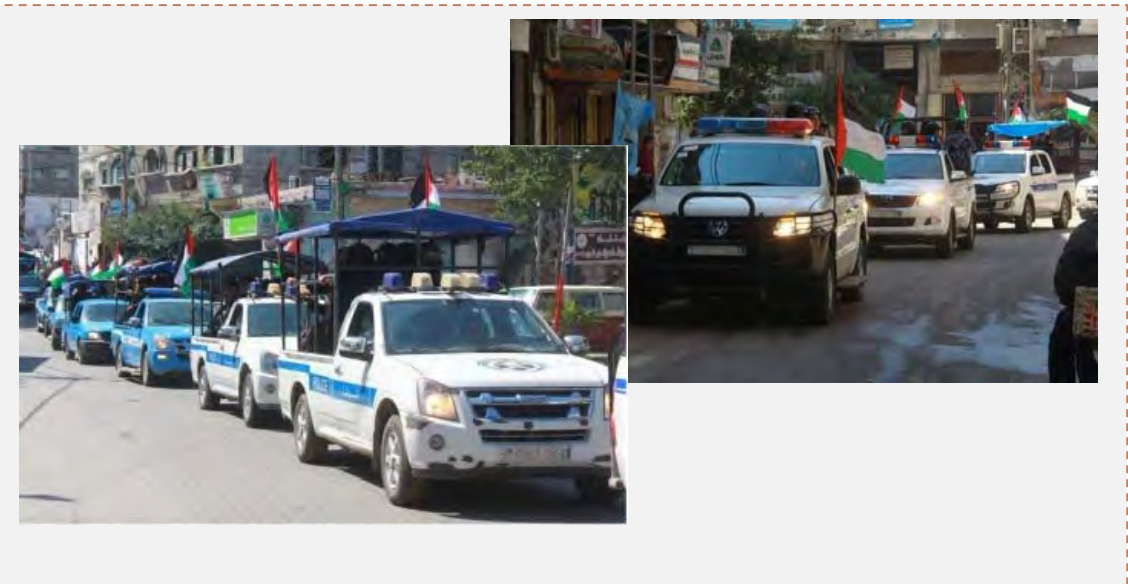
مسير عسكري للشرطة الفلسطينية شمال القطاع (موقع وزارة الداخلية، 15 آذار / مارس 2015)

■ أقامت الشرطة الفلسطينية في شمال قطاع غزة مسيرًا عسكريًا بمشاركة ضباط من الشرطة وأفراد قوة التدخل السريع والشرطة البحرية وغيرها. وقال مدير شرطة محافظة شمال القطاع علاء الدين الهندي خلال العرض إن الشرطة الفلسطينية تحمي السكان الفلسطينيين رغم كل الصعاب المحيطة بهم، وأكد أن أوضاع القطاع الأمنية مستقرة وأن الشرطة مسيطرة بجميع إداراتها على المناطق الخاضعة لها (موقع وزارة الداخلية، 15 آذار / مارس 2015).