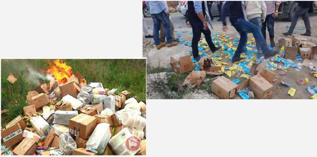
على اليمين: فلسطينيون في رام الله يتلفون محتويات شاحنة تابعة لشركة شتراوس الإسرائيلية (صفحة شبكة فلسطيني للحوار على الفيس بوك، 10 آذار / مارس 2015). على اليسار: حرق محتويات شاحنة شتراوس من قبل عناصر فتح في نابلس (معا، 11 آذار / مارس 2015)