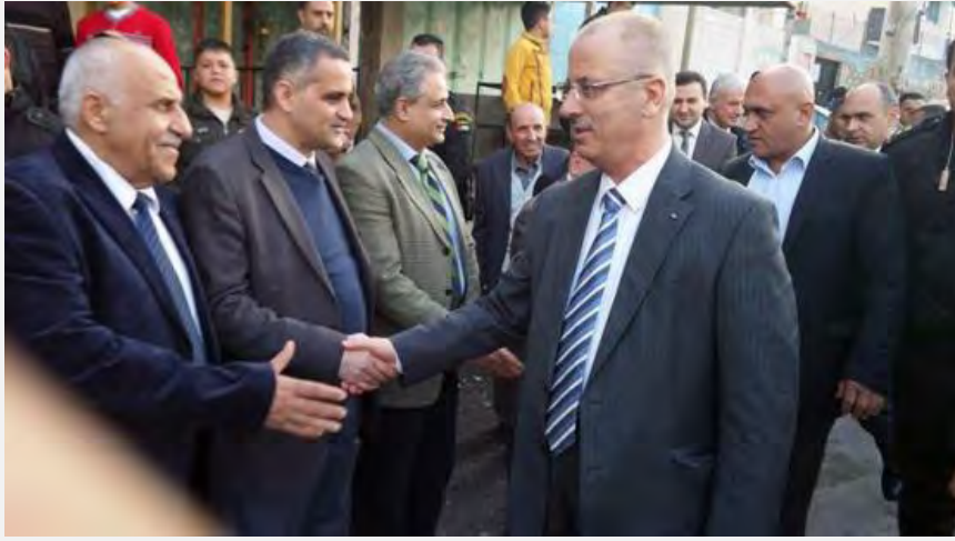
رامي حمد الله، رئيس حكومة الوفاق الوطني، لدى وصوله لزيارة مخيم بلاطة للاجئين بعد المواجهات التي اندلعت مؤخرا بين الأجهزة الأمنية وسكان المخيم (وفا، 13 آذار / مارس 2015)

■ استمرت خلال الأسبوع المنصرم المواجهات بين أجهزة السلطة الفلسطينية الأمنية وسكان مخيم بلاطة للاجئين (المجاور لنابلس)، حيث اندلعت في 14 آذار / مارس 2015 مواجهات جديدة (وللمرة الثالثة خلا يومين) حين أقدم العشرات من السكان على سد الشارع الموازي للمخيم وإشعال إطارات السيارات وإلقاء الحجارة على دورية تابعة للأجهزة الأمنية (بال تودي، 14 آذار / مارس 2015). وفي تعليقه على هذه الأحداث قال محافظ نابلس أكرم الرجوب إن هناك جهات تحرض المشاغبين، وهي عناصر راغبة في زعزعة أمن السكان والتأثير على الرأي العام وإخضاع الأجهزة الأمنية، لكي تلبي مطالبها (إذاعة صوت فلسطين، 15 آذار / مارس 2015).