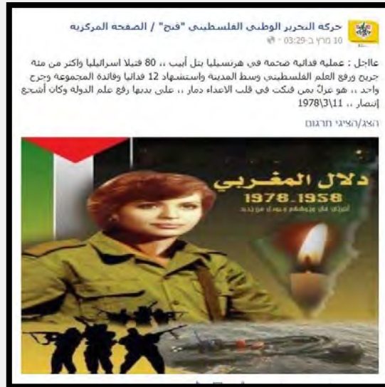
صفحة فتح الرسمية على الفيس بوك تخلد ذكرى الإرهابية دلال المغربي (10 آذار / مارس 2015)

■ قامت صفحة فتح الرسمية على الفيس بوك وبمناسبة ذكرى الاعتداء الإرهابي على الحافلة الإسرائيلية على الطريق الساحلي في إسرائيل في 11 آذار / مارس 1978، بنشر صورة الإرهابية دلال المغربي (التي أصبحت نموذجا يحتذى به في المجتمع الفلسطيني). وظهر بجانب الصورة نص يقدم الحادث على أنه حدث إخباري جديد: "عاجل عملية فدائية ضخمة في هرتسليا... 80 قتيلا وأكثر من مئة جريح ورفع العلم الفلسطيني وسط المدينة... وكان أشجع انتصار" (صفحة فتح على الفيس بوك، 10 آذار / مارس 2015).