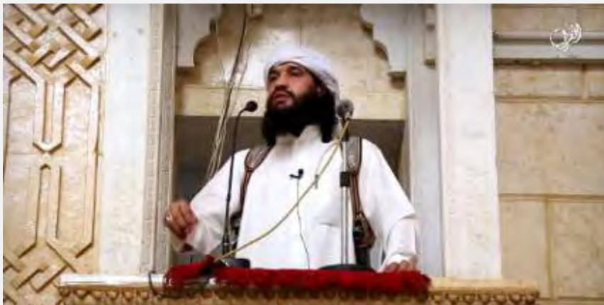
Un membre de la Province d'Hadramaout de l'Etat islamique au Yémen prononce un sermon saluant l'immigration vers les pays de l'islam et critiquant l'immigration vers les pays occidentaux (Blog akhbardawlatalislam.wordpress, 17 septembre 2015)

d. Une vidéo publiée par la Province d'Hadramaout de l'Etat islamique au Yémen , montre un membre de l'Etat islamique prononçant un sermon dans une mosquée, affirmant que les musulmans doivent émigrer des pays infidèles vers "Dar al-Salam" et non le contraire. Selon lui, ceux qui vivent dans les pays infidèles vivent en conformité avec leurs lois et s'exposent à des dérives (Blog akhbardawlatalislam.wordpress, 17 septembre 2015).