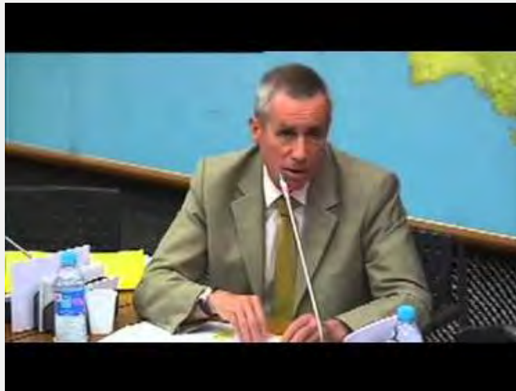
התובע הכללי של פריז, פרנסואה מולינס.

יתכן כי הדרכון מזויף. כמו כן נמצא דרכון מצרי סמוך לגופת מחבל שביצע פיגוע התאבדות בקרבת האצטדיון (Liberation, 14 בנובמבר 2015).