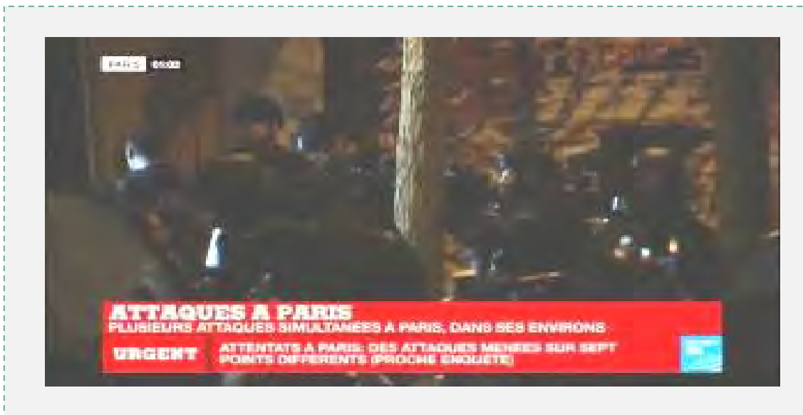
כוחות משטרה פרוסים ליד תיאטרון הבטקלאן

א. תיאטרון הבטקלאן (Bataclan): המוקד העיקרי של מתקפת הטרור. במקום פעלו שלושה מחבלים חמושים, שפרצו ב-2140 לאולם בו התקיימה הופעת רוק ופתחו באש על קהל המאזינים הרב. ב-0020 (זמן רב יחסית לאחר תחילת הפיגוע) פרץ למקום כוח משטרה. שני מחבלים פוצצו עצמם באמצעות חגורות נפץ ומחבל שלישי נורה ע"י כוח המשטרה. בתיאטרון הבטקלאן נהרגו 89 אנשים ומאות נפצעו (lemonde.fr, lefigaro.fr), 14 בנובמבר 2015).