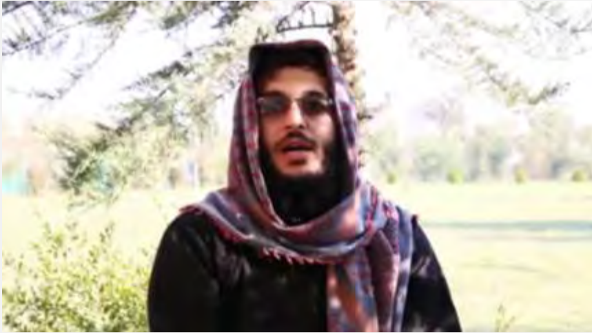
פעיל דאעש במחוז כרכוכ מברך על מתקפת הטרור בפאריס וקורא להתקפות נוספות (אח'באר אלמסלמין, 16 בנובמבר 2015).