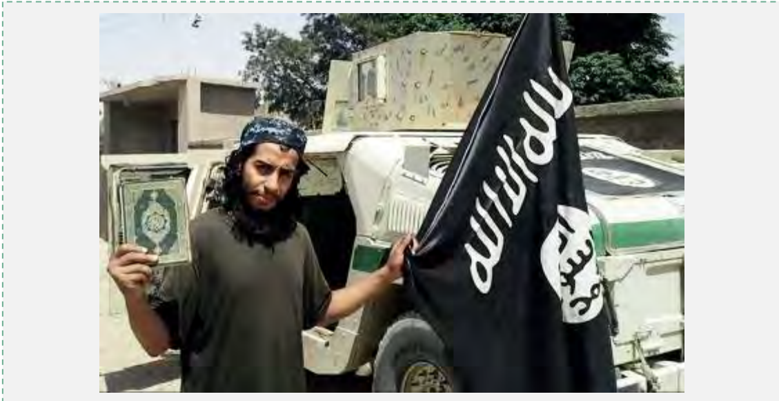
Abdelhamid Abaaoud en Syrie avec un drapeau de l'Etat islamique (Dabiq, n° 7, Février 2015)

9. En Février 2015, Dabiq, le magazine en langue anglaise de l'Etat islamique a publié une entrevue avec Abdelhamid Abaaoud. Son objectif était probablement d'encourager des activistes européens à rentrer dans leurs pays d'origine pour des missions terroristes. L'entrevue glorifiait la "fuite épique" d'Abdelhamid Abaaoud de Belgique, soulignant son succès à échapper aux forces de sécurité à sa poursuite. L'entrevue témoignait de la confiance en soi et de l'aplomb de l'Etat islamique, qui n'a pas hésité à publier des photos d'Abaaoud et à le renvoyer en Belgique et en France pour une nouvelle mission opérationnelle peu de temps après (probablement vers Mars 2015).