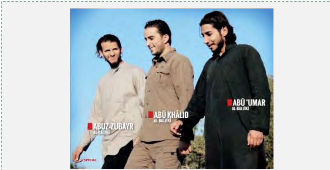
Abdelhamid Abaaoud, alias Abou Omar le Belge (à droite), avec deux autres terroristes envoyés par l'Etat islamique pour une mission terroriste en Belgique (Dabiq, numéro 7, Février 2015). Ils ont été tués dans un raid des forces de sécurité belges.