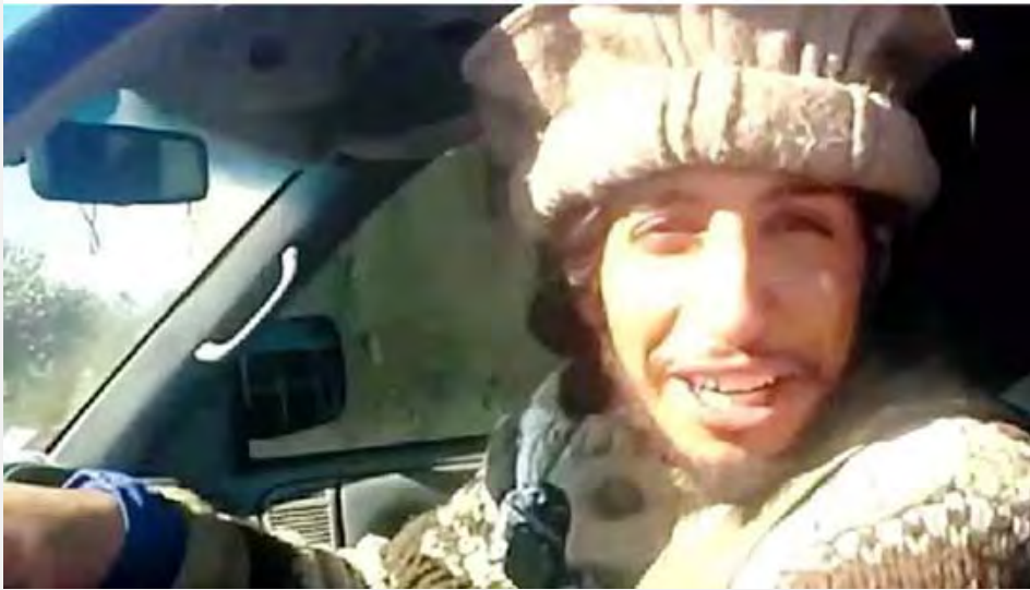
Image d'une vidéo publiée sur Twitter montrant Abdelhamid Abaaoud souriant au volant d'un camion trainant des corps de victimes de l'Etat islamique.

7. Au début de sa carrière dans les rangs de l'Etat islamique, Abdelhamid Abaaoud a réalisé des missions de combat et de logistique "de routine". Pendant son séjour en Syrie, il a été photographié souriant au volant d'une camionnette traînant les corps de personnes assassinées par l'Etat islamique (Daily Mail, 18 novembre 2015). Selon une organisation syrienne des droits de l'homme, alors qu'il se trouvait en Syrie, il a été nommé commandant de la région de Deir al-Zor (All4Syria, 14 août 2015). Il aurait également recruté des Belges pour le compte de l'Etat islamique et a été condamné par contumace à vingt ans de prison par la justice belge. 3