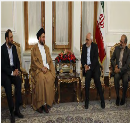
פגישת זריף – חכים בטהראן (אירן"א, 28 בדצמבר 2015).