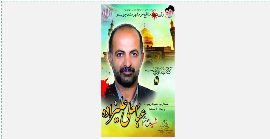
אל"מ עבאס-עלי עליזאדה (qasemsoleimani.ir, 24 בדצמבר 2015).

משמרות המהפכה ממשיכים להילחם בחזית המתקפה הקרקעית הנוכחית של צבא סוריה, שעדיין מדשדשת ללא הישגים דרמטיים.