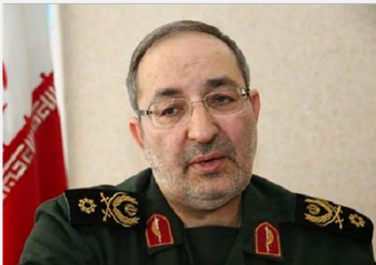
מסעוד ג'זאא'רי (דפאע פרס, 22 בדצמבר 2015).

■ חסין סלאמי (Hossein Salami), סגן מפקד משמרות המהפכה, הכחיש, אף הוא, כי איראן צמצמה את כוחותיה בסוריה. בריאיון עיתונאי אמר סלאמי, כי תגבור וצמצום כוחות בכל זירת לחימה הם עניין טבעי, אבל האסטרטגיה של איראן בסוריה לא השתנתה ומעורבותה בשדה הקרב ובזירה הפוליטית לא פחתה ונמשכת כבעבר בהתאם לצרכי הזירה. הוא ציין, כי מספר היועצים של משמרות המהפכה בסוריה עשוי לרדת באופן נקודתי, אך אין לכך שום קשר עם האסטרטגיה של איראן (פארס 22 בדצמבר 2015).