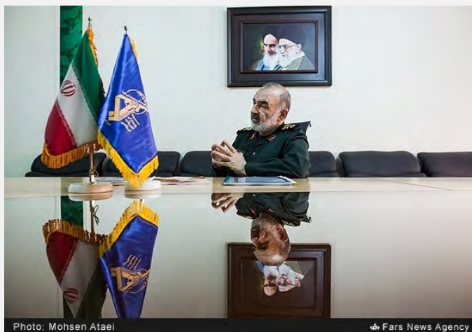
חסין סלאמי (פארס, 22 בדצמבר 2015).

■ חסין סלאמי (Hossein Salami), סגן מפקד משמרות המהפכה, הכחיש, אף הוא, כי איראן צמצמה את כוחותיה בסוריה. בריאיון עיתונאי אמר סלאמי, כי תגבור וצמצום כוחות בכל זירת לחימה הם עניין טבעי, אבל האסטרטגיה של איראן בסוריה לא השתנתה ומעורבותה בשדה הקרב ובזירה הפוליטית לא פחתה ונמשכת כבעבר בהתאם לצרכי הזירה. הוא ציין, כי מספר היועצים של משמרות המהפכה בסוריה עשוי לרדת באופן נקודתי, אך אין לכך שום קשר עם האסטרטגיה של איראן (פארס 22 בדצמבר 2015).