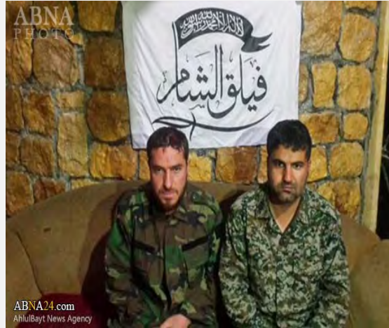
שני השבויים האיראנים שנשבו לטענת פילק אלשאם (אבנא ניוז, 21 בדצמבר 2015).

■ קבוצת המורדים האסלאמית הסורית, פילק אלשאם (Faylak al-Sham), טענה, כי לקחה בשבי שני לוחמים איראנים בדרום חלב. הקבוצה אף פרסמה תמונה בה נראים לכאורה שני השבויים. עוד נטען בהודעת הקבוצה, כי איראני נוסף נלקח לפני שלושה שבועות בשבי על-ידי ארגון ג'בהת אלנצרה, שלוחת אלקאעדה בסוריה (אבנא ניוז, 21 בדצמבר 2015).