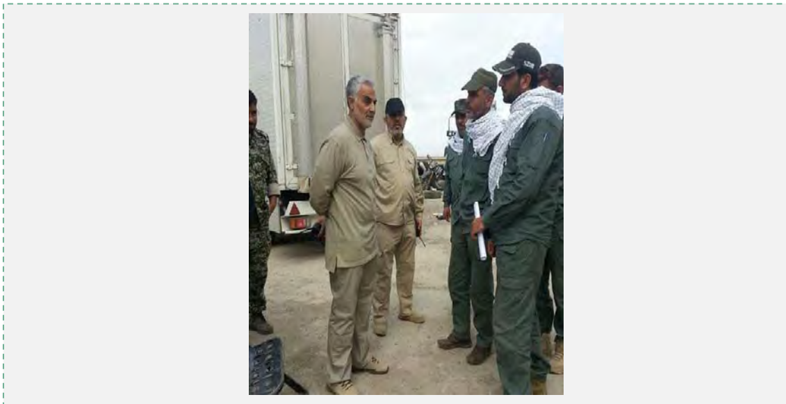
קאסם סלימאני במחוז אנבאר (אנתח'אב, 26 בדצמבר 2015).

■ נראה כי עיתוי פרסום התמונה אינו מקרי והוא נועד להבליט את מעורבות משמרות המהפכה והמיליציות העיראקיות השיעיות במערכה המוצלחת לשחרור העיר רמאדי מידי דאעש, שנוהלה למעשה בהובלת הכוחות המיוחדים של צבא עיראק בשיתוף פעולה ובתיאום עם כוחות הקואליציה המערבית נגד דאעש בעיראק.