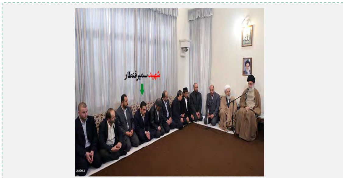
סמיר קנטאר בפגישה עם המנהיג העליון, עלי ח'אמנהאי, בפברואר 2009 (אלף, 20 בדצמבר 2015).

■ מחמוד עלוי (Mahmoud Alavi), שר המודיעין האיראני, שלח, אף הוא, איגרת ניחומים למזכ"ל חזבאללה, חסן נצראללה, בעקבות חיסול קנטאר (אירנ"א, 20 בדצמבר 2015). 212 חברי פרלמנט איראנים חתמו על מכתב למזכ"ל חזבאללה, חסן נצראללה, בו הביעו תנחומים בעקבות מות קנטאר וקראו לנקמה נגד "המשטר הציוני" (פארס, 20 בדצמבר 2015).