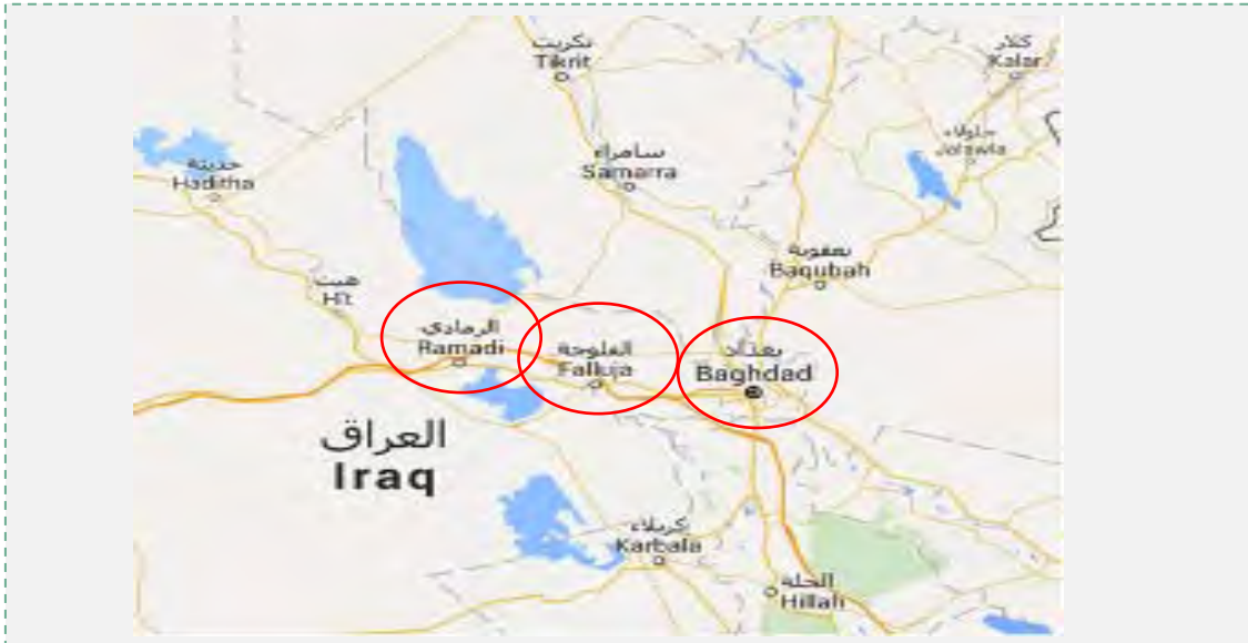
העיר אלפלוג'ה, שכיבוש אלרמאדי ניתק אותה מליבת שליטתו של דאעש.

השליטה של דאעש . בכירים בממשל העיראקי ובצבא עיראק כבר הצהירו שמאמצי צבא עיראק יתמקדו בשחרור אלפלוג'ה , לאחר ההשתלטות על אלרמאדי. כבר במקביל לכיבוש אלרמאדי הגביר צבא עיראק את הכיתור על העיר אלפלוג'ה, שהפכה לסמל לנוכחות של הג'האדיסטים בעיראק, כדי למנוע החשת תגבורות ממנה.