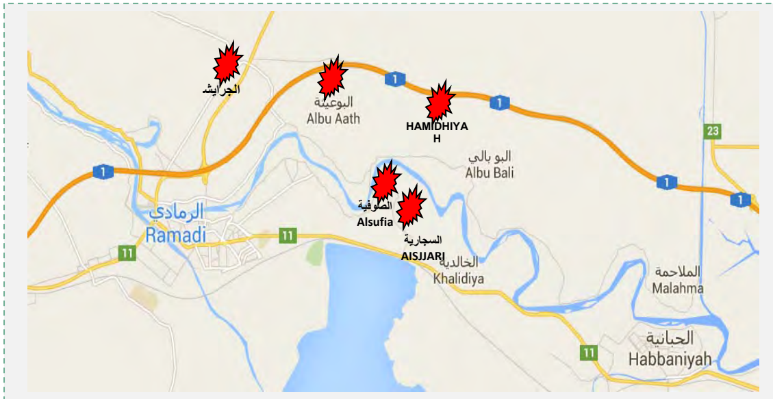
מוקדי לחימה בין צבא עיראק לדאעש בפרברים הצפוניים והמזרחיים של אלרמאדי, עדכני ל-3 בינואר 2016.

17. במקביל לכיבוש העיר רמאדי כיתר צבא עיראק את העיר אלפלוג'ה (הממוקמת כ-56 ק"מ מזרחית לרמאדי ונמצאת בשליטת דאעש מזה כשנתיים). זאת, כדי למנוע העברת סיוע לפעילי דאעש בעיר אלרמאדי ולהגביר את הלחץ על העיר אלפלוג'ה לקראת ההמשך. צבא עיראק דיווח, כי 44 פעילי דאעש נהרגו ו-12 בתים ממולכדים פוצצו דרומית לעיר אלפלוג'ה (שפק ניוז, 27 בדצמבר 2015). ב-27 בדצמבר 2015 דווח, כי כוחות הביטחון העיראקיים פרצו לאזור שכונות אלנעימיה בפאתיה הדרומיים של אלפלוג'ה והרגו כ-300 פעילים של דאעש (אלערביה, 27 בדצמבר 2015).