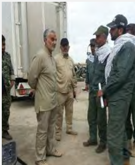
קאסם סלימאני במזרח מחוז אנבאר: פרסום הצילום במהלך הלחימה באלרמאדי אינו מקרי (אנתח'אב, 26 בדצמבר 2015).

18. אולם למרות הברכות הפומביות נראה, כי האיראנים אינם שבעי רצון מכך שכוחות שיעיים לא נטלו חלק משמעותי במערכה על אלרמאדי. על רקע זה פרסמו אתרי חדשות איראנים ורשתות חברתיות תמונה ובה נראה קאסם סלימאני, מפקד כוח קדס של משמרות המהפכה, במזרח מחוז אנבאר שבעיראק. מדובר בתמונה שאינה עדכנית, מכיוון שאחד ממפקדי המיליציות השיעיות, המופיע לצד סלימאני, נהרג בחודש יולי האחרון, אולם פרסומה במהלך הלחימה באלרמאדי נועד לאותת, כי גם לאיראן יש חלק בניצחון.