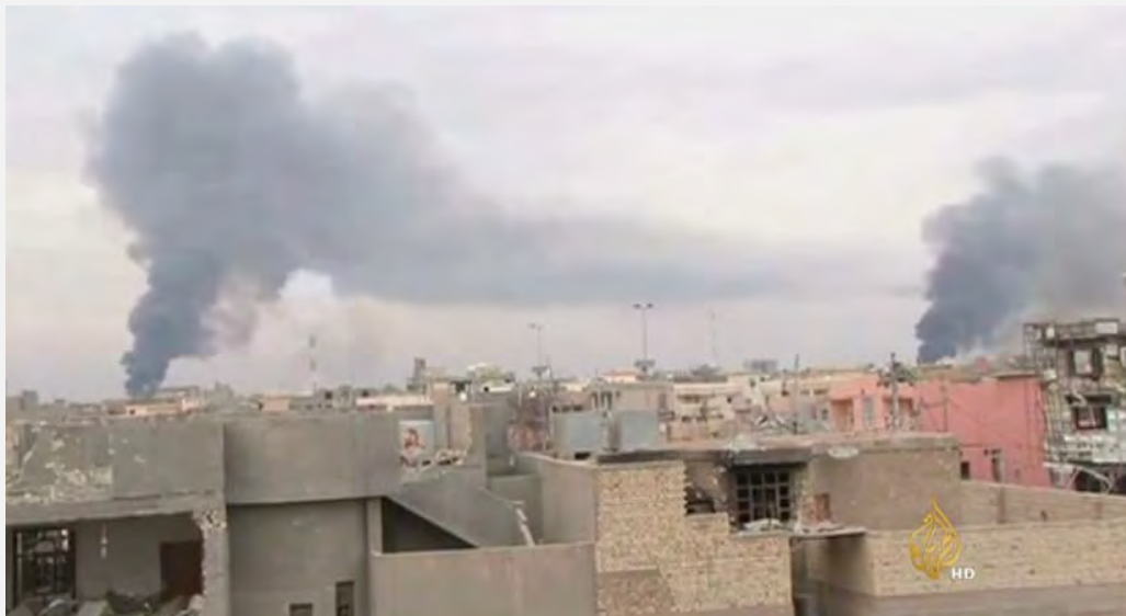
תקיפות אוויריות באלרמאדי (אלג'זירה, 26 בדצמבר 2015).

5. הקואליציה בהנהגת ארה"ב הגישה סיוע אווירי צמוד למערכה על אלרמאדי. מאז חודש יולי 2015 ביצעו כוחות הקואליציה מעל שש מאות גיחות תקיפה מהאוויר באזור אלרמאדי 150 מהן בשבוע שקדם להשתלטות על העיר (דיילי מייל, 30 בדצמבר 2015; thedailybeast.com, 30 בדצמבר 2015). לדברי צבא ארה"ב בוצעו במהלך 24 השעות המכריעות של הלחימה בעיר חמש תקיפות מהאוויר נגד שתי יחידות טקטיות של דאעש, עמדות לחימה של הארגון, עמדות פיקוד ושליטה, עמדות ירי ארטילרי, כלי רכב ועוד (אתר משרד ההגנה של ארה"ב 24 בדצמבר 2015).