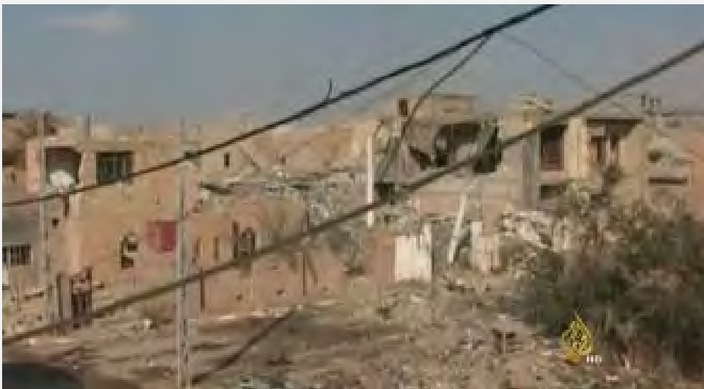
ממראות ההרס באלרמאדי (אלג'זירה, 26 בדצמבר 2015).

2. על העיר אלרמאדי הגנו כ-500-700 פעילי דאעש, שלחמו מול סד"כ של כ-10,000 חיילים עיראקים, כולל יחידת עילית של כוח הלוחמה בטרור (שהסתייעו בכ-5,000 אנשי מליציות סוניות). על פי התקשורת העיראקית והמערבית נהרגו במהלך הלחימה כ-250 פעילי דאעש (כולל מפקדים בכירים), כמה עשרות פעילים נמלטו מהעיר, וכמה מאות עדיין נאחזים בעיר ובפאתיה. לעיר עצמה נגרם הרס רב כתוצאה מהלחימה כמו גם מפיצוץ מבנים ע"י דאעש ומתקיפות מהאוויר של מטוסי ארה"ב ומדינות הקואליציה.