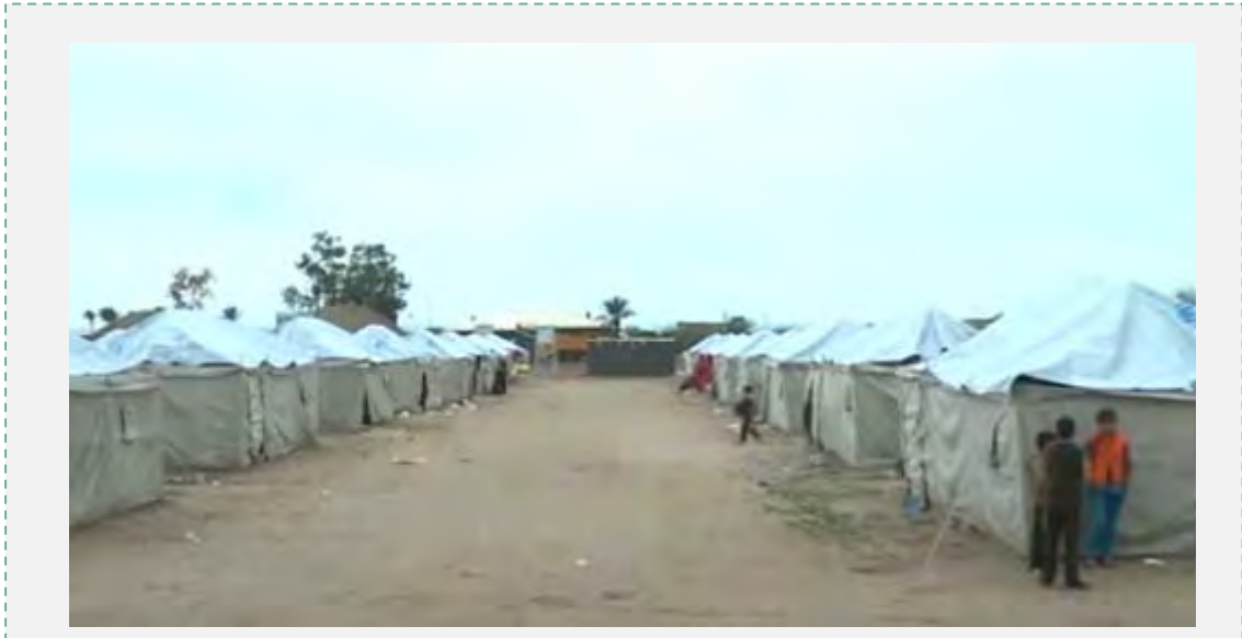
פליטים מאלרמאדי חיים באוהלים בפריפריה של העיר בגדאד (אלג'זירה, 1 בינואר 2015).

8. העיר אלרמאדי נכבשה ע"י דאעש מידי צבא עיראק ב-15 במאי 2015 במה שנראה בדיעבד כפסגת הישגיו הטריטוריאליים של הארגון בזירה העיראקית מאז כיבוש העיר מוצול (יוני 2014) 2 . בעקבות ההשתלטות על אלרמאדי במאי 2015 נדחק צבא עיראק ממרבית מחוז אלנבאר אולם נותרו בו כמה מובלעות בשליטתו, הנתונות ללוחמת גרילה מתמשכת של דאעש (ראו להלן).