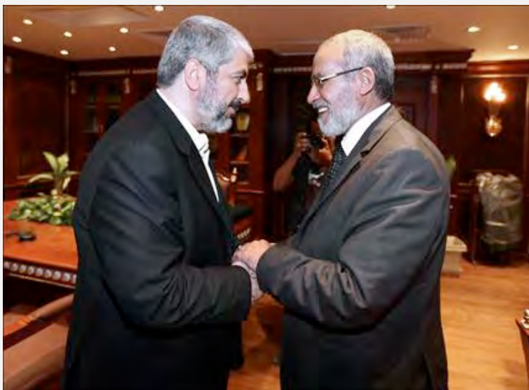
מחמד בדיע (מימין) וח'אלד משעל בפגישתם ב-10 באוגוסט 2011.

א. 13 באוקטובר 2011: משלחת בכירים מטעם חמאס, בראשות מנהיג חמאס ח'אלד משעל ובהשתתפות מוסא אבו מרזוק, אסאמה חמדאן ומחמד נצר, ביקרה בקהיר. מטרת הביקור הייתה לסכם את הפרטים האחרונים על "עסקת שליט", הביקור נוצל לפגישה של ח'אלד משעל עם מחמד בדיע, המדריך הכללי של תנועת האחים המוסלמים במצרים. מחמד בדיע בירך את חמאס על |עסקת שליט| ותאר אותה כניצחון ל"התנגדות" (Akhbarak.net) 4 . ב. 10 באוגוסט 2011: ח'אלד משעל הגיע לקהיר כדי לקיים דיונים עם שלטונות מצרים אודות יישוב המחלוקות בין פתח לחמאס ועל יחסי מצרים-חמאס. ביקורו בקהיר נוצל לפגישה עם מחמד בדיע, המדריך הכללי של האחים.