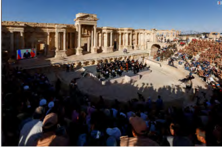
العرض الموسيقي في تدمر