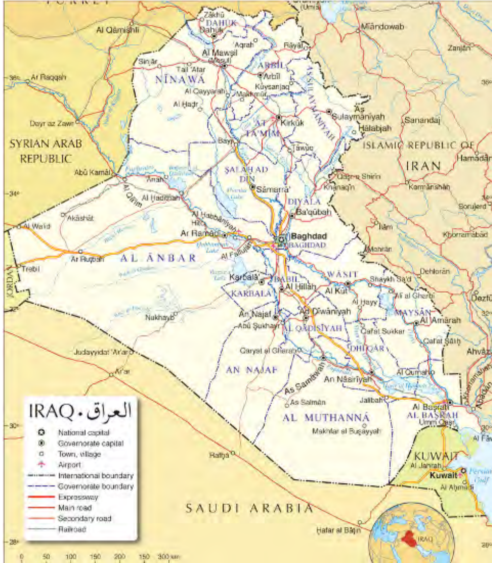
خارطة العراق.