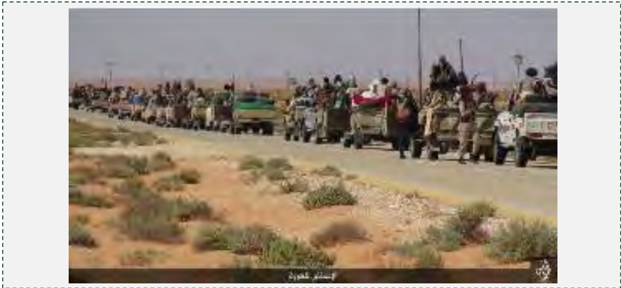
الاستعداد للانطلاق لمهاجمة بلدة أبو قرين (justpaste.it, 8 أيار/ مايو 2016).

■ رفع مقاتلو داعش أعلام التنظيم على المساجد والمؤسسات الحكومية في المناطق التي تم احتلالها وبدأ التنظيم بتشغيل شرطة الآداب في المناطق التي احتلها. كما أفادت التقارير بأن داعش قد شرع بحملة اعتقالات في أبو قرين وأنشأ منصة لتنفيذ أحكام الإعدام (حساب تويتر العرنساليبي, 5 أيار/ مايو 2016; حساب تويتر ادمالبرقاوى 17, 5 أيار/ مايو 2016; بورتال الوسط، 7-5 أيار/ مايو 2016; وكالة الأنباء التركية أناضوليا، 6 أيار/ مايو 2016).