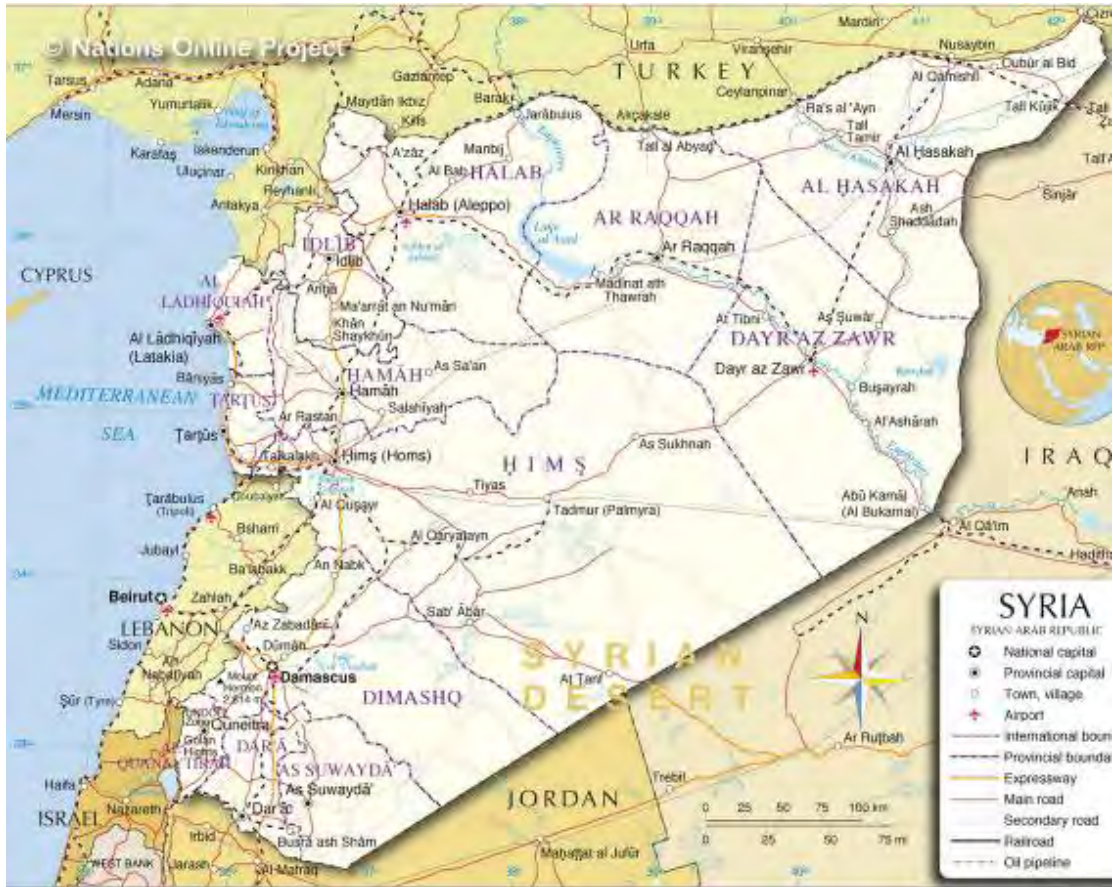
خارطة سوريا