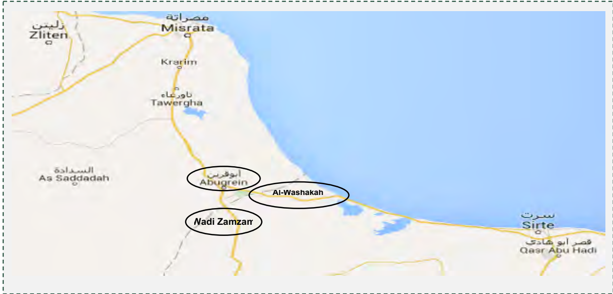
بلدة أبو قرين والقرى من حولها والتي احتلها مقاتلو داعش.

■ رفع مقاتلو داعش أعلام التنظيم على المساجد والمؤسسات الحكومية في المناطق التي تم احتلالها وبدأ التنظيم بتشغيل شرطة الآداب في المناطق التي احتلها. كما أفادت التقارير بأن داعش قد شرع بحملة اعتقالات في أبو قرين وأنشأ منصة لتنفيذ أحكام الإعدام (حساب تويتر العرنساليبي, 5 أيار/ مايو 2016; حساب تويتر ادمالبرقاوى 17, 5 أيار/ مايو 2016; بورتال الوسط، 7-5 أيار/ مايو 2016; وكالة الأنباء التركية أناضوليا، 6 أيار/ مايو 2016).