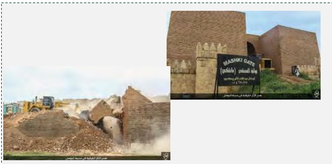
Справа: "Ворота Машки" до их разрушения организацией ИГИЛ. Слева: боевики организации ИГИЛ разрушают "Ворота Машки" с помощью бульдозера ("Ахбар дулат аль ислам", 16 мая 2016 г.)

■ Организация ИГИЛ опубликовала снимки, запечатлевшие разрушение памятника древней архитектуры под названием "Ворота Машки" в г. Мосул. Как говорится в сообщении организации, речь идет об объекте язычества, который был построен в Ассирийском периоде, в 7-м веке до н. э. ("Ахбар дулат аль ислам", 16 мая 2016 г.). "Ворота Машки" – одни из ворот древнего города Ниневия. Их разрушение стало продолжением систематического уничтожения археологических и исторических памятников, которое организация ИГИЛ ведет в Ираке и в Сирии.