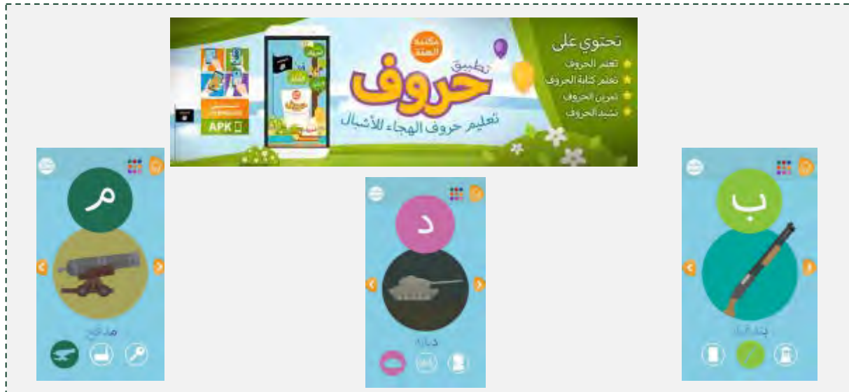
Аппликация "буквы", выпущенная организацией ИГИЛ. Справа: буква "б" в арабском алфавите, изображенная при помощи слова "винтовка". В центре: буква "д" в арабском алфавите, изображенная при помощи слова "танк". Слева: буква "м" в арабском алфавите, изображенная при помощи слова "пушка" (аккаунт Твиттер @appscaliphatef1 , 11 мая 2016 г.)