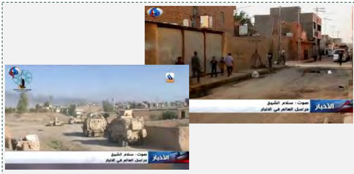
Г. Аль Ратба, после его освобождения из-под контроля организации ИГИЛ ("Аль Алам", 17 мая 2016 г.)