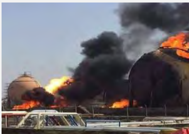
Горящие хранилища газа на заводе, расположенном в северной части Багдада (иракское агентство новостей IBN NEWS, 15 мая 2016 г.)