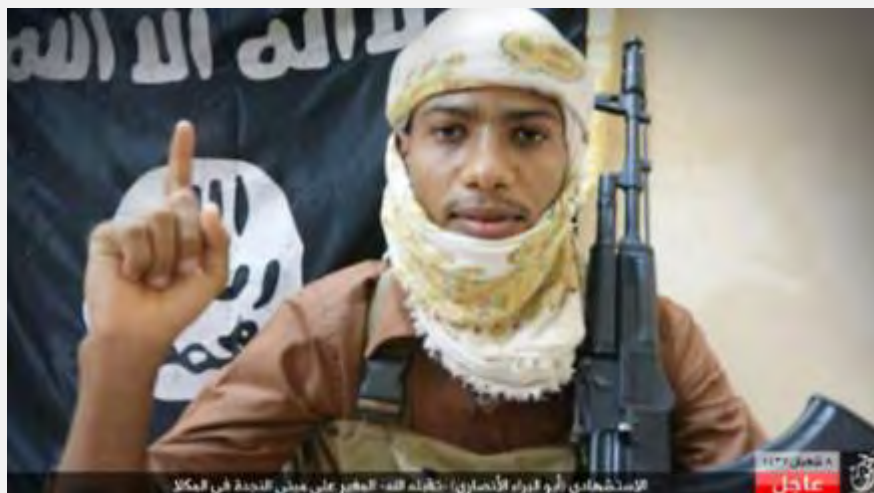
Террорист-смертник, совершивший теракт против йеменской армии в г. Аль Махла (аккаунт Твиттер Moheb23s@محبالربيش, 15 мая 2016 г.)

■ Боевики организации ИГИЛ совершили несколько терактов против сил йеменской армии в г. Хадрамут, расположенном в юго-восточной части страны. 15-го мая 2016 г. террорист-смертник взорвал пояс со взрывчаткой, надетый на его тело, у въезда на базу йеменской армии Аль Надежда, находящуюся в г. Аль Махла, столице провинции Хадрамут. Около 100 солдат было убито и ранено (газета Yemen Press, 15 мая 2016 г.). Округ Хадрамут организации ИГИЛ принял на себя ответственность за совершение этого теракта (аккаунт Твиттер Moheb23s@محبالربيش, 15 мая 2016 г.).