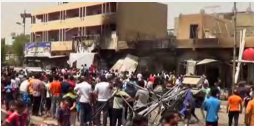
Место совершения теракта в шиитском квартале Мединат Аль Садар в Багдаде (телеканал "Аль Джазира", 11 мая 2016 г.)

■ В ходе волны террора в Багдаде особо выделялись взрывы двух заминированных автомобилей на многолюдных рынках, расположенных в центре шиитских кварталов: в квартале Мединат Аль Садар , расположенном в восточной части Багдада, в результате взрыва заминированного автомобиля, было убито 64 человека, а еще 74 человека получили ранения (агентство новостей AFP, 12 мая 2016 г.). Другой теракт с применением заминированного автомобиля был совершен (17 мая 2016 г.) в шиитском квартале Аль Шааб , расположенном в северной части Багдада. В результате этого теракта было убито около 40 человек, и не менее 140 человек получили ранения. Теракт в квартале Аль Шааб был наиболее серьезным в серии терактов, совершенных 17-го мая 2016 г.