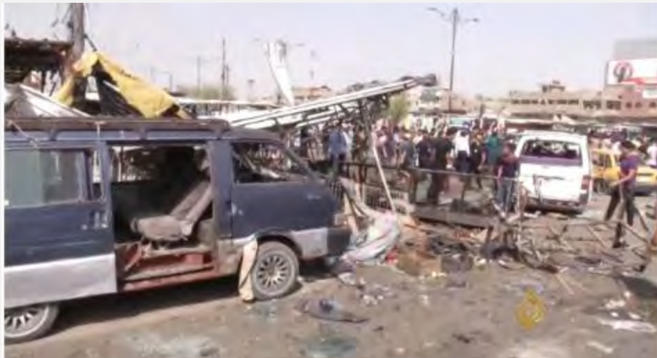
Место совершения теракта в шиитском квартале Аль Шааб (телеканал "Аль Джазира", 18 мая 2016 г.)

■ Далее будет приведен список (частичный) других терактов, совершенных организацией ИГИЛ в различных районах Багдада, до серии терактов 17-го мая 2016 г.: