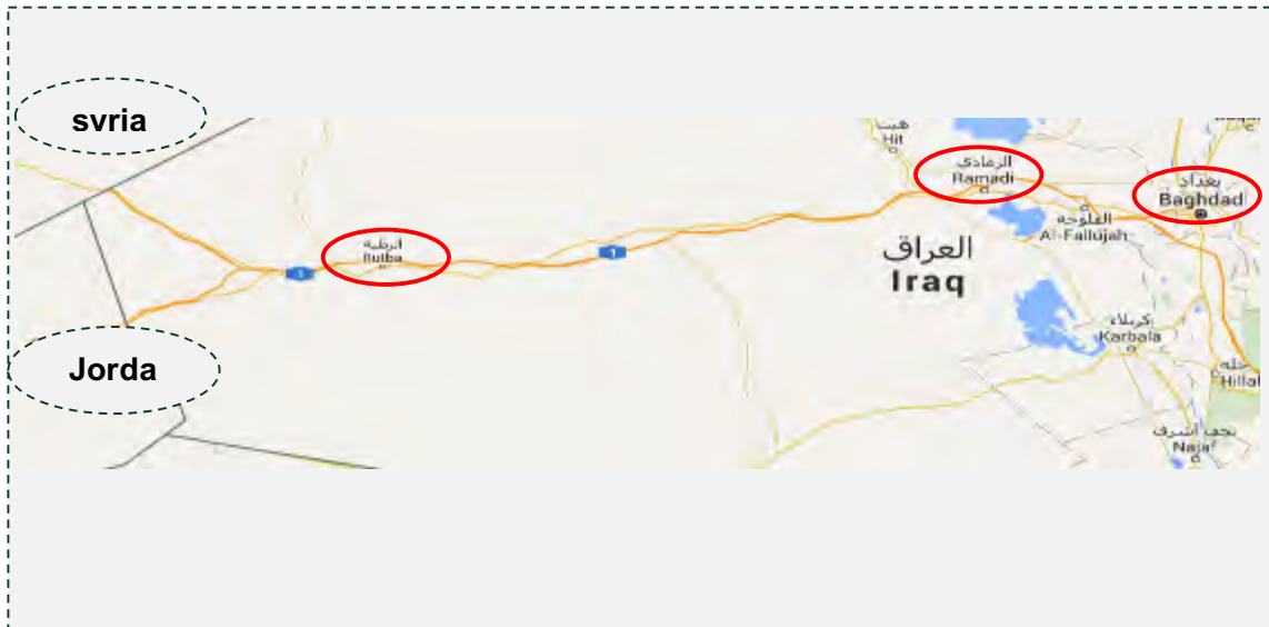
Г. Аль Ратба, расположенный неподалеку от треугольника границ (GOOGLE MAPS)