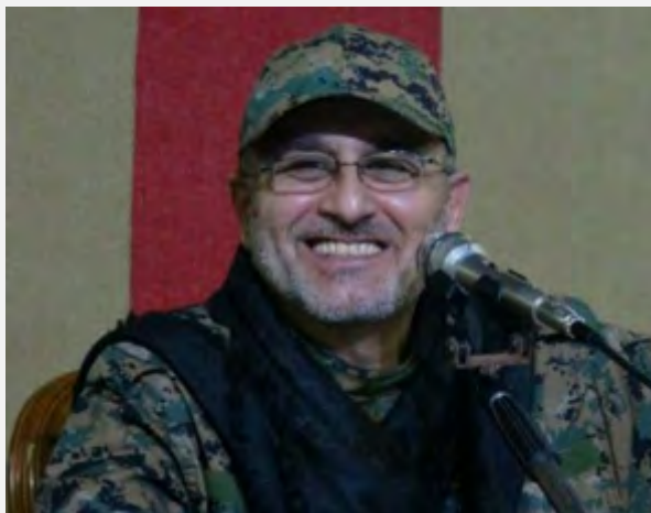
Мустафа Бадер Аль Дин (агентство новостей САНА, 13 мая 2016 г.)