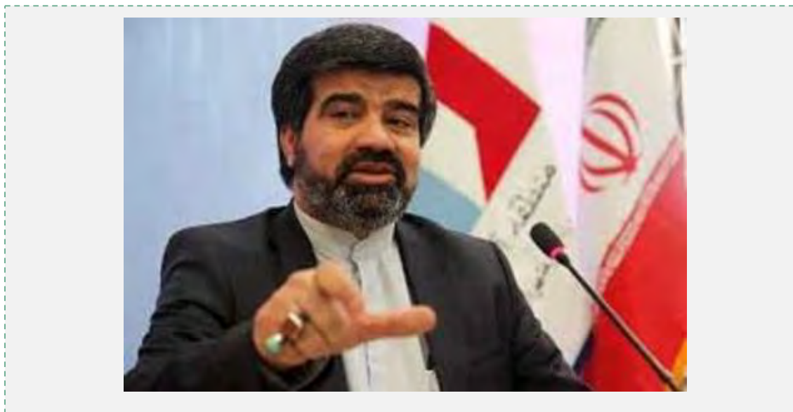
חמיד מח'תץ-אבאדי (אירנ"א, 30 באוגוסט 2016).

יודעים שהלוחמים האיראנים בסוריה ובעיראק ראויים למדליה בזכות מאבקם בטרור וההגנה על האנושות (אירנ"א, 30 באוגוסט 2016).