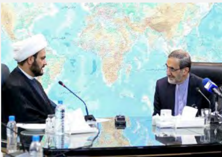
פגישת ולאיתי-אלכעבי (תסנים, 1 בספטמבר 2016).

■ עלי-אכבר ולאיתי (Ali-Akbar Velayati), יועץ המנהיג העליון לעניינים בינלאומיים, אמר בפגישה עם אלכעבי שהתקיימה ב-1 בספטמבר 2016, כי איראן מסייעת לממשלת עיראק בהתאם לבקשתה הרשמית שנענתה בחיוב על-ידי המנהיג העליון. הוא ציין, כי שיתוף הפעולה בין איראן לעיראק יכול להציל את האזור מידי ארצות-הברית ו"המשטר הציוני". ללא שיתוף פעולה בין איראן ועיראק, לא היה ניתן להציל את סוריה, וללא שיתוף פעולה בין איראן, עיראק וסוריה, לא היה ניתן להציל את לבנון, אמר ולאיתי. הוא ציין כי מדובר ב"שרשרת התנגדות", שאם אחת החוליות בה חסרה, כל השרשרת מתפרקת. ולאיתי הצביע על חשיבות השתתפות המיליציות השיעיות העיראקיות במערכה הצפויה לשחרור העיר מוצל ואמר, כי ערים, שהמיליציות נטלו חלק בשחרורן, כמעט שלא נהרסו. ערים, שהאמריקאים נטלו חלק בשחרורן, לעומת זאת, נחרבו לחלוטין (איסנ"א, 2 בספטמבר 2016).