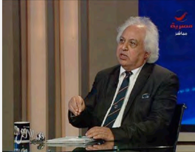
ד"ר סמיר ע'טאס, חבר פרלמנט מצרי, הנחשב מומחה לעניין הפלסטיני.

ב. האני עסל כותב באלאהראם, כי מסמך חמאס אינו כולל שינוי באסטרטגיה או אפילו בטקטיקה, זהו "איפור" לתנועה, שהחלה את דרכה כתנועת "התנגדות", והפכה לתנועה שממנה התנערו ידידיה ויריביה גם יחד. לדבריו למרות הביטויים המליציים הנזכרים במסמך יש לנהוג כלפיו בספקנות, דאגה וזהירות. זאת, לנוכח העובדה שהמסמך יצא מתוך בית מלון בדוחה ולא מעזה או ממדינה ערבית אחרת; ולנוכח העובדה שלא התקיים בתוך חמאס או בעזה שום שיח או דיון כלשהם לגבי המסמך לפני פרסומו. עוד ציין כי אם לא יתלוו אל המסמך מעשים, התחייבויות והחלטות קשות, שחלקן מחייב אומץ לב וויתורים, תראה בו מצרים לא יותר מ"נייר חסר ערך" (אלאהראם, 3 במאי 2017).