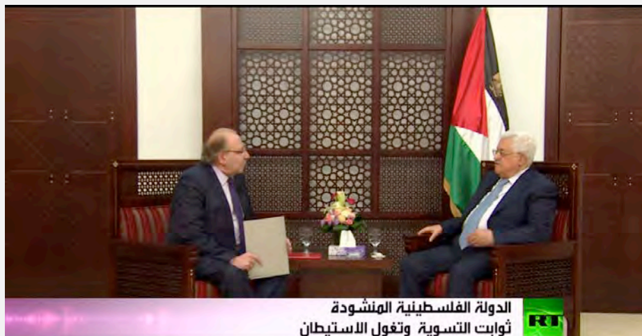
אבו מאזן מתראיין לערוץ RT בערבית בלשכתו במקאטה בראמאללה (יוטיוב, 8 במאי 2017)

7. אבו מאזן התייחס בקצרה למסמך המדיני. בראיון שהעניק לערוץ RT בערבית ציין אבו מאזן, כי קיימות במסמך סתירות רבות וכי הוא מעורפל. עוד ציין כי תוכן המסמך אינו רלוונטי לאור הפילוג שהוא מנציח. אבו מאזן ציין בדבריו, כי החלופה הצבאית לפיתרון הסכסוך הפלסטיני-ישראלי נעלמה ופתרון השלום הינו הדרך היחידה לסימו (ערוץ RT, 8 במאי 2017).