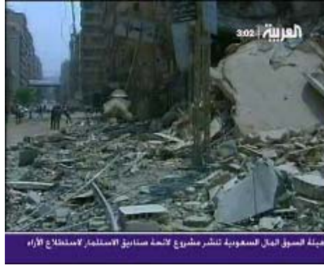
מבנה בפרבר הדרומי של ביירות לאחר שהותקף ע"י מטוסי חיל האוויר (טלוויזיה "אלערביה", 27 ביולי)

9. במקביל לתקיפות האוויריות ביצע צה"ל פעילות קרקעית מוגבלת בשטח לבנון, באזורים הסמוכים לגבול, במטרה להרוס מאחזים שנבנו ע"י ה"חזבאללה" מאז יציאת צה"ל מלבנון (מאי 2000). פעילות זאת שהתבצעה ע"י כוחות שריון, חי"ר והנדסה התמקדה החל מה- 20 ביולי בכפר מארון אלראס ובעיירה בנת ג'ביל, מעוזה של ה"חזבאללה" בדרום. לאחר מספר ימי לחימה קשים ואבידות בנפש הצליח צה"ל להשתלט על מאחזי ה"חזבאללה" בשני יישובים אלו.