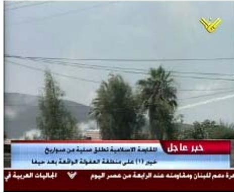
שיגור רקטה ארוכת טווח לעבר עפולה (טלוויזית "אלמנאר", 28 ביולי)