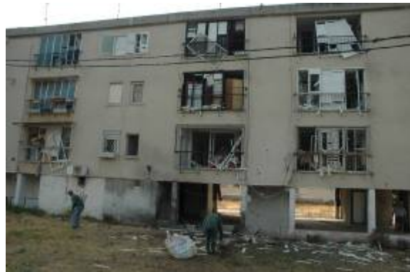
הרס שגרמו הרקטות לבתים בנהריה (מימין) ובכרמיאל (משמאל)