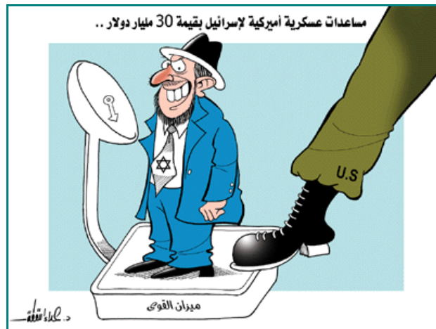
הסיוע האמריקאי לישראל: תחת הכותרת "הסיוע האמריקאי לישראל הנאמד ב-30 מיליארד דולר". רגל אמריקאית דורכת על משקל עליו עומד יהודי המאויר בצורה סטריאוטיפית ובעל מבט מרושע. על המשקל נכתב "מאזן הכוחות" [בין ישראל למדינות ערב] (ספטמבר 2007, "פאלטודיי")