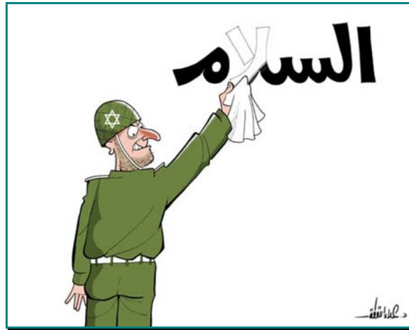
9 בספטמבר 2007, עיתון "פלסטין": חייל ישראלי המאויר כיהודי סטריאוטיפי ובעל מבט אכזרי מוחק את המילה "השלום" ["אלסלאם"].