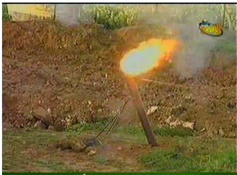
ירי פצצת מרגמה. ניתן לראות כי הירי בוצע מרחוק ע"י שימוש בחוט משיכה (ערוץ אלאקצא, 12 בפברואר)

■ בשבוע החולף המשיכו ארגוני הטרור בירי הרקטות לעבר יישובי הנגב המערבי. סה"כ אותרו בשטח ישראל 45 נפילות רקטות לעומת 66 רקטות בשבוע שקדם לו. את מרבית נטילות האחריות לירי הרקטות היו של הג'האד האסלאמי בפלסטין וועדות ההתנגדות העממית. בנטילות האחריות לירי רקטות ב- 15 וב- 16 בפברואר טענו ארגוני הטרור כי הירי בוצע בתגובה למותו של בכיר בג'האד האסלאמי בפלסטין שיוחס על ידם לישראל (ראו להלן). כמו כן, נורו לעבר כוחות צה"ל ויישובי עוטף עזה בשבוע החולף כ- 40 פצצות מרגמה .