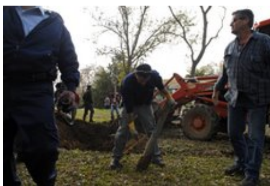
פגיעה של רקטה במרכז קיבוץ ניר עם (שליד שדרות). הפגיעה גרמה למספר נפגעי חרדה (18 בפברואר)