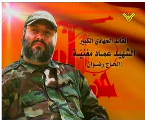
עמאד מע'ניה (ערוף אלמנאר, 14 בפברואר)

■ ב-12 בפברואר בסביבות 22:00 התפוצצה מכונית בשכונת המגורים סוסה בדמשק שבסוריה. כתוצאה מהפיצוץ נהרגו בכיר חזבאללה ומאבטחו. למחרת בבוקר פרסם חזבאללה הודעה רשמית המכריזה על מותו של עמאד מע'ניה והמאשימה את ישראל באחריות למותו (אלמנאר, 13 בפברואר). בהודעה רשמית מטעם יועץ התקשורת של ראש ממשלת ישראל (13 בפברואר) נאמר כי ישראל מבררת את הדיווחים מלבנון ומסוריה באשר למותו של בכיר בחזבאללה והיא לומדת לראשונה את הפרטים העולים מהם כפי שאלה נמסרו בתקשורת. ההודעה קובעת כי, "ישראל דוחה את הניסיונות של גורמי הטרור לייחס לה מעורבות כלשהי באירוע זה" .