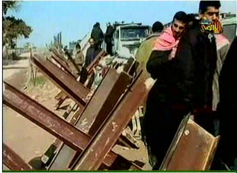
מעבר המעוכבים בשער צלאח אלדין (ערץ אלאקצא, 18 בפברואר)