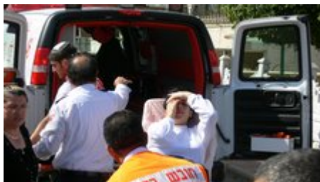
רקטה שנחתה בחצר בית בשדרות ב-17 בפברואר וגרמה ל-5 נפגעי הלם ונזק למבנה (מרכז תקשורת שדרות, 17 בפברואר)