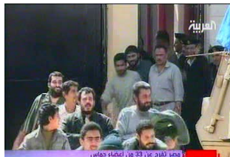
מצרים משחררת אסירים המשתייכים לחמא"ס ממצרים לרצועת עזה (ערוץ אלערביה, 23 במרץ)