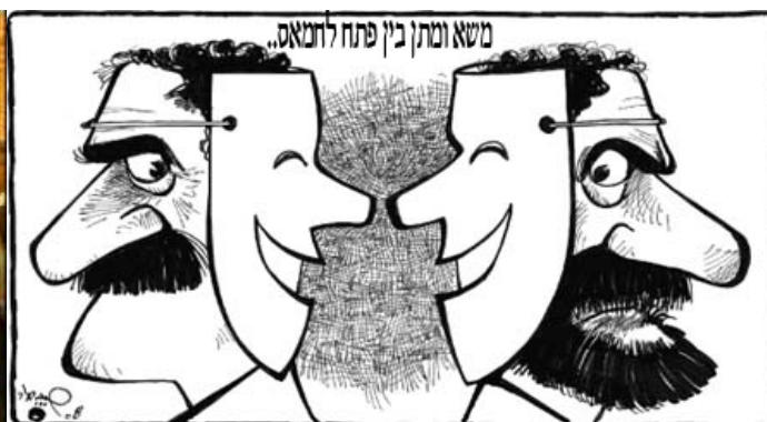
קריקטורה המתארת את המשא ומתן הדו-פרצופי בין חמא"ס לפת"ח (אלחיאת, 24 במרץ)