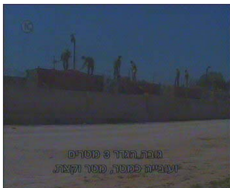
גופת הגדר 3 מטרים ועובייה כמטר, מטר וקצת.

■ בינתיים, החלה מצרים לבנות מחדש את גדר הגבול עם הרצועה שנפרצה ע"י חמא"ס.