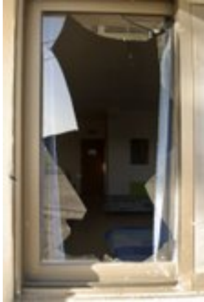
חלון בית שנפגע מנפילת רקטה בקיבוץ ניר עם ב- 20 במרץ (צילום: אלכס זגר, www.sderotmedia.co.il , 20 במרץ)

■ בשבוע האחרון ירד היקף ירי הרקטות לעבר ישראל, לעומת השבועות האחרונים. בשבוע האחרון אותרו 12 נפילות בשטח ישראל, לעומת 34 בשבוע שקדם לו. כמו כן, נמשך ירי פצצות המרגמה לעבר כוחות צה"ל הפועלים בסמוך לגדר הביטחון ולעבר ישובים ישראלים הסמוכים לרצועת עזה. סה"כ נורו 17 פצצות מרגמה בשבוע החולף, לעומת 15 בשבוע שקדם לו.