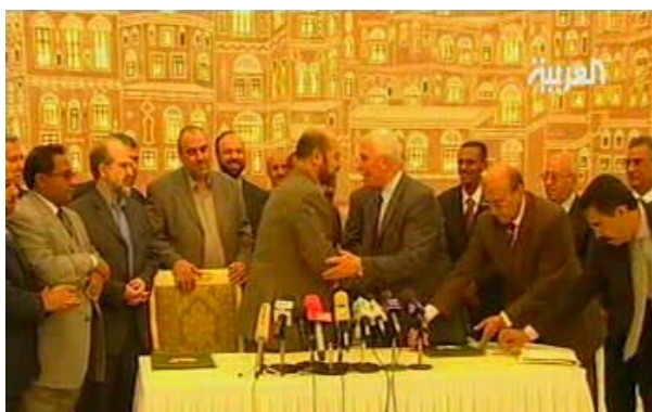
טקס חתימה על "הצהרת צנעאא" בין חמא"ס לפת"ח. בין הצדדים קיימת מחלוקת עמוקה באשר למשמעותה (ערוץ אלערביה, 23 במרץ)