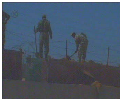
חיילים מצריים בונים מחדש את גדר הגבול באזור מעבר רפיח (באדיבות ערוץ 10, 19 במרץ)