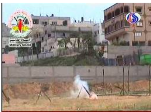
ירי רקטות של הג'האד האסלאמי בפלסטין סמוך לשכונת מגורים (ערוץ אלעאלם, 20 באפריל)

■ במהלך השבוע החולף חלה עלייה חדה במספר הרקטות ופצצות המרגמה שנורו לעבר יישובי הנגב המערבי וכוחות הביטחון. סה"כ נורו במהלך השבוע 71 רקטות לעומת 9 רקטות בשבוע הקודם. יצוינו מטחי רקטות ופצצות מרגמה שנורו במהלך ולאחר ביצוע הפיגועים סמוך לקיבוץ בארי ובמעבר כרם שלום. רוב ירי הרקטות מוקד לעבר העיר שדרות. אחת הרקטות שפגעה סמוך למכונת בקיבוץ גבים (21 באפריל) פצעה ילד בן ארבע באורח בינוני. הפלסטינים ירו גם לעבר חקלאים שעסקו בקטיפי תפוחי אדמה בשדות קיבוץ ניר עוז.