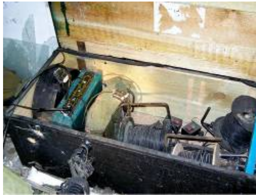
אמצעי לחימה שנמצאו במהלך פעילות צה"ל בתוך מסגד בפאתי סג'אעיה (דובר צה"ל, 16 באפריל)

■ בבוקר 16 באפריל זיהה כוח צה"ל, שעסק בפעילות יזומה סמוך לקיבוץ בארי (כ-4 ק"מ דרומית מערבית למעבר קרני), שני פלסטינים חמושים שניסו להניח מטענים סמוך לגדר המערכת. הכוח אשר ניסה לסכל את פעילותם של השניים נכנס לשטח הרצועה ונתקל במארב של חולייה שמנתה שישה מחבלים. המחבלים, שחלקם הסתתרו בשטח שולט, ירו לעבר כוח צה"ל תוך ניצול הערפל ששרר באזור. בחילופי האש נהרגו שלושה חיילי צה"ל ושלושה נוספים נפצעו. המחבלים הצליחו ככל הנראה להימלט לתוך הרצועה. תנועת חמא"ס נטלה אחריות על התקרית (אתר אלקסאם, 16 באפריל) 1 .