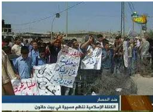
תהלוכה נגד המצור בבית חאנון (ערוץ אלאקצא, 21 באפריל)

■ חמא"ס מוסיפה ליזום מהלכי "מחאה עממית" במסגרת הקמפיין שהיא מנהלת סביב נושא המעברים. בכירי התנועה שבו ואיימו כי אם לא ייפרץ המצור יתרחש "פיצוץ עממי". בהפגנה שנערכה מול מעבר רפיח (15 באפריל) קרא דובר חמא"ס אימן טה לפעול באופן מידי לשיפור המצב ואיים כי על ישראל לצפות ל"פיצוצים נוספים" (סוכנות מען, 18 באפריל). סמוך למעבר ארז נקבצו, על פי קריאת חמא"ס, עשרות נשים וילדים להפגנה בה הונפו כרזות המגנות את "המצור הישראלי" והדורשות לפתוח את המעברים (סוכנות מען, 19 באפריל).