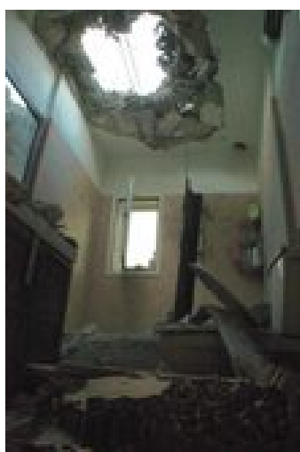
פגיעה ישירה בבית בשדרות ב- 29 באפריל