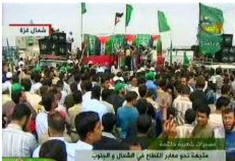
הפגנה שארגנה חמא"ס בצפון הרצועה בקריאה להסיר את המצור (ערץ אלאקצא, 25 באפריל)

■ לא ברור לנו האם סרוב של חברות הדלק מתואם עם ממשלת חמא"ס. אין ספק כי יש ביכולת חמא"ס, לו רצתה בכך, לחייב את בעלי החברות לקבל את הדלקים ממסוף נחל עוז, ולהסדיר את חלוקתם לאזרחים. בישיבת ממשלת חמא"ס (27 באפריל) הוחלט לקיים התייעצויות דחופות עם חברות הדלק על מנת להכניס את הדלק הנמצא במעבר נחל עוז ולהפיץ אותו (Palestine-info, 28 באפריל). אולם התאחדות חברות הדלק ברצועה דחתה את פניית ממשלת חמא"ס (רויטרס, 28 באפריל).