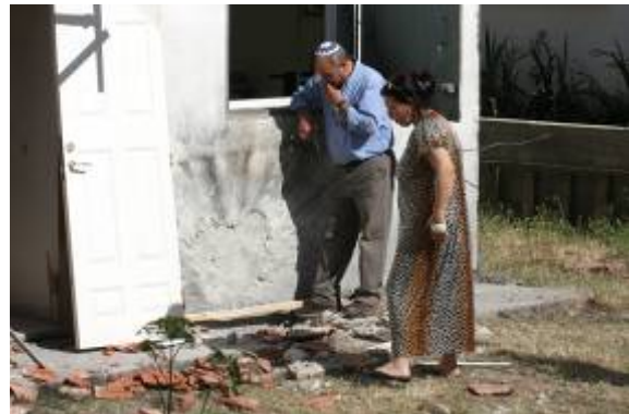
פגיעה ישירה של רקטה בבית בשדרות ב- 27 באפריל (27 באפריל)