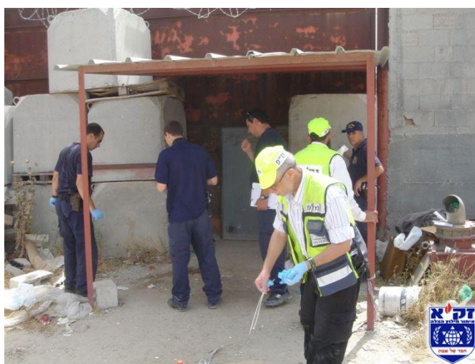
זירת הפיגוע באזור התעשייה ניצני שלום סמוך לטול כרם (באדיבות זק"א, 25 באפריל)