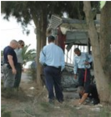
פגיעה במבנה בקיבוץ גבים ב- 29 באפריל

■ בשבוע החולף נמשך ירי הרקטות לעבר ישראל בהיקף גבוה יחסית, סה"כ אותרו בשטח ישראל 34 נפילות רקטות. כמו כן, נורו 42 פצצות מרגמה. בלטה בהשתתפותה בירי רקטות חמא"ס , אשר נטלה אחריות לירי 3 רקטות לעבר שדרות ב- 28 באפריל, מהן נפגע בית בעיר. כמו כן נטלה חמא"ס אחריות לירי פצצות מרגמה לעבר כוחות צה"ל הסמוכים לגדר הביטחון.