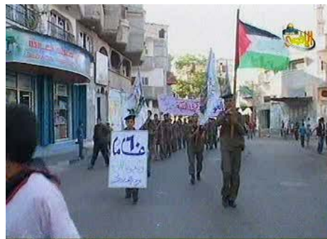
הפגנה של ילדים בעזה לציון "יום הנכבה" (ערוץ אלאקצא, 10 במאי)