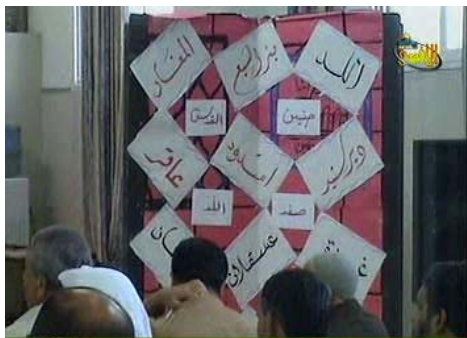
הטמעת מסר "זכות השיבה": תצוגה בעצרת של חמא"ס בעזה לציון "יום הנכבה", בה מופיעים שמות ערים בישראל (ערוץ אלאקצא, 10 במאי)