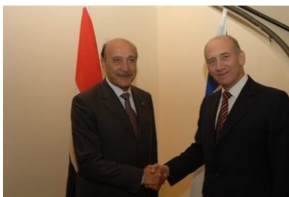
ראש הממשלה אהוד אולמרט וראש המודיעין המצרי עמר סלימאן בפגישתם בירושלים (לע"מ, 12 במאי. צילום: עמוס בן גרשום)