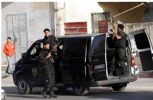
פעילי מנגנוני הביטחון הפלסטיניים בפעילות בעיירה קבטיה שליד ג'נין (פורום PALDF, 6 במאי)

■ כ- 500 פעילי מנגנוני הביטחון הפלסטיניים, שנכנסו לאחרונה לאזור ג'נין, החלו בפעילות להשלטת חוק וסדר ועקירת תופעות האנרכיה בצפון השומרון (במסגרת מבצע המכונה "החיוך והתקווה").