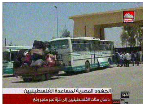
מעבר פלסטינים מרצועת עזה למצרים דרך מעבר רפיח (הטלוויזיה המצרית, 12 במאי)