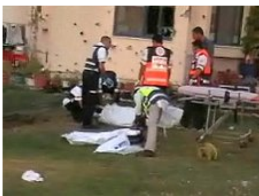
פינוי ג'ימי קדושים שנהרג מפגיעת פצצת מרגמה בכפר עזה (צילום: זאב טרכטמן, 9 במאי)