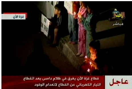
ילדים בעזה אוחזים בנרות לשם העברת מסר החשכת הרצועה (ערוץ אלאקצא, 11 במאי)

■ תחנת הכוח ברצועה מספקת 26% מהחשמל ברצועה. 7% נוספים מספקת מצרים, והשאר מספקת ישראל. יצוין כי אספקת החשמל הישראלית נמשכת , וכי צמצום החשמל ע"י ישראל, כפי שאושר ע"י בג"ץ בינואר 2008, נעשה בהיקף קטן. לפיכך, אין בהפסקת תחנת הכוח כדי להביא להפסקה מוחלטת של אספקת החשמל וע"י ויסות החשמל ניתן למנוע פגיעה במוקדים חיוניים ברצועת עזה.