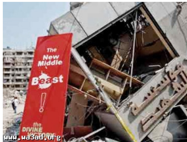
שרידי בניין מוסד החלל לאחר שהותקף ע"י חיל האוויר הישראלי במהלך מלחמת לבנון השנייה 6

13. "מוסד החלל" הוצא אל מחוץ לחוק בישראל בשל שייכותו ותמיכתו בחזבאללה. בשנת 2007 הכריז משרד האוצר האמריקאי על "קרן השהיד" באיראן ועל סניפיה בלבנון ובארה"ב (שם נקראת הקרן GOODWILL CHARITABLE ORGANIZATION) כעל גופים בלתי חוקיים בשל תמיכתם בחזבאללה ובשל היותם חלק ממקורות מימון עבור פעילות הארגון.