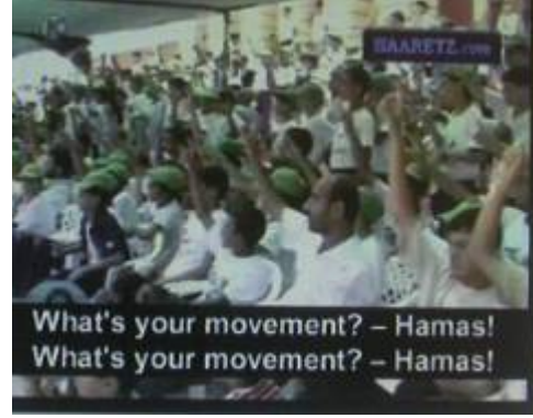
הילדים נשאלים "מי התנועה שלכם?" ועונים: "חמאס".