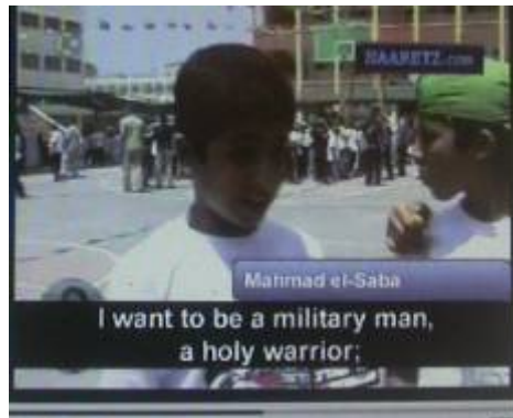
ילד המשתתף במחנות הקיץ של חמאס עונה לשאלה "מה אתה רוצה להיות שתגדל?": "אני רוצה להיות איש צבא, לוחם ג'האד, כדי לשחרר את האדמה הזו, שכך אדמה זו שלנו ולא של אחרים".