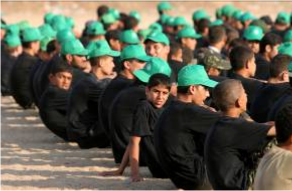
נערים במחנה קיץ של חמא"ס ברצועת עזה. הנערים חובשים כובעים ירוקים של חמא"ס.