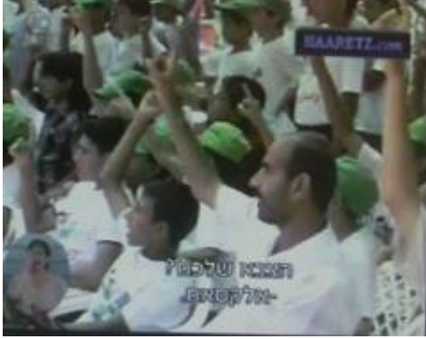
הילדים נשאלים "מי הצבא שלכם?" ועונים: "[גדודי עז אלדין] אלקסאם 5 [הזרוע הצבאית- הטרוריסטית של החמאס].