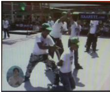
ילדים חבושים בכובעי חמא"ס מתרגלים השתלטות על אדם באמצעות אקדח.