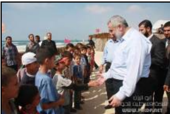
ראש ממשל חמא"ס אסמאעיל הניה מבקר במחנה קיץ בח'אן יונס.