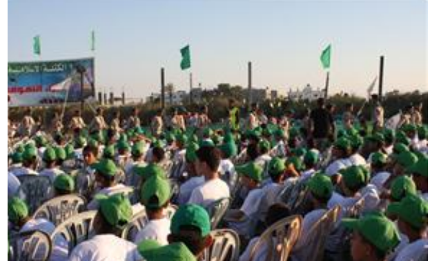
מחנה קיץ של חמא"ס בשכונה שג'אעיה שבעזה, המתקיים תחת הכותרת: "עומדים איתן למרות המצור".