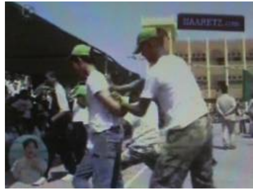
תרגול מעצר ע"י ילדים המשתתפים במחנה קיץ של החמא"ס.