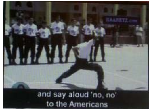
ילדים במחנה קיץ של החמא"ס בעזה מתרגלים תוך השמעת קריאות גנאי נגד ישראל וארצות-הברית.