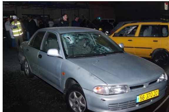
נפילת רקטה במרכז המסחרי בשדרות (, 18 בדצמבר)