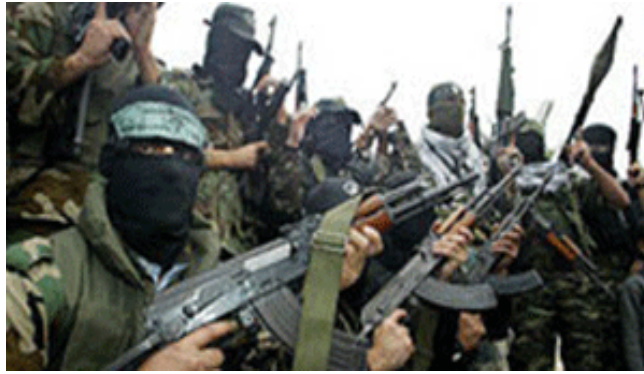
כוננות לקראת הסלמה (אתר גדודי עז אלדין אלקסאם, 18 בדצמבר 2008).