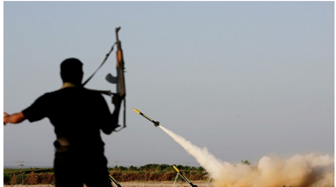
ירי רקטה לעבר שדרות (פאלטודיי, 18 בדצמבר 2008)