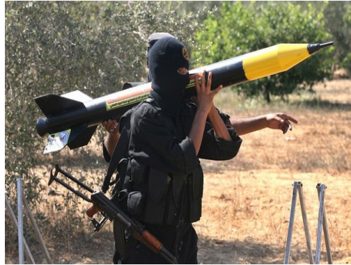
הכנות לקראת ירי רקטה (פאלטודיי, 18 בדצמבר 2008)

4. ההסלמה בשטח מהווה המשך לרצף אירועי ירי שהחל מ-4 בנובמבר (סיכול פיגוע המנהרה) והביא לשחיקת משמעותית של הסדר ה"הרגעה". בחדש וחצי האחרונים נורו לעבר ישראל (נכון ל-18 בדצמבר לפנות בוקר) 213 רקטות ו-126 פצצות מרגמה. (סה"כ 339 רקטות ופצצות מרגמה) מעבר ארגוני הטרור למדיניות של ירי רצוף לעבר ישראל (שלווה בניסיונות לבצע פיגועי טרור במתווים אחרים - חטיפה, הנחת מטענים, ירי צלפים) שחק באופן משמעותי את הסדר ה"הרגעה", עד כי זה נותר "על הנייר" בלבד.