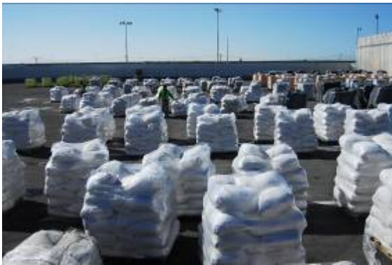
העברת סיוע הומאניטארי ב- 6 בינואר (דובר צה"ל, 6 בינואר)

■ סה"כ מתחילת המבצע עברו 586 משאיות עם סיוע הומאניטארי לרצועת עזה. ב- 6 בינואר עברו כ-57 משאיות עם סיוע הומאניטארי, דרך מעבר כרם שלום ומעבר נחל עוז. ב- 7 בינואר עברו 78 משאיות . ב- 6 בינואר התאפשרה משיכת הסולר בעבור תחנת הכוח בעיר עזה .