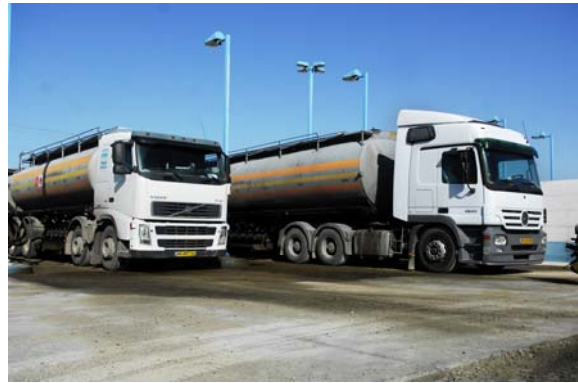
משאיות סולר וסיוע הומאניטארי המועברות לרצועת עזה (דובר צה"ל, 7 בינואר)