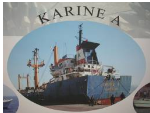
הספינה "קארין A" ועליה כמות רבה של אמצעי לחימה, שנלכדו ע"י חיל הים ב-3 ינואר 2002