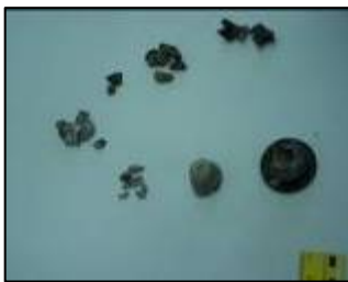
שרידי הפצמ"ר שנורה מעזה