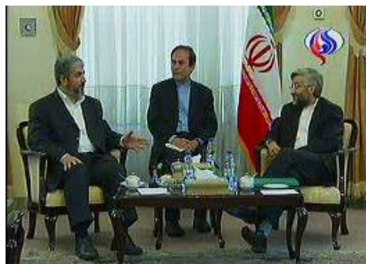
פגישה ח'אלד משעל עם מזכ"ל המועצה העליונה לביטחון לאומי, סעיד ג'לילי (ערץ אלעאלם, 24 במאי 2008)

48. במהלך הפגישות הביעו בכירים איראניים את תמיכתם בחמאס ובדרך הטרור ("ההתנגדות") שהיא מייצגת. נשיא איראן אחמדינז'אד אמר כי הניצחונות בפלסטין ובלבנון (קרי, ניצחונות חמאס וחזבאללה) הם תוצאה של "התנגדות והתמדה" והם ימשכו גם בעתיד (מאהר, 26 במאי). רפסנג'אני הצהיר כי ה"התנגדות" (קרי, הטרור) הינה הדרך העיקרית של הפלסטינים להשגת זכויותיהם (איסנ"א, 26 במאי).