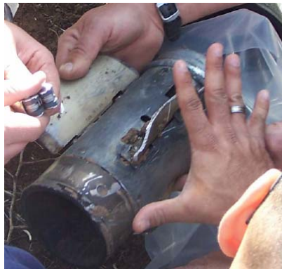
מקטע של הרקטה

22. במהלך מבצע "עופרת יצוקה" (נכון ל-14 בינואר) נורו כ-94 רקטות תקניות גראד לטווח של 40 ק"מ (רקטות תוצרת סין, שסיפקו לחמאס ע"י איראן). כמו כן נורו כ-71 רקטות מודולאריות 122 מ"מ לטווח 20 ק"מ. סה"כ נורו איפוא (עד ל-14 בינואר) כ-165 רקטות תקניות, שסופקו לחמאס ע"י איראן, והוברחו לרצועת עזה (כשליש מכלל הרקטות שנורו עד אז). בנוסף לכך נורו לעבר ישראל 4 רקטות תוצרת עצמית בקוטר 175 מ"מ ו-48 רקטות בקטרים 90 מ"מ ו-115 מ"מ, אשר יצורן מתבצע ברצועת עזה על בסיס ידע טכנולוגי איראני. ניתן איפא לקבוע כי לרקטות שסופקו לחמאס ע"י איראן או שיוצרו באמצעות ידע טכנולוגי איראני היה משקל ניכר כמותי ועוד יותר איכותי ביכולות הירי של החמאס במהלך מבצע "עופרת יצוקה".