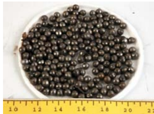
כדוריות הרס המצויות ברש"ק רקטת 122 מ"מ מתוצרת סינית (טווח 40 ק"מ) ואשר נועדו להגביר פגיעה של אזרחים.

20. במהלך מבצע "עופרת יצוקה" הגיבו חמאס ושאר ארגוני הטרור על פעילות צה"ל בירי מאסיבי של רקטות לעבר ישראל בעשותם שימוש אינטנסיבי חסר תקדים ברקטות ארוכות הטווח שבידיהם . במהלך ימי המבצע אותרו נפילות מעבר ליישובים שהיו עד אז תחת איום הרקטות ובתוכם באר שבע, אשדוד, גדרה, יבנה, קריית גת, קריית מלאכי, ונתיבות. השימוש המאסיבי ברקטות מסוג זה הכניס לטווח איום הרקטות מאות אלפי אזרחים ישראליים נוספים ומרכזים עירוניים גדולים ובהם באר שבע, אשדוד וקריית גת . כמו כן איפשר טווח הרקטות הגדול את שיגורן מעומק הרצועה , מלב אזורים צפופי אוכלוסין, בעיקר לאחר שצה"ל השתלט על אזורי השיגור ה"שגרתיים" בצפון הרצועה.