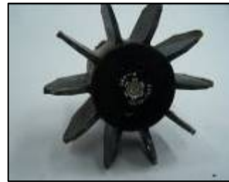
זנב פצמ"ר 120 מ"מ ממלחמת לבנון השנייה

25. מאז נמשכו אירועי הירי הללו לעבר יישובי עוטף עזה. במהלך מבצע "עופרת יצוקה" (נכון ל-10 בינואר) נורו לעבר ישראל עשרות פצצות מרגמה 120 מ"מ, שהועברו לחמאס ע"י איראן.