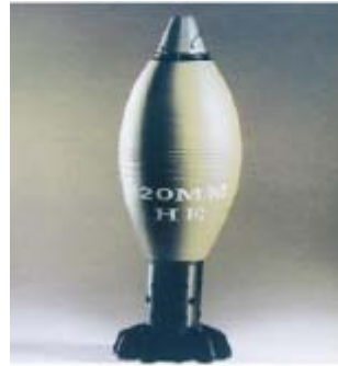
פצצת מרגמה (פצמ"ר) 120 מ"מ נפיץ איראני