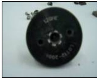
חלק מזנב הפצמ"ר שנורה מעזה