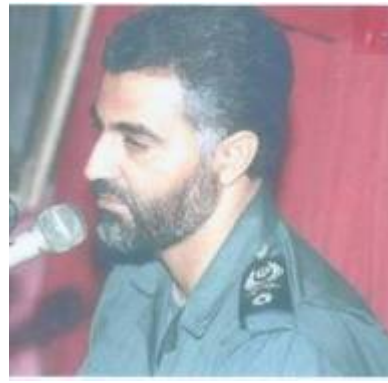
מימין: תא"ל קאסם סלימני מפקד כוח "קדס" מאז 1998 במדים. משמאל: קאסם סלימני בראיון טלוויזיוני נדיר בו הוא מספר על אחד מעמיתיו שנהרג במהלך מלחמת איראן-עיראק (טלוויזיה איראן, 18 במרץ, 2007)

8. הסיוע האיראני לחמאס בשנתיים שקדמו למבצע "עופרת יצוקה" כלל מגוון מרכיבים : אמצעי לחימה , שכללו מאות רקטות גראד 122 מ"מ לטווחים של 20 ו-40 ק"מ וטילי נ"ט מתקדמים; ידע טכנולוגי , שאיפשר לחמאס לייצר מטעני חבלה קטלניים (מדגם "שואז") בהשראת חזבאללה בלבנון; אימונים מתקדמים למאות פעילי טרור (חמאס וארגונים נוספים) באיראן; סיוע כספי לזרוע המדינית ולזרוע הצבאית של חמאס בסדר גודל של כמה מאות מיליוני דולרים לשנה; גיבוי מדיני וסיוע תעמולתי ; ומאמצים למנוע "הרגעה", לדחוף לפיגועים ולהתנגד למו"מ המדיני, שניהלה הרשות הפלסטינית עם ישראל (תהליך אנאפוליס).