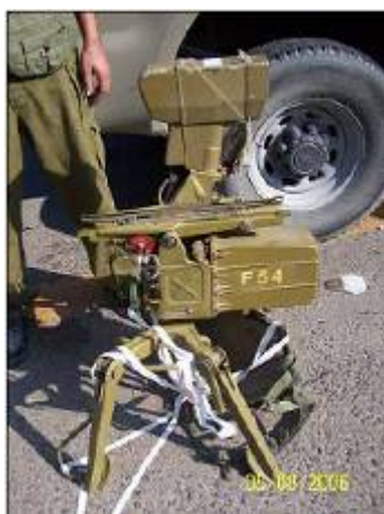
משגר קונקורס (נתפס בלבנון)