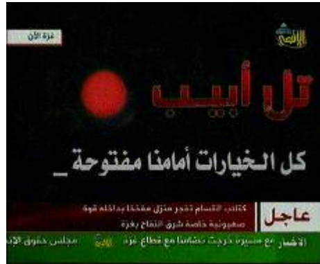
תמונה מתוך מעברון בו מאיימת חמאס לפגוע גם בתל אביב הכיתובית: "תל אביב (באותיות גדולות אדומות), כל החלופות פתוחות בפנינו" (ערוץ אלאקצא, 10 בינואר 2009)

אפשר לחמאס במהלך שנת 2008 להכניס לטווח הירי אוכלוסיה ישראלית המונה קרוב למיליון אנשים וערים גדולות כמו באר שבע, אשדוד, אשקלון, בהן מצויות תשתיות אסטרטגיות חיוניות 5 . רקטות ה-122 מ"מ לטווח של 40 ק"מ, שסיפק איראן לחמאס, זהות ככל הנראה לרקטות, שסיפקו איראן וסוריה לחזבאללה (אשר נורו במהלך מלחמת לבנון השנייה) השאיפה הנוכחית של חמאס תהיה להכניס לטווח הירי ריכוזי אוכלוסיה נוספים, עד לתל אביב , כפי שהדבר בא לידי ביטוי בשידורי הטלוויזיה שלה: