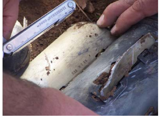
כיתוב על כנפון הרקטה E28 0210