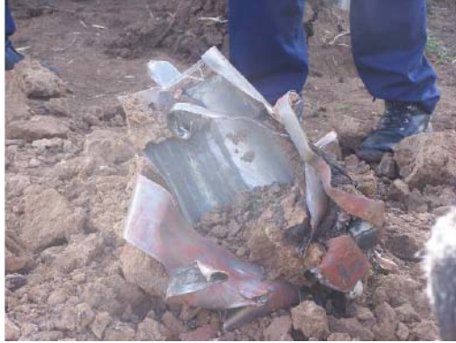
גוף הרקטה לאחר הפגיעה