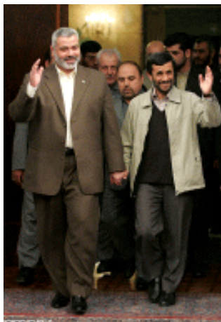
אסמאעיל הניה ונשיא איראן אחמדי נז'אד צועדים שלובי ידיים (אירנ"א, 10 בדצמבר 2006)

45. אתר האינטרנט של חמאס (11 דצמבר, 2006) דיווח כי האיראנים העניקו להניה סיוע של 250 מליון $. מסכום זה הוענקו כ-100 מליון $ בשנת 2007 לכיסוי משכורות הפקידים במשרדי החברה, העבודה והתרבות של חמאס למשך שישה חודשים. 14 45 מליון $ מהסיוע האיראני הוענקו למימון קצבאות האסירים שבבתי הכלא הישראליים ואת הסיוע למשפחותיהם במשך ששת החודשים הבאים. הסיוע האיראני הובטח גם, בין השאר, ל-3,000 דייגים פלסטינים ול-100,000 מובטלים פלסטינים. 15 בנוסף לכך על פי דיווח בעיתונות האיראנית, גורמים בכוחות הבסיג' (יחידה סמי-צבאית המשתייכת למשמרות המהפכה) מסרו לאסמאעיל הניה 550,000 דולר מכספי תרומות (דצמבר 2006).