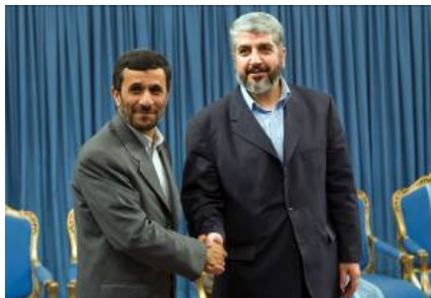
ח'אלד משעל נפגש עם נשיא איראן אח'מדינז'אד (רויטרס, 26 במאי 2008)

משמרות המהפכה הבטיח למשעל אספקה של רקטות חדישות המיוצרות כעת במיוחד עבור חמאס במרכז באקרי (מפעל לייצור נשק) בטהראן (אלשרק אלאוסט, 25 במאי 2008).