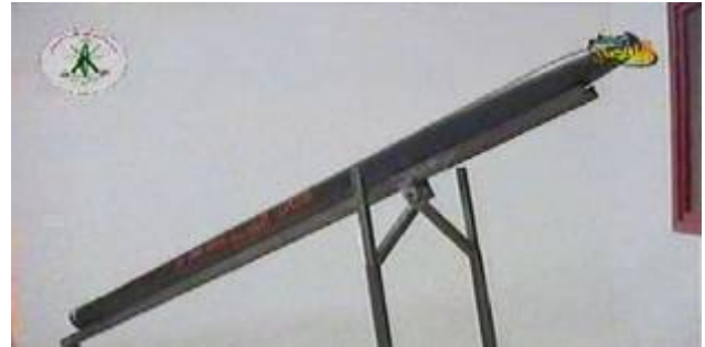
רקטה 122 מ"מ מודולארית טווח מרבי של כ-20 ק"מ