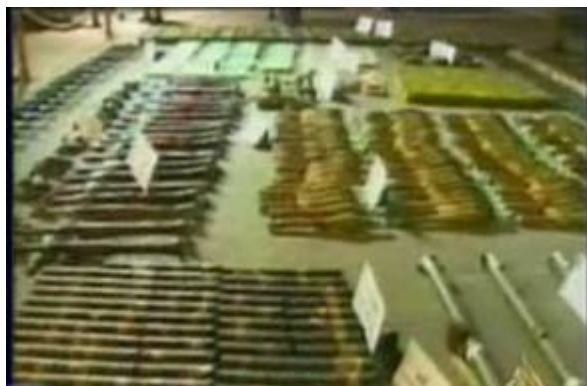
תצוגה של אמצעי הלחימה שנמצאו על גבי "קארין A". לו הגיעו הללו לשטחי "הרשות הפלסטינית" הם היו משדרגים משמעותית את יכולות ארגוני הטרור

34. יזכר, כי בעבר כבר נחשף ניסיון איראני לנצל תעבורה של כלי שיט , כולל משלוחים ימיים תמימים לכאורה, לצורך העברת אמצעי לחימה לגורמי הטרור ברצועה. הדבר עלה באופן בולט במיוחד בפרשת הספינה KARRINE A (דצמבר 2001). הספינה, שנתפסה ע"י חיל-הים במימי הים האדום בדרכה לעזה, הכילה משלוח אמצעי לחימה רחב היקף (כ- 50 טון) מאיראן עבור ארגוני הטרור ובכלל זאת רקטות ארוכות טווח, פצצות מרגמה, מוקשים, אמצעי נ"ט, ותחמושת מסוגים שונים, שהוסלקו בבטן האוניה כסחורות תמימות. חקירת הגורמים הפלסטיניים 10 שהיו מעורבים בפרשה, הוכיחה כי המשלוח בוצע בשותפות מלאה עם "משמרות המהפכה"