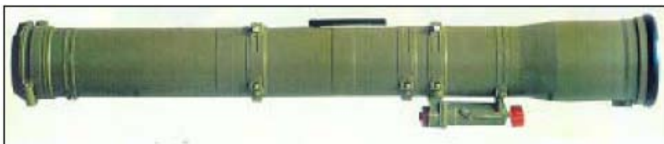
טיל קונקורס בתוך זביל שיגור