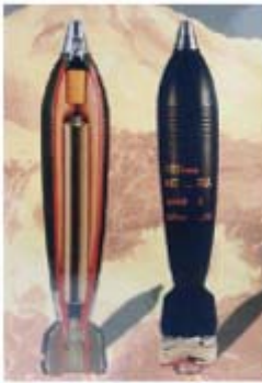
פצמ"ר 120 מ"מ עם מע"ר (מנוע עזר רקטי) איראני

א. ב-29 בפברואר 2008 נפלה פצצת מרגמה נוספת ליד מוצב "סופה" של צה"ל (בדרום הרצועה). מניתוח שרידי הפצצה התברר, כי מדובר בפצצת מרגמה 120 מ"מ נפיץ תקני, מתוצרת איראן משנת ייצור 2006.