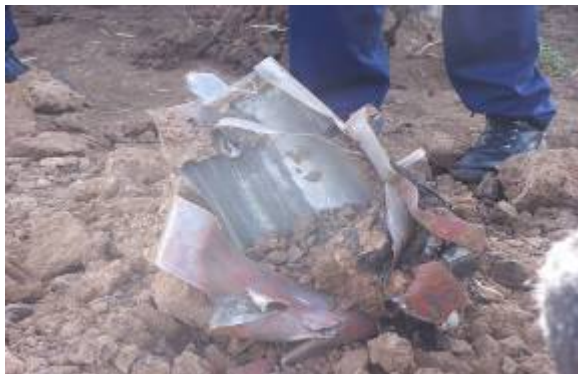
שריד (מקטע זנב) של רקטה 122 מ"מ לטווח מרבי של 40 ק"מ מתוצרת סינית.