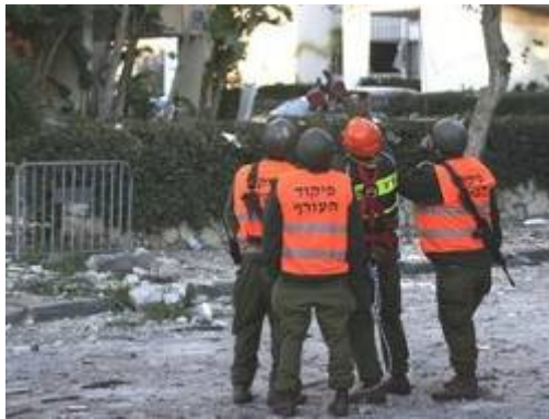
חיילים של פיקוד העוקף ביירת נפילת הרקטה סמוך לגן הילדים באשדוד (באדיבות NRG צילום: אדי ישראל, 11 בינואר)

■ בבאר שבע היו בשעות הבוקר של ה-11 בינואר שתי נפילות רקטות ארבעה אזרחים לקו בחרדה. בסביבות השעה 1600 נפלה רקטת גראד 122 מ"מ באשדוד ופגעה סמוך לגן ילדים שהיה ריק באותה שעה. שני אזרחים לקו בחרדה. בסביבות 2100 נורה מטח של חמש רקטות לעבר אשקלון . לא היו נפגעים.