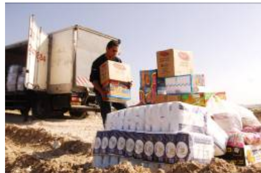
מימין: פריקת מוצרי המזון בצד הישראלי. משמאל: איסוף הסיוע על ידי המשפחה הפלסטינית (דובר צה"ל, 11 בינואר)