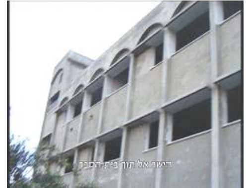
מימין: מבנה בית הספר במרכז: ניתן לראות את הפתיל שהקיף את המבנה משמאל: מתג ההפעלה (צילום: דובר צה"ל, 11 בינואר)