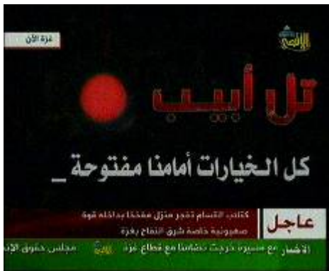
תמונה מתוך מעברון בו מאיימת חמאס לפגוע גם בתל אביב (ערוץ אלאקצא, 10 בינואר)

אלו הן תמונות שהתפרסמו בתחילת מבצע "עופרת יצוקה", שחמאס אוסר עתה על פרסומן. מימין: עלאי אבראהים אלקטראוי, פעיל בגדודי עז אלדין אלקסאם, שנהרג במהלך המבצע (PALDF, 30 בדצמבר 2008). משמאל: יוסף מחמד ד'יאב, פעיל בגדודי עז אלדין אלקסאם, שנהרג במבצע, כשהוא נושא משגר "אליאסין" (אתר הפורומים של גדודי עז אלדין אלקסאם, 1 בינואר 2009)