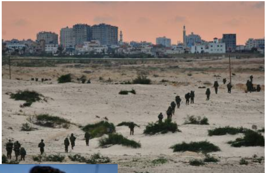
חיילי מילואים של צה"ל נכנסים לפעילות ברצועת עזה (דובר צה"ל, 12 בינואר)