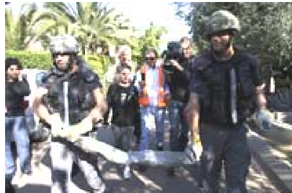
הרקטה שנפלה באשקלון והנזק שגרמה (צילום: אדי ישראל, 12 בינואר)