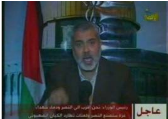
אסמאעיל הניה בנאום מוקלט (ערוץ אלאקצא, 12 בינואר)

גישה חיובית כלפי כל יוזמה, שתפסיק את פעולות צה"ל, תסיג את צה"ל מהרצועה ותתחייב לפתוח את המעברים. "נשתף פעולה באופן אחראי, בפתיחות וברצועה חיובית עם כל יוזמה שתוכל לבצע זאת".