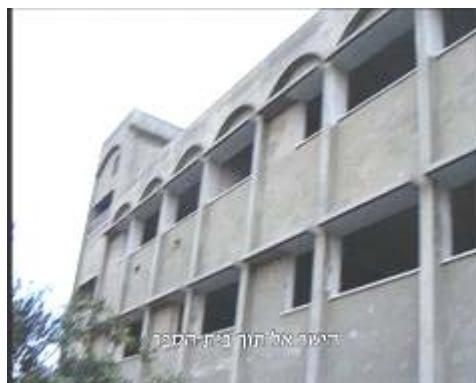
מימין: מבנה בית הספר משמאל: ניתן לראות את הפתיל שהקיף את המבנה (11 בינואר)