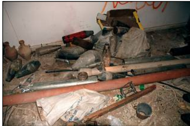
אמצעי הלחימה שנמצאו במסגד . משמאל: תותח נ"מ (דובר צה"ל, 13 בינואר)