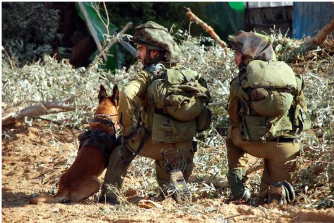
חיילי צה"ל בפעילות ברצועת עזה (דובר צה"ל, 13 בינואר)