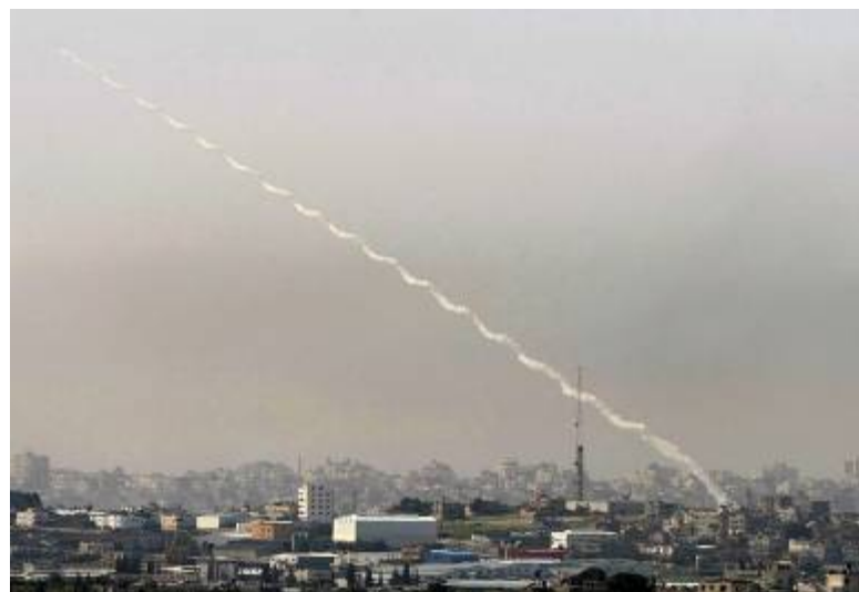
נמשך ירי הרקטות ממרכז העיר עזה (אתר paldf, 14 בינואר, 2008)