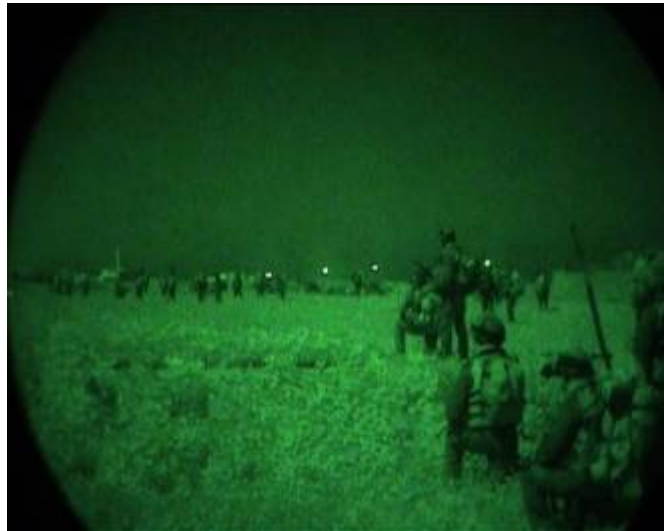
כוחות צנחנים בפעולה לילית בפאתי עזה (דובר צה"ל, 14 בינואר, 2008)