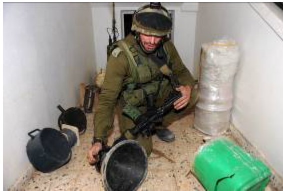
אמצעי לחימה שנחשפו במסגד (דובר צה"ל, 15 בינואר)