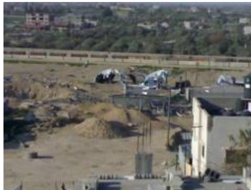
מנהרות אשר פוצצו ע"י כוחות צה"ל ברפיח (אתר paldf, 14 בינואר)