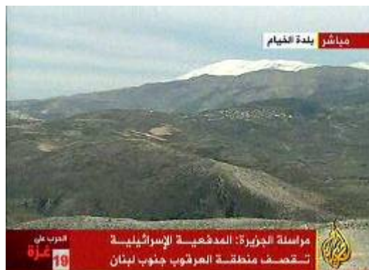
אזור רשיא אלפח'ר ממנו נורו הרקטות (אלג'זירה, 14 בינואר)

■ בשעה 0830 בבוקר אותרו שלוש נפילות רקטות, שנורו מאזור ראשיא אלפח'ר (כפר נוצרי בגזרה המזרחית) בדרום לבנון. שתי נפילות אותרו בשטח לבנון נפילה שלישית לא אותרה. תושבי אזור קריית שמונה נכנסו למקלטים. שלושה אזרחים נפגעו כתוצאה מחרדה. אף ארגון לא נטל על עצמו אחריות לירי. צה"ל השיב בירי ארטילרי לעבר מקום השיגור.