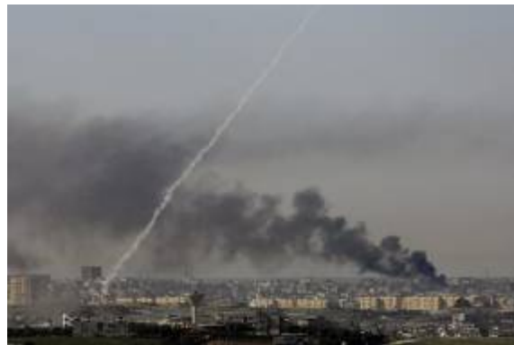
ירי רקטות לעבר ישראל מלב אזורי מגורים (פורום paldf, 14 בינואר)

■ נמשכת מגמה של ירידה איטית בהיקף ירי הרקטות לעבר ישראל, הגם שרקטות ממשיות ליפול בטווחים מרוחקים כגון באר שבע ואשדוד . במהלך 15 בינואר אותרו בשטח ישראל 14 נפילות של רקטות ו-2 נפילות פצצות מרגמה . אירוע בולט היה בסביבות 1300 כאשר מטח של שש רקטות ארוכות טווח 122 מ"מ נורו לעבר ישראל. הנפילות אותרו באזור אשדוד ובאר שבע. חלק מהרקטות שוגרו בעת "חלון הזמן ההומניטארי". לא היו נפגעים. סה"כ נפלו בשטח מתחילת מבצע "עופרת יצוקה" 485 רקטות ו-183 פצצות מרגמה .