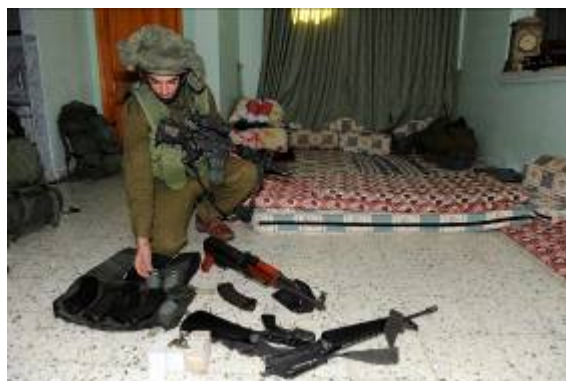
אמצעי לחימה שנחשפו בבתי פעילי חמאס (דובר צה"ל, 15 בינואר)