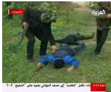
כתב ערוץ אלערביה מסקר תרגילים של חטיבות צלאח אלדין בוועדות ההתנגדות העממית, בהם דימו חטיפת חייל, בדומה לחטיפת גלעד שליט (ערוץ אלערביה, 2 בפברואר).