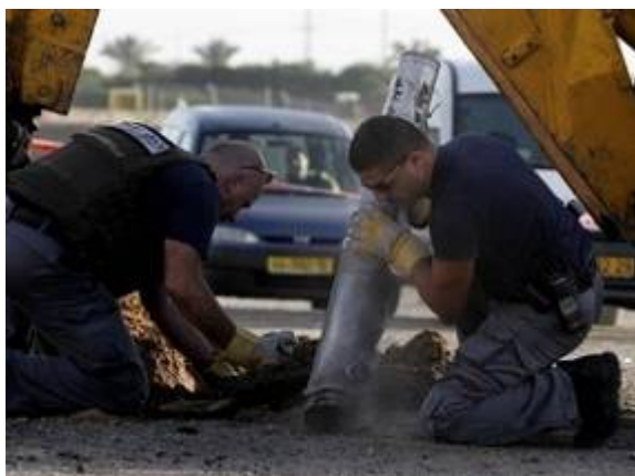
רקטת גראד שנורתה ב- 3 בפברואר לעבר אשקלון