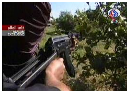
כתב ערוץ אלעאלם האיראני התלווה לאימוני פלוגות ירושלים של הג'האד האסלאמי בפלסטין (ערוץ אלעאלם, 1 בפברואר).