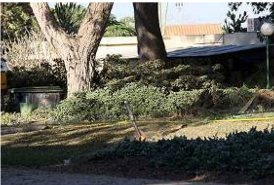
רקטה שנפלה באחד מיישובי הנגב, בסמוך לגן ילדים (באדיבות ynet, 1 בפברואר, צילום: רועי עידן)