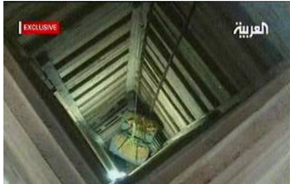
פעילות במנהרות בין רצועת עזה למצרים (ערוץ אלערביה, 1 בפברואר)

■ בעוד ארגוני הטרור והמברייחים עושים מאמץ לשקם את תשתית המנהרות שנפגעה החלה מצרים בפעילות נמרצת למניעת ההברחות בגבול עם רצועת עזה. כך למשל, ב-2 בפברואר פוצצו כוחות הביטחון המצריים כמה עשרות מנהרות בגבול עם רצועת עזה (אלדסתור, 2 בפברואר). ב-31 בינואר החלה מצרים בפריסת תשתית מצלמות וחיישני תנועה שהוצבו לאורך הגבול עם רצועת עזה במסגרת מאמצי למניעת הברחות (רויטרס, 31 בינואר).