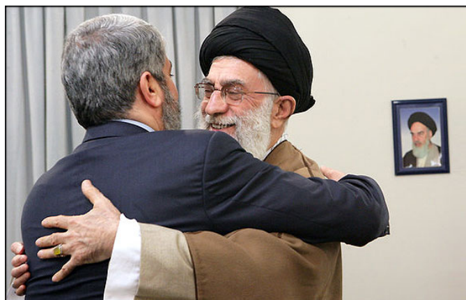
יו"ר הלשכה המדינית של חמאס בפגישתו עם מנהיג איראן עלי ח'אמנאי (סוכנות הידיעות האיראנית מאהר, 1 בפברואר)