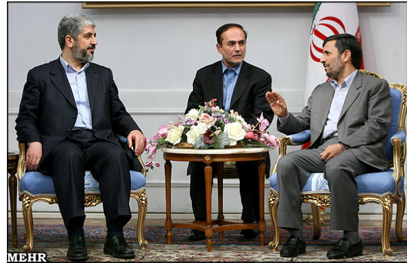
מימין: פגישת ח'אלד משעל עם נשיא איראן מחמוד אחמדינז'אד. משמאל: פגישת משלחת חמאס עם מנהיג איראן עלי ח'אמנאי (סוכנות הידיעות האיראנית מאהר, 1 בפברואר).

■ במהלך הפגישות השמיעה ההנהגה האיראנית הצהרות תמיכה בחמאס: