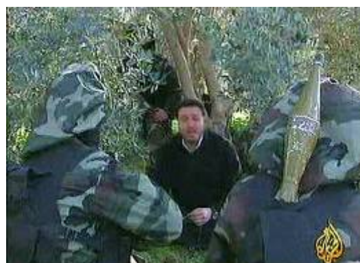
כתב ערוץ אלג'זירה התלווה לאימוני פלוגות ירושלים של הג'האד האסלאמי בפלסטין (ערוץ אלג'זירה, 1 בפברואר).