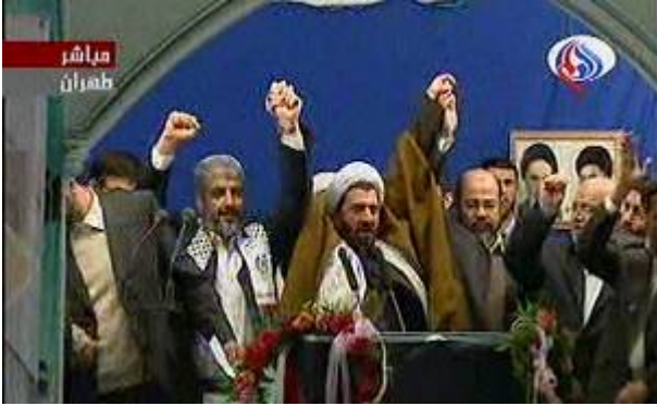
ח'אלד משעל בנאומו באוניברסיטת טהראן (ערוץ אלעאלם, 2 בפברואר).

• ח'אלד משעל הודה בנאומו בפני סטודנטים באוניברסיטת טהראן, על תמיכת איראן בחמאס והוסיף כי "איראן הפכה למעניקת הניצחון לתנועות ההתנגדות ושחרור בעולם ובמיוחד בפלסטין". משעל המשיך בתיאור ישראל כמפסידה ואמר כי הפגיעה בפלסטינים הייתה קשה "אולם הניצחון גדול מכך" (ערוץ אלעאלם, 2 בפברואר).