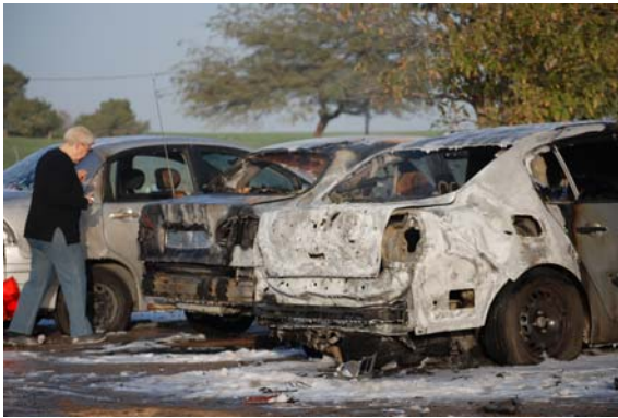
פגיעת רקטה ב- 8 בפברואר בקיבוץ במועצה אזורית שער הנגב

• ב-3 בפברואר בשעות הבוקר נפלה רקטת גראד (122 מ"מ) בין שני מבנים באשקלון שלושה בני אדם לקו בחרדה, מכוניות נפגעו מרסיסים. היה זה אירוע ראשון מאז עצירת האש בו נפלה רקטת מסוג זה בשטח ישראל.