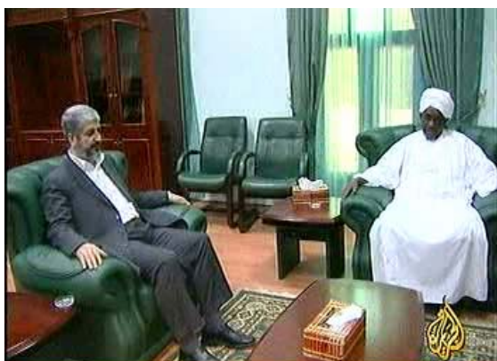
ח'אלד משעל בביקורו בסודאן (אלג'זירה, 7 בפברואר)

■ ח'אלד משעל , ראש הלשכה המדינית של חמאס, הציג בעצרת בח'רטום "תכנית עבודה" של חמאס לטווח הקצר והארוך (ערוץ אלג'זירה, 8 פברואר). להלן כמה נושאים שעלו בנאומו: