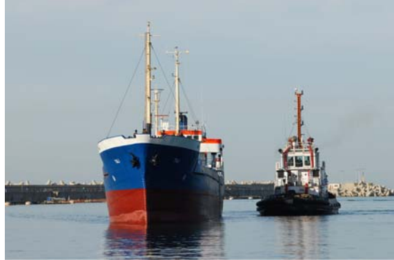
הספינה "טלי" מובלת לנמל אשדוד

■ בספינה התגלה סיוע הומניטארי בכמות מעטה של כמה טונות בודדות. בנוסף לכך נמצאו על סיפונה כ-20 בני אדם, ביניהם מספר עיתונאים והארכיבישוף קפוצ'י שהורשע בישראל בשנות השבעים בשל הברחת נשק לאש"ף. כל השוהים בספינה הועברו לתחקור כוחות הביטחון ולאחר מכן הוחזרו ללבנון.