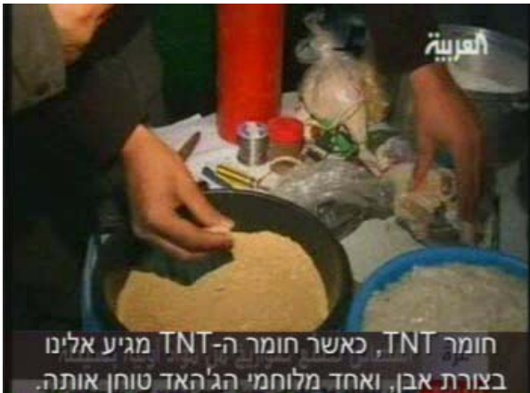
פעיל פתח מתאר בפני כתב ערוץ אלערביה את תהליך ייצור הרקטות (אלערביה, 5 בפברואר)