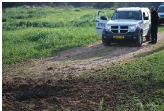
רקטה, שנפלה בשטח פתוח סמוך לשדרות, ב-13 בפברואר (צילום: זאב טרכטמן, 13 בפברואר)