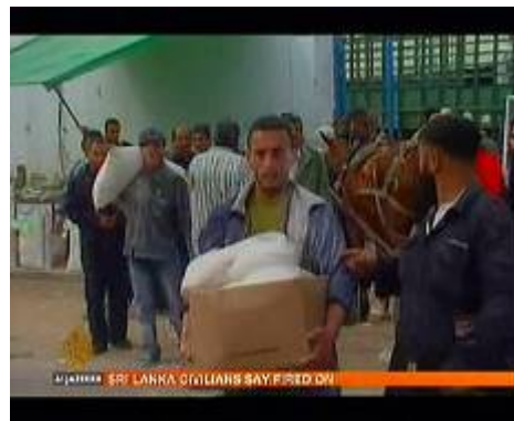
פלסטינים ברצועת עזה מוכרים סיוע הומניטארי שקיבלו בשוק שחור (מתוך כתבה של מייק קירש בערוץ אלג'זירה באנגלית, 12 בפברואר)