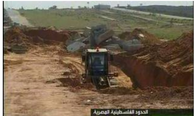
מנהרות בגבול בין רצועת עזה למצרים (רוסיה אליום, 13 בפברואר)