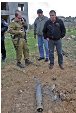
הרקטה שנפלה בישוב מעיליא (צילום: שי וקנין, 21 בפברואר)

■ ארגון חזבאללה הכחיש קשר לירי (סוכנות הידיעות הצרפתית, 21 בפברואר). חבר הלשכה המדינית של ארגון החזית העממית-המפקדה הכללית, ראמז מצטפא, אמר כי למרות האשמות שהועלו בלבנון, לארגונו אין קשר לירי. הוא הוסיף כי כיוון שיש להם הערכה "לרגישות בלבנון", הם לא מגיבים לאירועים ברצועת עזה. לטענתו "אין גורם פלסטיני הקשור לשיגור הרקטות" (NTV, 21 בפברואר).