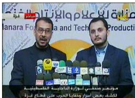
מסיבת עיתונאים שערכה חמאס בה שודרו "הודאותיהם" של פעילי פתח (ערוץ אלאקצא, 23 בפברואר)