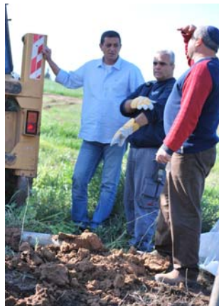
פינוי רקטה שנפלה ב- 23 בפברואר סמוך לשדרות (זאב טרכטמן, 23 בפברואר)

■ ארגוני הטרור ממשיכים להימנע במרבית המקרים מנטילת אחריות פומבית לאירועים. ברוב המקרים נטל על עצמו אחריות לירי גוף פיקטיבי המתקרא "גדודי חזבאללה בפלסטין" (אתר קדסנט 18, 19, 22 בפברואר). במקרה אחד של ירי פצצות מרגמה נטל על עצמו גדודי חללי אלאקצא/חוליות אימן ג'ודא את האחריות (אתר אימן ג'ודה, 21 בפברואר). את האחריות להנחת המטענים נטל על עצמו הג'האד האסלאמי בפלסטין (אתר קדסנט, 23 בפברואר).