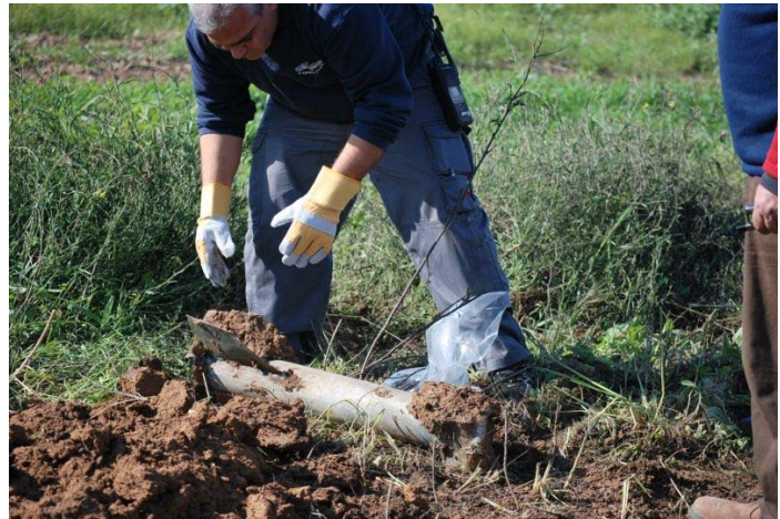
רקטה שנפלה סמוך לשדרות בנגב המערבי (צילום: זאב טרכטמן, 23 בפברואר)