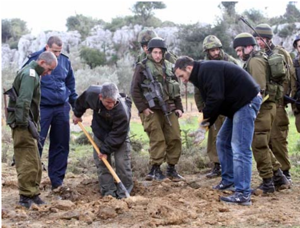
רקטה שנפלה בישוב מעיליא בגליל המערבי (21 בפברואר)