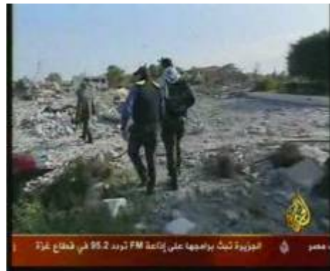
ע'סאן בן ג'דו מסייר ברצועת עזה ומראיין פעילי חמאס (אלג'זירה, 21 בפברואר)