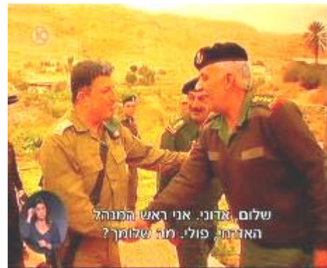
מפגש קציני המנהל האזרחי וקצינים פלסטיניים (ערץ 10, 19 בפברואר).