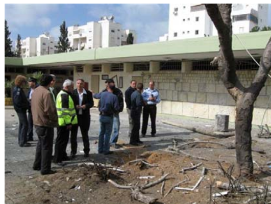
הרקטה שנפלה בחצר בית הספר באשקלון (באדיבות עיריית אשקלון, 28 בפברואר, 2009)

3. על פי הממצאים בשטח, היו הרקטות ששוגרו לעבר אשקלון רקטות משודרגות בקוטר 175 מ"מ , שהטווח המרבי שלהן הוא עד 18 ק"מ (בירי הנוכחי השיגו הרקטות טווח של כ-16