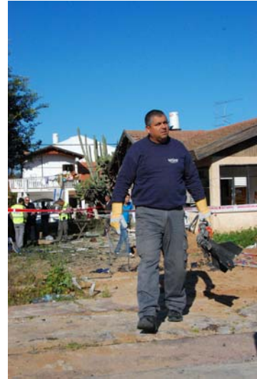
חבלן משטרה אוחו את אחת הרקטות הרקטה שנורו לעבר הבית בשדרות (www.sderotmedia.com), 26 בפברואר, צילום: נועם בדין)

ב. 27 בפברואר – אותרו שתי נפילות רקטות בשטח ישראל. לא היו נפגעים ולא נגרם נזק.