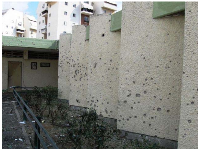
הנוק שנגרם לבית ספר באשקלון כתוצאה מנפילת רקטה ( באדיבות עיריית אשקלון, 28 בפברואר, 2009 )