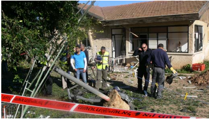
בית שנפגע בשדרות כתוצאה מירי רקטה (www.sderotmedia.com), 26 בפברואר, צילום: מיטל אחיון)

א. 26 בפברואר – שלוש רקטות נפלו בשטח ישראל. שתיים מהן אותרו בעיר שדרות . רקטה אחת פגעה בבית בעיר והשנייה נפלה בשטח פתוח סמוך לאזור התעשייה. לא היו נפגעים. נזק נגרם לבית. בתגובה תקף חיל האוויר מנהרות הברחה באזור רפיח.