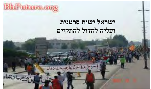
צילומים של הפגנה בבחריין במהלך יום ירושלים. בהפגנה נישאו תמונותיו של חסן נצראללה וכרזות "ישראל ישות סרטנית ועליה לחדול להתקיים"