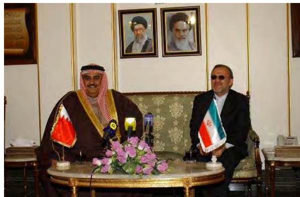
שר החוץ של בחריין, ח'אלד בן אחמד אלח'ליפה, בפגישה עם שר החוץ האיראני, מנוצ'האר מתקי, במאמץ להרגיע את המתח שהשתררה בין המדינות (אלמנאר, 27 בפברואר 2009)

ג. מחמד עלי אבטחי, סגן נשיא איראן לשעבר, ציין כי דברי נאטק נורי צוטטו בצורה בלתי מדויקת וכי איראן הרשמית מכירה בבחריין כמדינה עצמאית ומקיימת עימה קשרים טובים (אלח'ליג', מאע"מ, 16 פברואר).