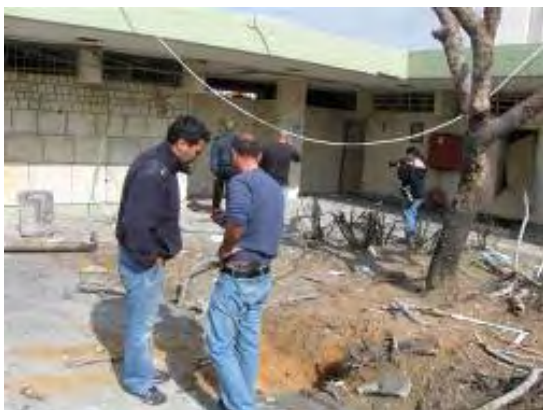
רקטה שנפלה בחצר בית הספר באשקלון (28 בפברואר, 2009)

בשארם אלשיח' נאספות תרומות לשיקום רצועת עזה... ובנגב המערבי גובר ירי הרקטות