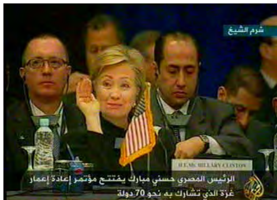
מזכירת המדינה האמריקנית, הילרי קלינטון בוועידת המדינות התורמות (אלג'זירה, 2 במרץ)