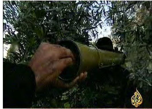
פעילים צבאיים בחמאס מציגים, בכתבתו של בן ג'דו, משגר רקטות B-29 ורקטה תואמת (אלג'זירה, 28 בפברואר)