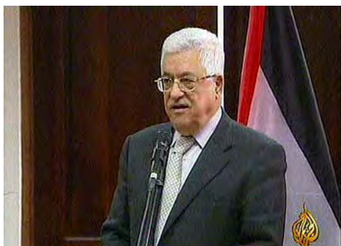
יו"ר הרשות הפלסטינית אבו מאזן בנאומו בוועידה (אלג'זירה, 2 במרץ)

■ להלן עיקרי ההצהרות של כמה ממשותפי הוועידה: