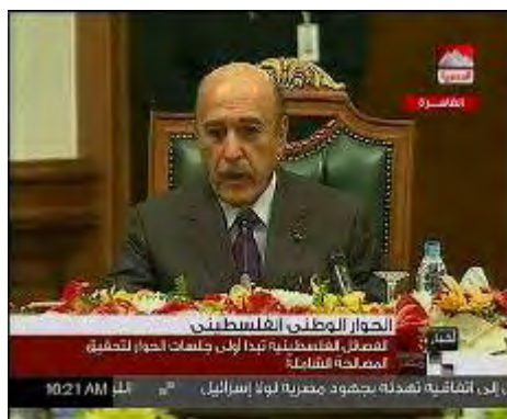
ראש המודיעין הכללי המצרי עמר סלימאן נושא דברים בפתיחת הדיאלוג הפנים-פלסטיני (טלוויזיה מצרית, 26 בפברואר)

■ את השיחות פתח ראש המודיעין הכללי המצרי עמר סלימאן , שקרא לאיחוד השורות בעם הפלסטיני לשם הגשמת התקוות להקמת מדינה פלסטינית ריבונית שבירתה ירושלים. עמר סלימאן ציין כי הוא חש שקיים רצון בקרב הצדדים לסיים את הפילוג. בדבריו, הציג את המאמצים המצריים בחודשים האחרונים להשגת הרגעה ופיוס, שלא נשאו פרי.