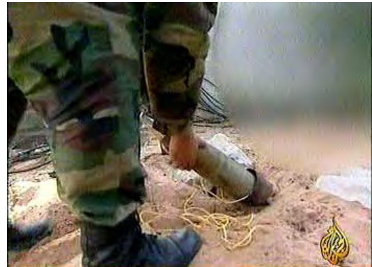
פעילי חמאס מציגים כני שיגור רקטות מחופרים באדמה (אלג'זירה, 28 בפברואר)