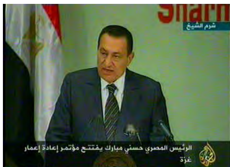
נשיא מצרים חסני מברכ בפתיחת הוועידה (אלג'זירה, 2 במרץ)

שהקהילה הבינלאומית תדרוש מהממשלה שתוקם בישראל להתחייב לפתרון שתי המדינות ולהסכמים שישראל חתמה עליהם.