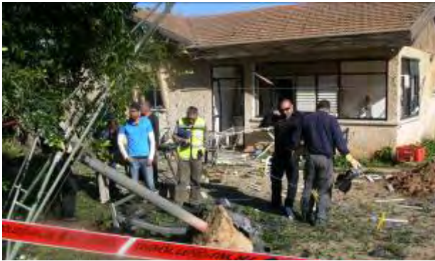
בית בשדרות שנפגע כתוצאה מירי רקטה (26 בפברואר, צילום: מיטל אוהיון) www.sderotmedia.com

■ להלן פירוט אירועי ירי הרקטות הבולטים במהלך השבוע: