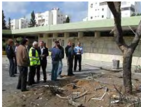
רקטה שנפלה בחצר בית הספר באשקלון (באדיבות עיריית אשקלון, 28 בפברואר, 2009)

● 28 בפברואר - אותרו שבע נפילות רקטות. שתי נפילות רקטות ארוכות טווח אותרו בעיר אשקלון . רקטה אחת נפלה בחצר בית ספר (שלא התקיימו בו לימודים בשל השבת). לבניין נגרם נזק כבד ורסיסים חדרו לחדרי הכיתות. שבעה אזרחים המתגוררים בסמוך לבית הספר לקו בחרדה. על פי הממצאים בשטח, היו הרקטות ששוגרו לעבר אשקלון רקטות משודרגות בקוטר 175 מ"מ , שהטווח המרבי שלהן הוא עד 18 ק"מ (בירי הנוכחי השיגו הרקטות טווח של כ-16 ק"מ).