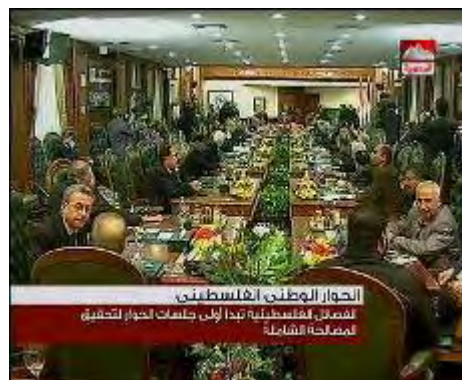
מימין: משתפי הדיאלוג הפנים-פלסטיני. משמאל: נציגי חמאס לדיאלוג (טלוויזיה מצרית, 26 בפברואר)

■ את השיחות פתח ראש המודיעין הכללי המצרי עמר סלימאן , שקרא לאיחוד השורות בעם הפלסטיני לשם הגשמת התקוות להקמת מדינה פלסטינית ריבונית שבירתה ירושלים. עמר סלימאן ציין כי הוא חש שקיים רצון בקרב הצדדים לסיים את הפילוג. בדבריו, הציג את המאמצים המצריים בחודשים האחרונים להשגת הרגעה ופיוס, שלא נשאו פרי.