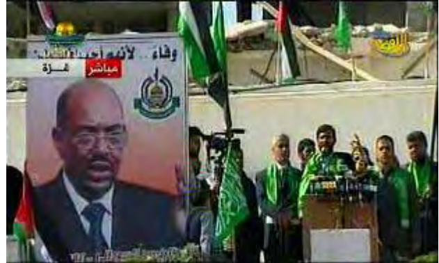
הפגנות תמיכה בנשיא סודאן בעזה כשדגלי חמאס ברקע (ערוץ אלאקצא, 6 במרץ)