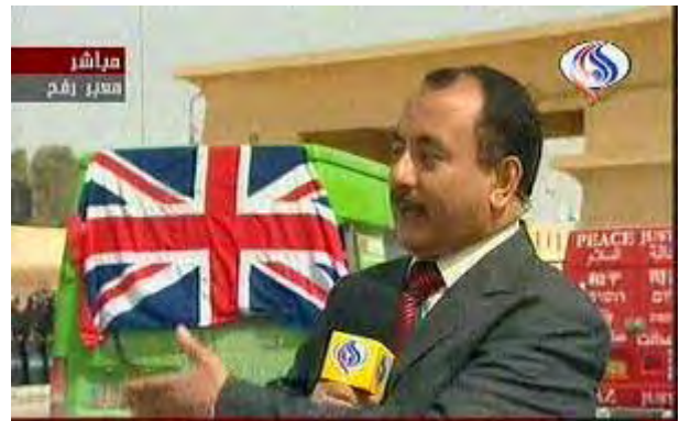
שיירת סיוע בריטית לרצועת עזה עוברת במעבר רפיח (ערוץ אלעאלם, 9 במרץ)