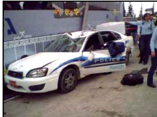
זירת הפיגוע בירושלים