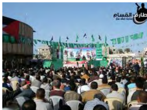
העצרת בדיר אלבלח (paldf, 6 במרץ)