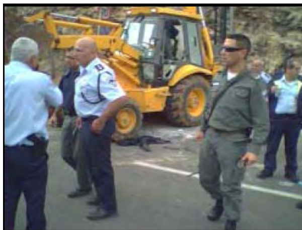
פיגוע דריסה נוסף בירושלים