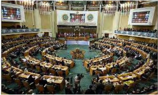
מימין: כינוס הוועידה באיראן. משמאל: נשיא איראן נושא דברים (פארס, 5 במרץ)

■ בכירים איראניים תקפו בהתבטאויותיהם את ועידת שרם אלשיח':