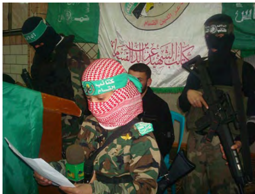
עצרת שארגנה הזרוע הצבאית של חמאס ברפיח (paldf, 5 במרץ)

■ ב- 6 במרץ נערכו עצרות נוספות ברצועת עזה. במהלך עצרת בדיר אלבלח, בהשתתפות אלפי בני אדם, דיבר פתחי חמאד , ציר חמאס, על חשיבות ה"התנגדות" במאבק עם ישראל "ועל הצורך לדבוק בזכויות ולא להתכופף בפני הלחצים החיצוניים". בסיום העצרת נערך טקס הוקרה ל- 33 מהרוגי דיר אלבלח בעת מבצע "עופרת יצוקה" (פאל-מדיה, 6 במרץ).