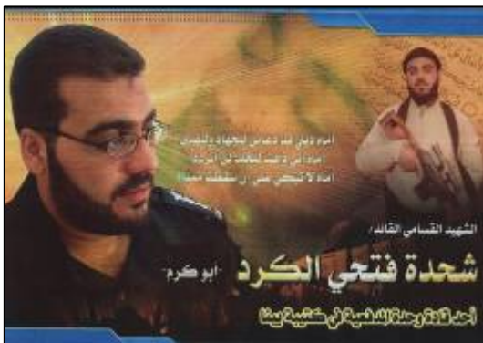
שחדה פתחי אלכרד "השהיד הקסאמי המפקד..."/ "אחד ממפקדי יחידת הארטילריה בגדוד יבנה"