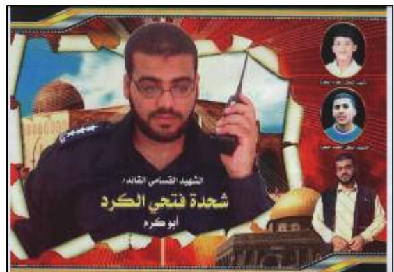
שחדה פתחי אלכרד מצולם במדי משטרה אך תחת הכינוי "החלל הקסאמי המפקד"