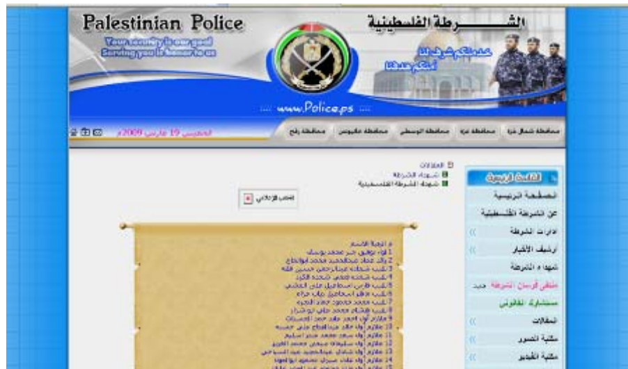
אתר המשטרה הפלסטינית בעזה: באתר מופיעים שמות של 232 אנשי מערך ביטחון הפנים, שנהרגו במהלך מבצע "עופרת יצוקה"