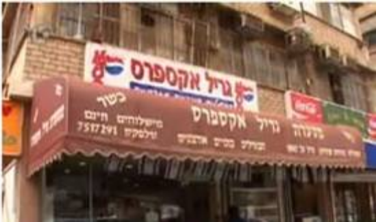
מסעדת "גוריל אקספרס" ברמת גן בה תכננו השניים לבצע את ההרעלה