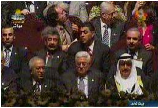
יו"ר הרשות הפלסטינית אבו מאזן וראש הממשל סלאם פיאצ' בטקס בבית לחם (הטלוויזיה הפלסטינית, 21 במרץ)

■ האירוע המרכזי, במהלכו נאם יו"ר הרשות הפלסטינית אבו מאזן, התקיים בבית לחם. השתתפו בו שרי תרבות ערביים ויוצרים ערביים בתחום התרבות והאומנות (סוכנות מען, 20 במרץ). בנאומו, פנה אבו מאזן לעם הפלסטיני וקרא לו להגן על אופייה ומעמדה של ירושלים כעיר הבירה של "פלסטין". הוא גם אמר כי ללא הפסקת הבנייה בירושלים ובהתנחלויות לא תהיה הזדמנות להתחיל במשא ומתן רציני [עם ישראל] והגדיר את הדיאלוג הפנים-פלסטיני כנושא אשר עומד עתה בראש מעייניו (סוכנות ופא, 21 במרץ).