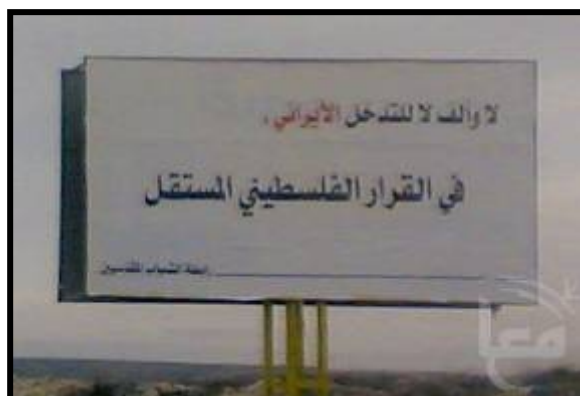
"לא ולאף פעמים לא להתערבות האיראנית בהחלטה הפלסטינית העצמאית"

■ אתר מען דיווח (20 מרץ), כי תושבים פלסטיניים הופתעו לגלות בכניסה לראמאללה שלטי חוצות הקוראים לאיראן לחדול מהתערבותה בנושא הפלסטיני . השלטים מנוסחים באופן בוטה נגד מדיניות איראן, כאשר נכתב בהם "לא, ולאף פעמים לא, להתערבות האיראנית בהחלטה הפלסטינית העצמאית". השלטים חתומים על ידי ארגון בשם "אגודת הנוער הירושלמי". כתב מען הוסיף, כי שלטים דומים נצפו גם ברחובות הפנימיים בראמאללה. כמו כן, הוצבו שלטים באותו סגנון הקוראים להפסקת ההתערבות הסורית והקטרית בנושא.