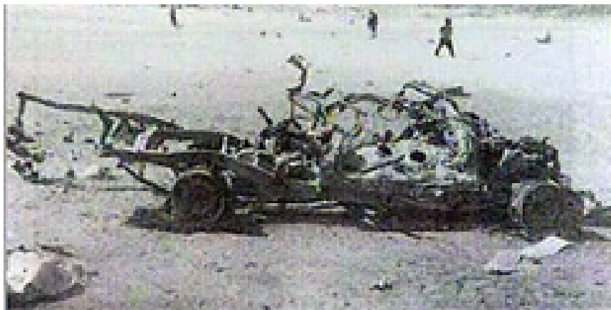
אתר התקיפה בסודאן (אלג'זירה, 26 במרץ)