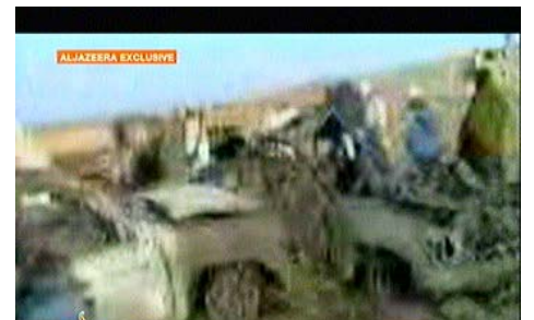
תמונות שעל פי ערוץ אלג'זירה צולמו באתר התקיפה בסודאן (אלג'זירה, 26 במרץ)