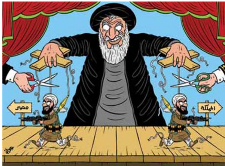
מצרים וסעודיה מאימות ע"י חתרנות איראנית: איראן מפעילה טרוריסטים-מריונטות נגד מצרים וסעודיה (אלוטן, סעודיה, 12 באפריל 2009)