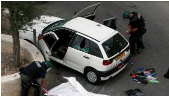
חבלנים בודקים את הרכב של המחבל ואת גופתו