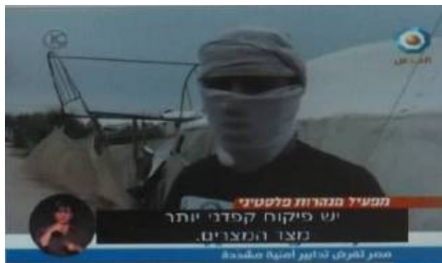
פעיל מנהרות בעזה מודה שפעילות מצרים למניעת הברחות מקשה על פעילות ההברחות (באדיבות ערוץ 10, 12 באפריל)

■ לאחרונה הרחיבה מצרים את פעילותה נגד "תעשיית המנהרות" באזור הגבול שבין מצרים לרצועת עזה, יתכן בעקבות חשיפת ההתארגנות של חזבאללה בשטחה (ראו להלן). "מקורות יודעי דבר" מסרו לעיתון אלחיאת אלג'דידה (9 באפריל) כי פעילות ההברחות הצטמצמה בצורה ניכרת, וכי כוחות הביטחון המצריים סתמו מנהרות רבות להברחת דלק וסחורות. בעלי המנהרות ופעילים ב"תעשיית המנהרות" טענו כי המבצע המתמשך נגד ההברחות הגיע לשיאו בתקופה האחרונה. אחד מבעלי המנהרות ציין, כי מרבית המנהרות הושבתו לחלוטין גם אם לא נהרסו והוסיף: "אנו כרגע בתקופה של שפל עד שיירגעו העניינים" (אלאיאם, 9 באפריל).