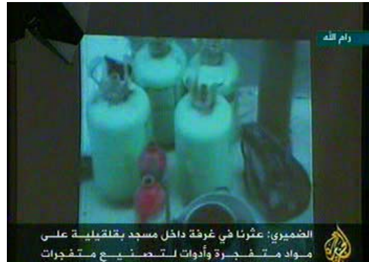
בלוני גז שנמצאו במעבדת הנפץ במרתף המסגד בקלקיליה