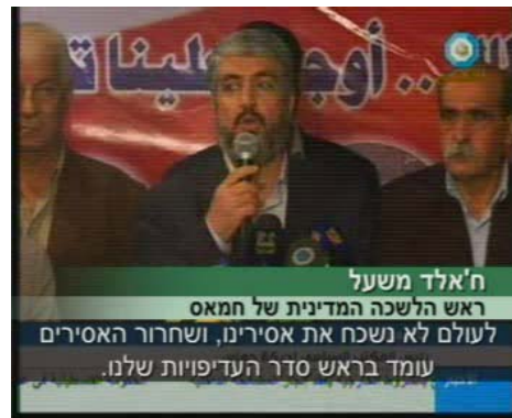
ח'אלד משעל בנאום שנשא במחנה הפליטים אלירמוכ שבסוריה

• אסמאעיל הניה , ראש ממשל חמאס, אמר כי עסקת חילופי השבויים "דורכת במקום" והדגיש, כי "ההתנגדות" לא תחדל ממאמציה לשחרר את האסירים בבתי הכלא בישראל (ערוץ אלג'זירה, 17 באפריל). • בהודעה שפרסמה תנועת חמאס לרגל יום האסיר נאמר, כי כל האופציות פתוחות בפני הזרוע הצבאית שלה וארגוני הטרור האחרים לשחרור אסירים פלסטינים מבתי הכלא בישראל, ברמיזה לחטיפת חיילים. • משיר אלמצרי מזכיר חמאס במועצה המחוקקת, אמר בנאום שנשא, כי הדרך היחידה לשחרור האסירים הפלסטינים בבתי הכלא היא חטיפת חיילים נוספים ללא "תיאום ביטחוני חיבוקים ונשיקות" (palestine-info, 13 באפריל).