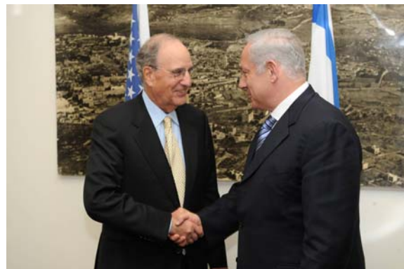
מימין: פגישת בנימין נתניהו וג'ורג' מיטשל (לע"מ, 16 באפריל, צלם: עמוס בן גרשום) משמאל: פגישת ג'ורג' מיטשל עם שר הביטחון אהוד ברק (משרד הביטחון, 15 באפריל צלם: אריאל חרמוני)

■ בעת ביקורים אלה צפה ועלתה מחדש המחלוקת המהותית סביב תפיסת שתי מדינות לשני עמים שהתגלעה גם בתקופת מפגש אנאפוליס: 1