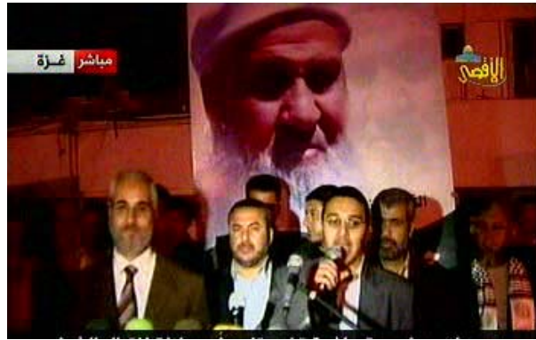
עצרת למען ביתאוי שאורגנה בעזה (ערוץ אלאקצא, 19 באפריל)

■ בהקשר זה, בהודעה לעיתונות מטעם חמאס פורסם כי 600 מפעיליה עדיין עצורים ע"י מגנוני הביטחון שח אבו מאזן ביהודה ובשומרון. ההודעה מדגישה כי על מנת להמשיך בדיאלוג יש לשחררם לא הגיוני לנהל דיאלוג על רקע האווירה השוררת ביהודה ושומרון (אלביאן, 15 באפריל).