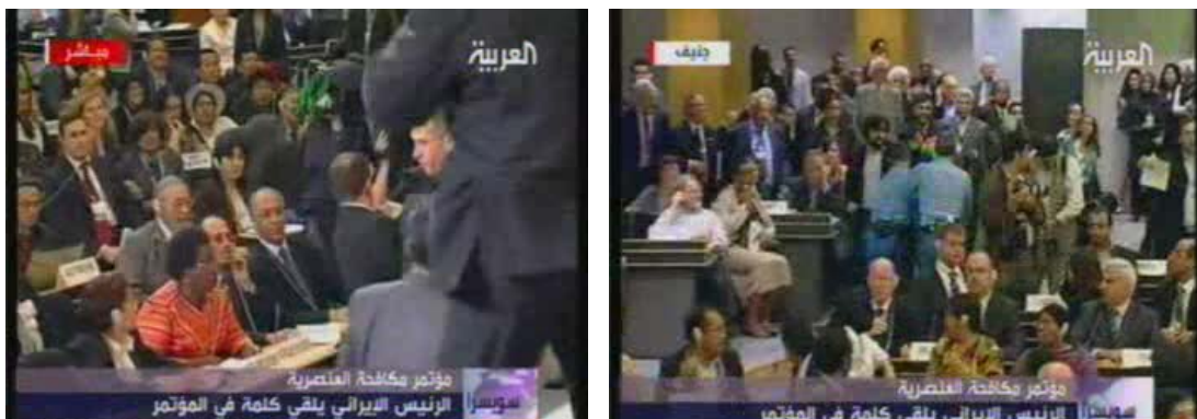
דיפלומטים עוזבים את אולם הועידה בעת נאומו של אחמדינו'אד (ערץ אלערביה, 20 באפריל)

• לדברי אחמדינו'אד הוקמה לאחר מלחמת העולם השנייה מדינה בעלת "ממשלה גזענית" [קרי, ישראל] תחת אמתלא של סבל יהודי (באומרו דברים אלו נראו דיפלומטים רבים עוזבים את האולם). הוא חזר והדגיש, כי על אדמת פלסטין קיימת מדינה גזענית והאשים את ארה"ב, מדינות המערב ומועצת הביטחון כי תרמו להקמתה של מדינה זו.