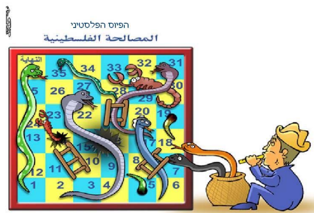
הפיוס הפנים-פלסטיני בעיני העיתונות הירדנית (אלע'ד, 8 באפריל)

■ הדיאלוג הפנים-פלסטיני אמור להתחדש בשבוע הבא לקראת חידושו נערכו שורה של דיונים פנימיים על מנת לגבש עמדות לקראת סבב השיחות הבא. אבו עלאא' אמר, כי חידושו של הדיאלוג הוקדם והוא יחל כבר ב-23 באפריל (אי, פי, 14 באפריל) מיד לאחר מכן הגיעה הכחשה מצד חמאס ואסמאעיל רצ'ואן הודיע כי לתנועתו לא נודע על שינוי מועד הדיאלוג והוא נותר ב-26 באפריל. מחמוד אלוהאר , בכיר חמאס, אמר במהלך ביקורו בירדן כי הושגו במסגרת הדיאלוג הבנות רבות וכי עתה נותרו ובעיות ספורות בלבד על הפרק. לדבריו, חמאס דנה בפתרונות פרודוקטיביים ורעיונות חדשים שהוצגו בפניה על מנת לגבש נוסח מוסכם (ערוץ אלקדס, 16 באפריל). חיליל אלחיה אמר, כי ההצעה שתציג חמאס בדיאלוג הפנים-פלסטיני במצרים תהיה הקמת ממשלה אד-הוק לצורך המוגדר של הפיוס הפנים-פלסטיני. לאחר מכן, יידונו שאר הנושאים. לדבריו התנועה תסכים רק ל"עסקת חבילה" שתכלול את כל נושאי המחלוקת (אתר אלפג'ר, 19 באפריל).