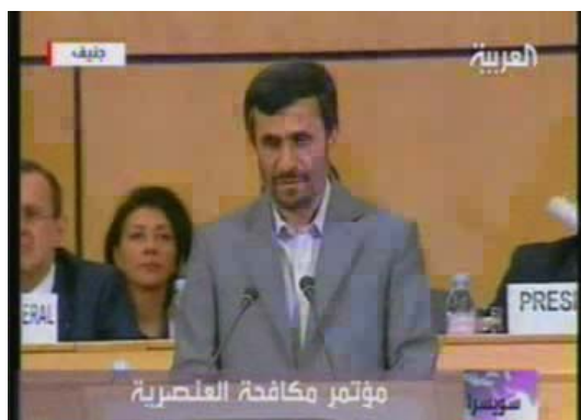
אחמדינז'אד נואם בפני באי ועידת דרבן השנייה (ערוץ אלערביה, 20 באפריל)

■ ב-20 באפריל נפתחה "ועידת דרבן השנייה" נגד הגזענות בג'נבה בה נטל חלק נשיא איראן אחמדינז'אד. במהלך נאומו בוועידה, שנישא ערב יום השואה, עזבו רוב נציגי מדינות האיחוד האירופאי בהפגנתיות את אולם הדיונים. בתגובה גינה נשיא צרפת בחריפות את הנאום והגדירו כ"בלתי נסבל". מזכ"ל האו"ם, שנועד טרם הנאום עם אחמדינז'אד, אמר כי הוא מצטער על שנעשה שימוש בבמה זו "כדי להאשים וליצור מחלוקות". בעקבות פגישה שקיים אחמדינז'אד עם נשיא שוויץ החזירה ישראל את שגרירה בשוויץ להתייעצויות.