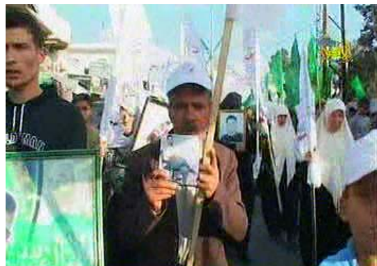
אחת מהתהלוכות לרגל יום האסיר שהתקיימה בעזה (ערוץ אקצא, 16 באפריל)