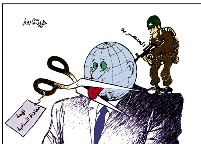
סיוע הסברתי סורי לנשיא איראן: ישראל משתיקה את העולם מפני ביקורת על גזענותה באמצעות האשמות באנטישמיות (תשרין, סוריה, 21 באפריל 2009)

• המלחמה בעיראק, לטענת אחמדינו'אד, תוכננה ע"י "המשטר הציוני" ובני בריתו בממשל האמריקאי הקודם. פעולותיה של ארה"ב באפגניסטן ובעיראק מצביעות על אגוצנטריות, גזענות וכפייה, על חשבון כבודך וריבונותך של מדינות. ארה"ב הואשמה גם במשבר הכלכלי העולמי משום שהיא כפתה מדיניות כלכלית על מדינות וממשלות המשרתות את בעלי ההון. • "הציונות העולמית", בתמיכת מדינות מרכזיות, משליטה גזענות הנתמכת ע"י דת ומנצלת את הדת על מנת להסתיר שנאה. יש להשקיע מאמצים על מנת להפסיק את ה"התעללות" הנעשית ע"י הציונים ותומכיהם ולתמוך בהתנגדות ל"גזענות הברברית".