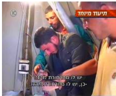
המצרים מזרימים גז למנהרות (ערוץ 10 21 במרץ)