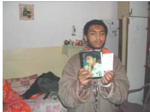
מימין: החשוד ובידו הצוואה שכתב. משמאל: הסכין שהושלכה בשטח לאחר ביצוע הפיגוע (שירות ביטחון כללי, 26 באפריל)