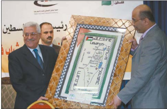
מימין: אבו מאזן מקבל לידיו את המפה. משמאל: הכתבה שהתפרסמה בעמוד השער של עיתון הרשות הפלסטינית (אלחיאית אלג'דידה, 28 באפריל).