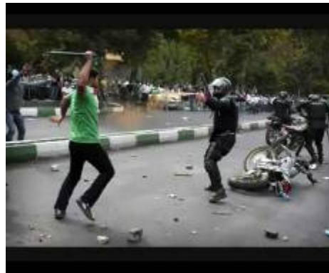
הפגנות והתנגשויות באיראן (תמונות שצולמו ע"י צלמים חובבים והועלו לרשת האינטרנט)