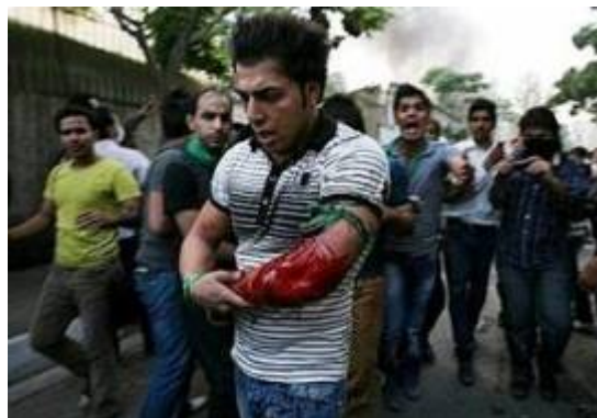
צעיר שנפצע במהלך המהומות (אלערביה, 17 ביוני)