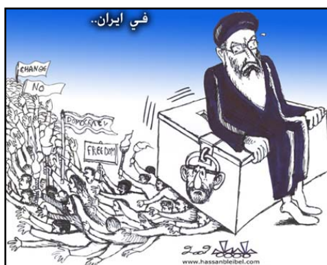
ח'מנהא'י מנסה לשמור את הקלפי, אך מתחת לקלפי המוני מפגינים הרוצים חירות... (אלמסתקבל, לבנון, 20 ביוני)