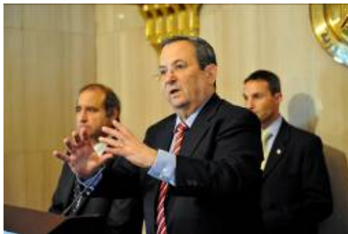
שר הביטחון ברק בתדרוך העיתונאים ( משרד הביטחון, 21 ביוני.)

■ בתדרוך כתבים בסיום הפגישות אמר שר הביטחון שהשיחות עסקו באתגרים רבים, בין השאר במצב הנוכחי באיראן, התוכנית הגרעינית של איראן והשפעתה על האזור, תוצאות הבחירות בלבנון, המצב ברצועת עזה, יוזמת נשיא ארה"ב אובמה להסדר שלום אזורי, המשא ומתן עם הפלסטינים ונושא גלעד שליט. לשאלה בנוגע לגלעד שליט ענה שר הביטחון כי "כרגע לא מתנהל מו"מ ואני הייתי מעדיף בנושא גלעד שליט לא להכריז הכרזות" (משרד הביטחון, 21 ביוני).