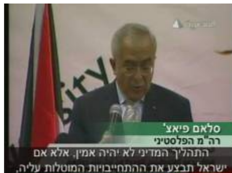
נאום ראש ממשלת הרשות סלאם פיאצ' (הטלוויזיה המצרית, 22 ביוני)

■ בנאום שנשא באוניברסיטת אלקדס באבו דיס ושהוגדר כתגובה לנאום בר אילן של ראש ממשלת ישראל הציג ראש הממשלה הפלסטיני, סלאם פיאצ', את עמדת הרשות הפלסטינית ביחס לחידוש המשא ומתן המדיני. פיאצ' קרא לישראל להקפיא את ההתנחלויות, להפסיק את "המצור" על רצועת עזה ואת הפעילות הביטחונית ביהודה ושומרון הפוגעת, לדבריו, במאמצי הרשות הפלסטינית להשליט ביטחון. סלאם פיאצ' גם הדגיש, כי על הפלסטינים לנקוט במספר צעדים להקמת מדינה לצד מדינת ישראל ובראשם שיקום המוסדות הביטחוניים והכלכליים של הרשות והוסיף כי לדעתו ניתן להשלימם בתוך שנתיים (טלוויזיה פלסטינית, סוכנות הידיעות הכווייתית, 22 ביוני).