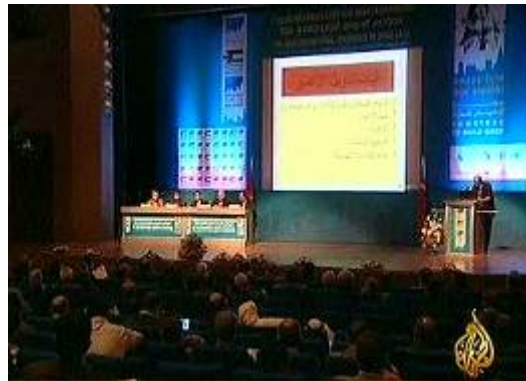
נעילת הועידה הבינלאומית לשיקום רצועת עזה (ערוץ אלג'זירה, 18 ביוני)