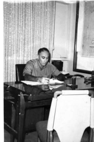
מאיר עמית בלשכתו בקריה בשנת 1963, השנה בה מילא תפקידי ראש אמ"ן וראש המוסד במקביל במשך שמונה חודשים.

■ כמה מהישגי מאיר עמית כראש המוסד פורסמו בתקשורת. רבים אחרים נותרו סמויים מעינו של הציבור. אחד הבולטים שבהישגים היה הבאת טייס המיג העראקי לישראל (1966). במהלך שרותו כראש המוסד פעל מאיר בנחישות להחזיר את אסירי ה"פרשה" הכלואים במצרים מאז 1954, בהובילו את החזרתם לישראל לאחר מלחמת ששת הימים. ערב מלחמת ששת הימים יצא מאיר בשליחות לוי אשכול לארה"ב במהלכה עלה בידו להשיג "אור ירוק" מהממשל האמריקאי לפתיחה במלחמה. כותב מאיר עמית בספרו ראש בראש (עמוד 241): "אחרי שלושים ושש שעות עזבתי את וושינגטון מחוזק בעמדתי ונחוש בדעתי להמליץ לממשלה לפתוח במתקפה מיידית..." את מסקנתו זאת הציג עמית בפני ישיבת ממשלת ישראל במוצאי שבת, ה-3 ביוני 1967. והשאר היסטוריה.