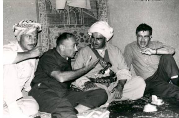
מאיר עמית נפגש עם מנהיג הכורדים מולא מצטפא ברזאני בהרי כורדיסטאן (1966). בתפקידו כראש המוסד טיפח מאיר מערכת יחסים עניפה עם התנועה הלאומית הכורדית.

■ בספטמבר 1968, לאחר שסיים את תפקידו כראש המוסד, מונה מאיר עמית למנכ"ל קונצרן "כור" , הקונצרן התעשייתי הגדול ביותר של ההסתדרות שחלש באותם ימים על חלק גדול מהתעשייה בישראל. הוא הפך את "כור" לחברה כלכלית מודרנית, עם חטיבות מתמחות ומפעלים רווחיים. שנותיו בראשות כור היו הימים הטובים של התעשייה ההסתדרותית.