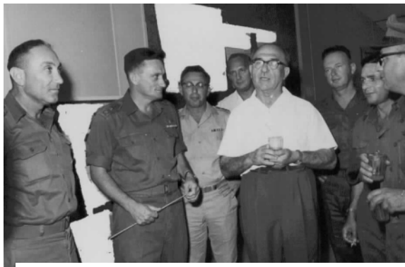
ראש הממשלה לוי אשכול מבקר ביחידת אמ"ן בשנת 1963. משמאל: האלוף מאיר עמית. מימינו של אשכול: יצחק רבין.

צמח בתוך קהילת המודיעין אלא בדרג הצבאי-מבצעי. בתפקיד זה חיזק מאיר עמית את יחידות איסוף המודיעין. ב-1963 מונה מאיר עמית על ידי בן גוריון לראש המוסד . באותה שנה כיהן מאיר עמית כראש אמ"ן וראש המוסד בו זמנית, תקדים יחיד בקהילת המודיעין הישראלית. בשנים 1964-1968 הוא כיהן כראש המוסד . בתפקידו אלו עיצב מאיר עמית את דמותם של אמ"ן ושל המוסד והתאימם לאתגרי המחר. הוא העמיק את שיתוף הפעולה בין המוסד לאמ"ן. תוך שהוא מביא עימו את המנהיגות הנדרשת לכך ואת ראיית צרכי המודיעין מנקודת מבטו של הצרכן, מקבל החלטות.