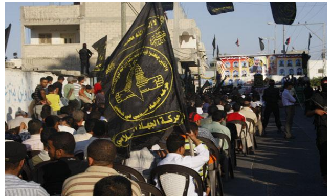
עצרת הג'האד האסלאמי בפלסטין ומפגן צבאי בהשתתפות פעילים חמושים מהזרוע הצבאית של הארגון (פאל טודיי, 24 ביולי)