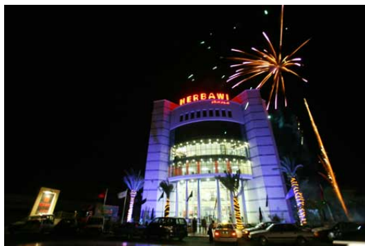
הקניון החדש בג'נין. מבט מבפנים ומבחוץ