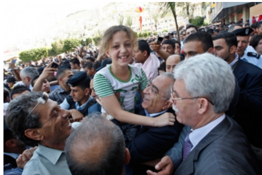
צילומים מאירועי הפסטיבל בשכם

■ התוצאות החיוביות של ההקלות הישראליות מצאו ביטוי בכתבה שהתפרסמה לאחרונה ע"י כתב אתר חדשות קנדי (פטריק מרטין, The Globe and mail, 24 ביולי). הכתבה מתארת את תנופת הבנייה בראמאללה ואת בתי הקפה המודרניים וחנויות בגדי האופנה שבעיר. היא מציינת כי בג'נין , אשר נחשבה בעבר לעיר האלימה ביותר, נהנים התושבים כיום מקניון בעל 5 קומות. רבים ממבקרי הקניון הינם ערבים ישראלים, אשר כיום מקבלים אישור לצאת לשטחי הרשות הפלסטינית.