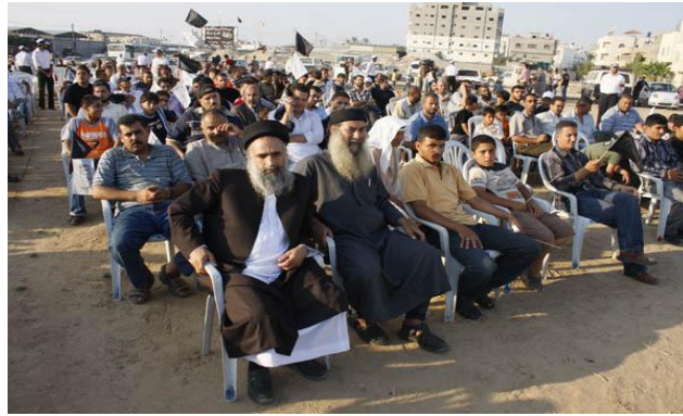
פעילי מפלגת השחרור בעת הכינוס