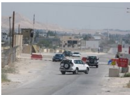
הכניסה הדרומית ליריחו לאחר הסרת המחסום

■ על רקע השיפור במצב הביטחוני ביצעו בחודשים האחרונים כוחות צה"ל שורה של הקלות בשטח, ברחבי יהודה ושומרון, אשר הקלו באופן משמעותי על חופש התנועה של התושבים הפלסטיניים. במסגרת ההקלות הללו הוסרו במהלך חודש יוני מספר מחסומים מרכזיים באזורים הבאים: ראמאללה (מחסום רימונים ומחסום ביר זית, 3 ביוני); קלקיליה (5 ביוני); שכם (מחסום חווארה, 16 ביוני); יריחו (17 ביוני).